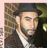
PLV / Spia