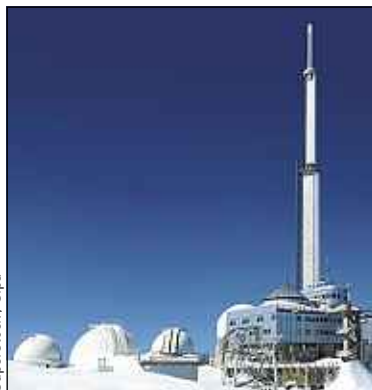
Le pic du Midi (archives).