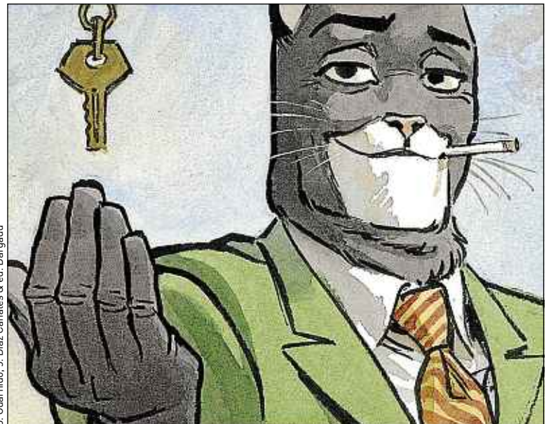
J. Guarnido, J. Diaz Canales & éd. Dargaud

Blacksad tome 5 Amarillo de Juan Diaz Canales et Juanjo Guarnido, Dargaud, 13,99 €.