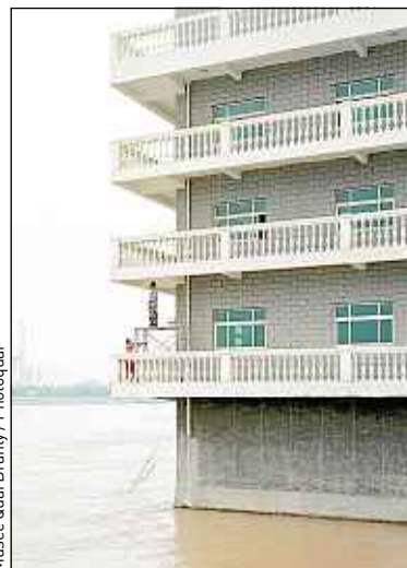
Musée Quai Branly / Photoquai

mandé, mais se plaint de ne pas avoir bien travaillé. « Tous ces contacts institutionnels, c'est épuisant. En plus, Paris est symboliquement la ville de tous les clichés. Pourtant, depuis que je suis ici, je n'ai pas pris une seule photo. Il faut du temps pour dépasser les images de Paris qu'on a en tête. Je voudrais faire autre chose que des photos de touristes. » ■ B. C.