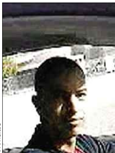
Un homonyme du tueur Mohamed Merah (ci-dessus) a été insulté.