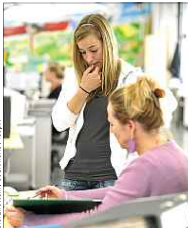
Le VIE permet de découvrir le monde et les rouages de l'entreprise.

Permettre à des jeunes de découvrir le monde de l'entreprise et le monde tout court : c'est l'objectif du volontariat international en entreprise (VIE). Depuis sa création il y a treize ans, il a déjà bénéficié à plus de 44 500 personnes. S'il est ouvert à tous les diplômés, les bac + 5 représentent plus de 90 % des effectifs. Ce qui chagrine la ministre du Commerce extérieur, Nicole Bricq : « Je veux que le VIE profite davantage aux bac+2 ou bac+3, pour qu'ils fassent leurs armes à l'international et trouvent plus facilement un emploi. »