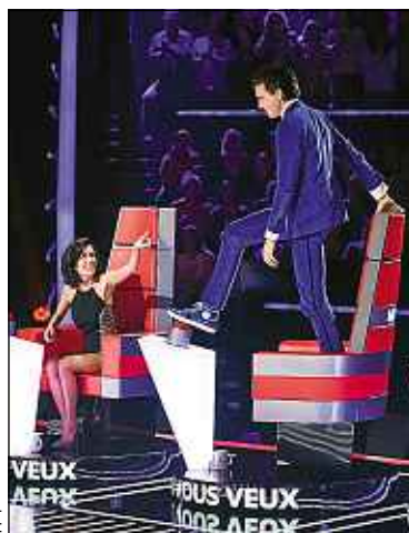
Mika va faire le spectacle.

► Du show. Il se bat dès la deuxième candidate. Pour la convaincre, il la met dans son fauteuil et s'installe au piano. Première évidence : Mika promet du show. Il grimpe sur son siège pour danser, buzze avec le pied, sourit aux ca-