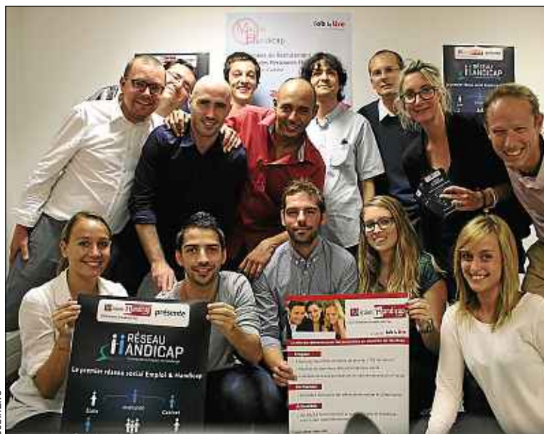
L'équipe de JobinLive a commencé l'aventure Réseaux-Handicap cette année.