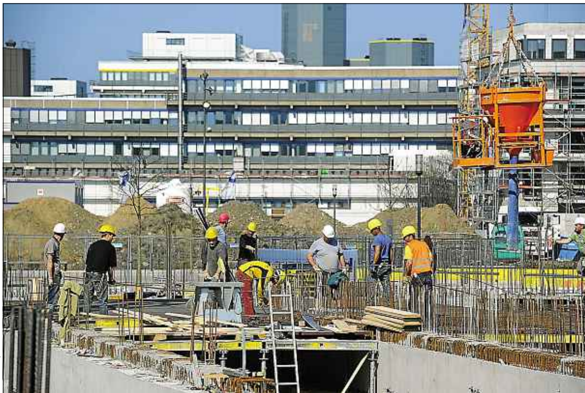
P. Stollarz / AFP