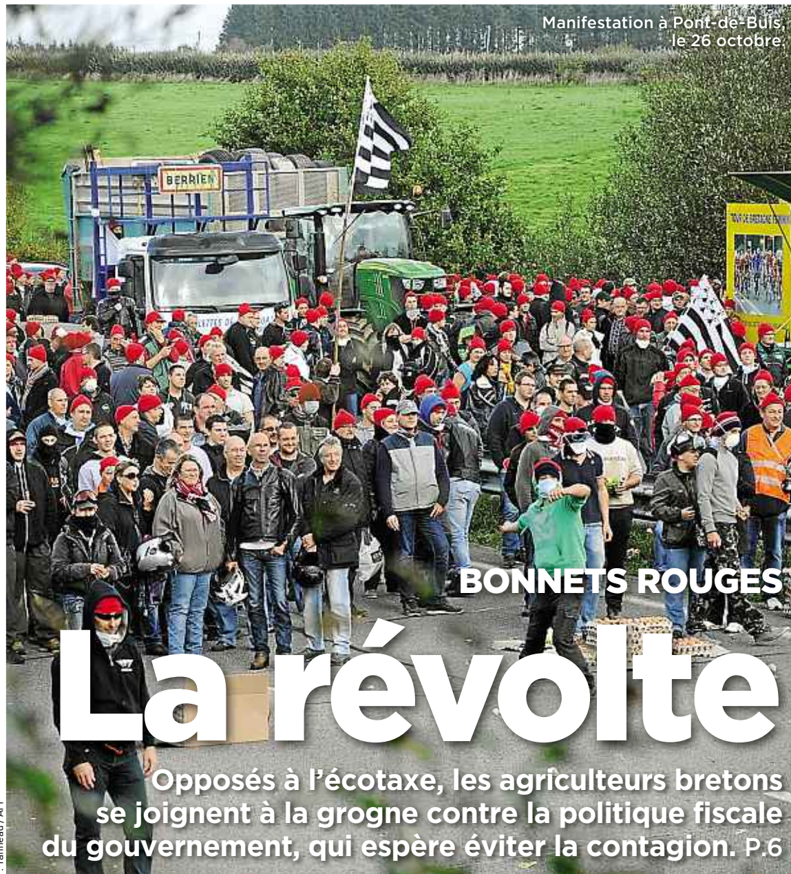
Manifestation à Pont-de-Buis, le 26 octobre

Paris revient de nulle part contre Saint-Etienne P.18