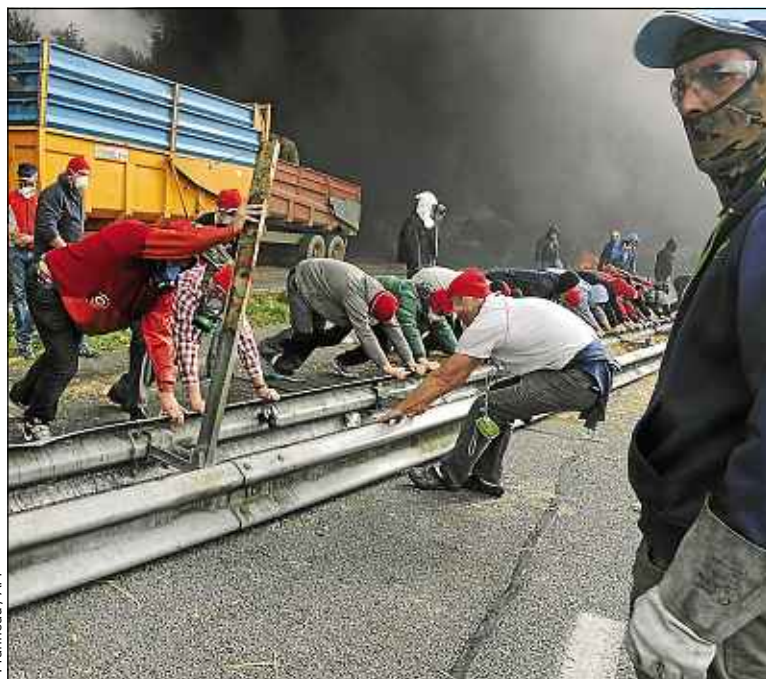
Au moins mille mécontents sont venus protester dans le Finistère.

Samedi 2 novembre, une nouvelle manifestation « Pour l'emploi et la Bretagne et contre l'écotaxe » se déroulera à Quimper et les organisateurs promettent déjà le rassemblement de tous les opposants de la région. « Une véritable