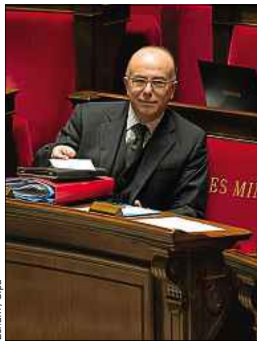
Bernard Cazeneuve a fait marche arrière sur la taxation des PEA et PEL.

Le ministre de l'Agriculture, Stéphane Le Foll, a assuré avoir « parfaitement entendu et compris » le message exprimé par les manifestants bretons contre l'écotaxe. Dimanche, sur France 5, il a affirmé qu'il remettrait « des propositions au Premier ministre » ce lundi, comportant notamment des mesures pour l'agriculture et l'agroalimentaire. Sur la possibilité d'augmenter la détaxe de 50 % accordée à la Bretagne, il a estimé qu'il s'agissait d'« une bonne piste ».