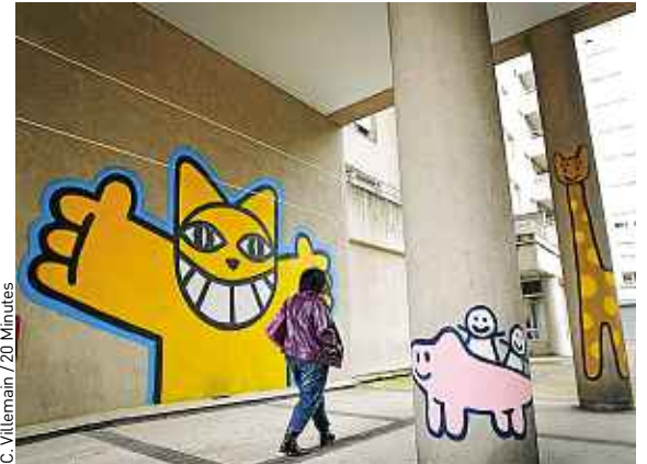
Les dessins ont été conçus par les enfants autistes et réalisés par le graffeur à Villeurbanne.

explique Marie-Maude Geofray, praticienne à l'Ittac. On voulait quelque chose de plus coloré et de plus vivant pour les enfants. » « J'avais envie de casser les clichés sur le handicap et de montrer que ces enfants sont comme les autres, souligne M. Chat. Nous aussi, graffeurs, sommes encore victimes de préjugés. » L'artiste est intervenu plusieurs fois auprès des enfants, qui se sont également rendus dans son atelier à Paris. ■ A Lyon, Caroline Girardon