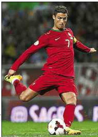
L'attaquant Cristiano Ronaldo.

Patrice Evra en veut beaucoup à certains consultants. « D'abord, il y a Michel Fernandel [Luis Fernandez]. Lui, quand on lui a donné les clés du PSG, à part sucer des Chupa Chups et danser la Macarena au bord du terrain, qu'est-ce qu'il a fait ? » Il s'en prend aussi à Bixente Lizarazu, Pierre Menès, qu'il menace à mots couverts. « Et comment il s'appelle l'autre, Tournevis, là ? Rolland Tournevis [Rolland Courbis]. Sur RMC, il fait que parler. »