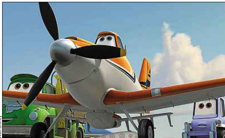
Dusty veut devenir champion, mais il devra d'abord vaincre son vertige.