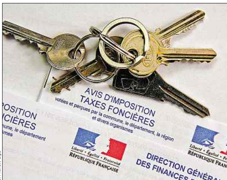
Les collectivités locales comptent sur la taxe foncière et la taxe d'habitation.

Autre levier d'action : les droits de mutations prélevés par le notaire au moment de l'achat d'un bien immobilier pour le compte de l'Etat, des départements et des communes. « Cette ressource importante a été un peu amoindrie l'an dernier par le ralentissement du marché immobilier mais, en compensation, le gouvernement vient de relever les plafonds de ces droits de mutation [de 3,8 % à 4,5 % de la valeur du bien en 2014 et 2015] et les départements devraient donc recourir à cette possibilité », estime Jacques Le Cacheux. ■