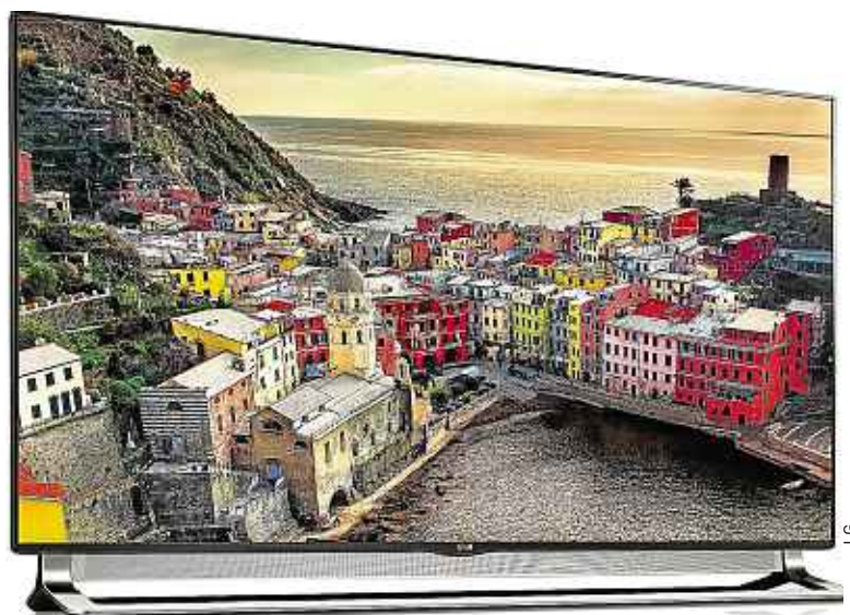
En 55" et 65", le LA9700 de LG fait partie des premiers téléviseurs Ultra HD.

Petit hic cependant : pour l'heure, il n'existe pas de programmes en UHD native ( lire ci-contre ). « Tous les téléviseurs Ultra HD convertissent les signaux Full en HD dans une qualité proche de l'UHD », rassure Philippe Lasne, directeur du marketing chez LG France. Et c'est vrai qu'à l'écran, le résultat est plutôt bon. ■