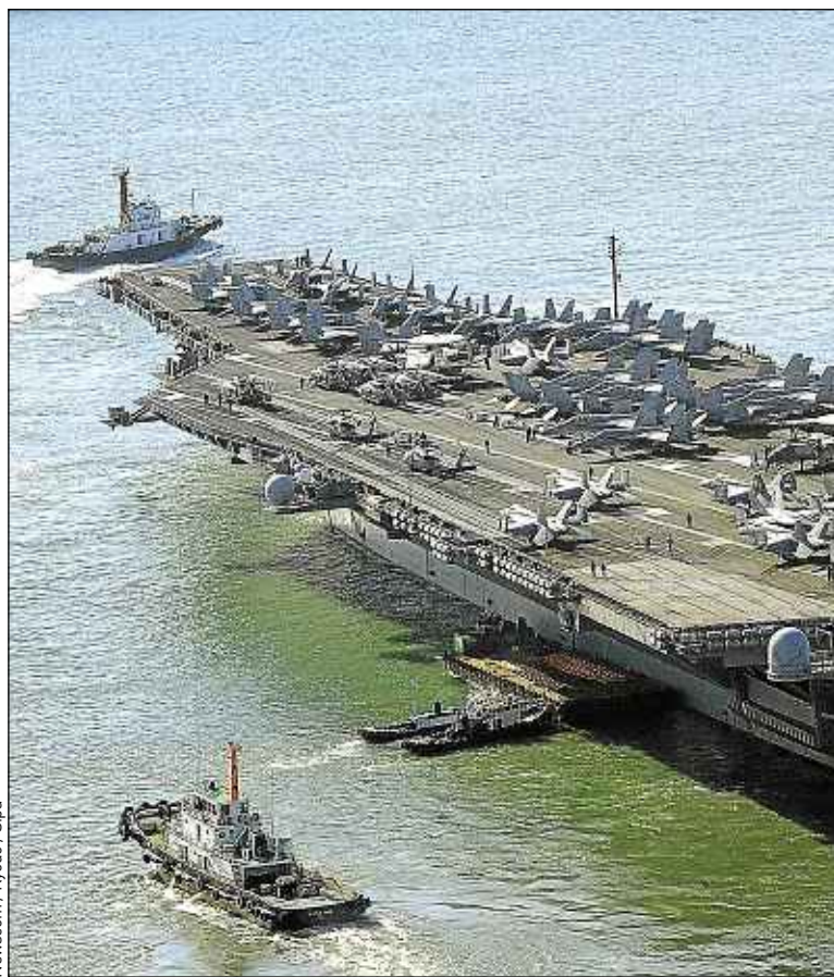
Ce porte-avions américain stationne actuellement en Corée du Sud.

L'expert estime qu'il n'y a aucune raison de s'inquiéter. Car, à travers ses menaces, le régime nord-coréen poursuit en réalité deux objectifs. Primo, remobiliser ses citoyens, « en les soudant autour de la peur de l'extérieur ». Secundo, provoquer de nouvelles négociations, notamment avec la Corée du Sud, « et obtenir ainsi des cadeaux, tels que des céréales, des engrais ou encore des produits médicaux ». « C'est ce qui arrive à chaque fois », assure le chercheur, qui souligne les graves difficultés économiques de ce pays, et notamment ses pénuries alimentaires chroniques. ■