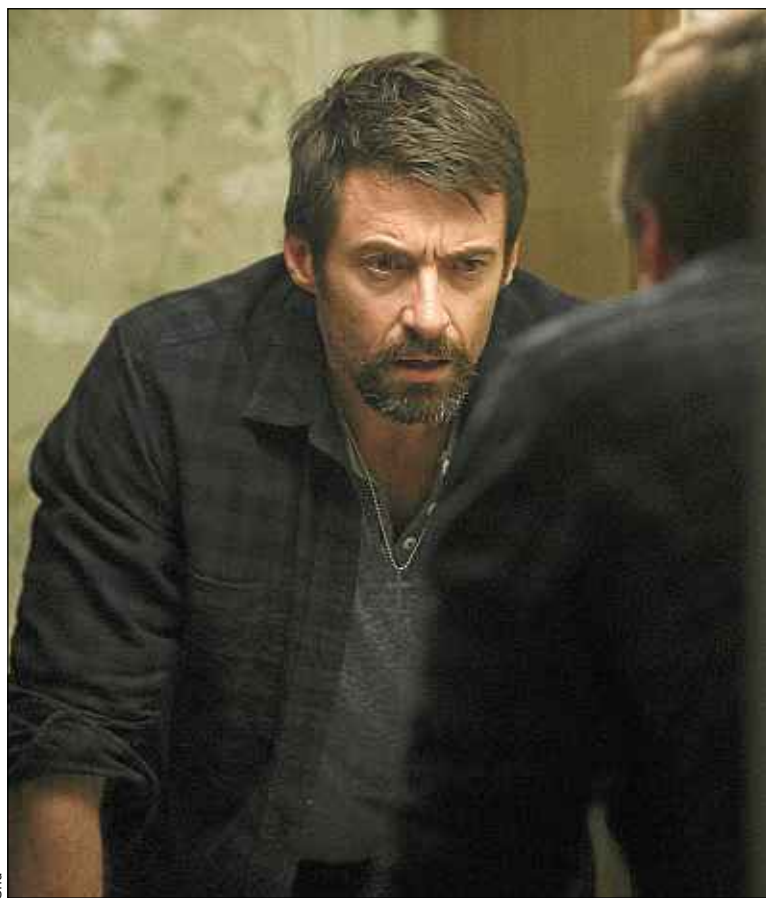
Hugh Jackman s'est renseigné sur l'alcoolisme et le survivalisme.

Nous étions totalement en phase sur le sujet. Les Américains ont agi de même vis-à-vis de leur gouvernement et de la menace terroriste. En fermant les yeux, on cautionne certaines pratiques, même si on n'agit pas soi-même. ■