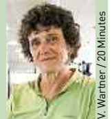
V. Wainner / 20 Minutes

Marseille et Ajaccio accueilleront, du 21 au 25 octobre, le 3 e Congrès international des aires marines protégées. Depuis sa première édition en 2005, cette manifestation est l'occasion de faire avancer la protection des mers, et la France, présente dans les quatre océans, sait qu'elle peut relever ce défi. Alors que la Convention sur la diversité biologique a fixé un objectif de 10 % des eaux mondiales à protéger d'ici à 2020, notre pays a en effet placé son ambition à 20 % d'aires protégées, soit le double, au même horizon. Ce congrès sera l'occasion de protéger de nouvelles aires marines comme la zone entre les îles de Prince-Edward et les îles Crozet dans les mers australes. ■ Isabelle Autissier, présidente du WWF France