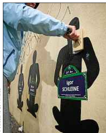
A. Gelebart / 20 Minutes