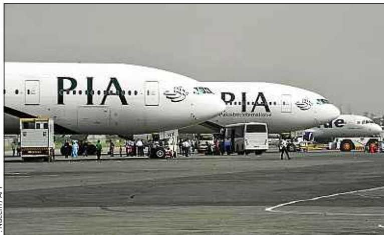
Naamen Maziche a été extradé mardi depuis l'aéroport d'Islamabad.

« Il est arrivé par avion dans l'après-midi à Paris », selon une source diplomatique. Il devait y être aussitôt arrêté, puis interrogé par la police, avant de probables poursuites. ■