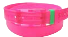
Ceinture Skimp en plastique recyclé, 46 € www.skimp.fr