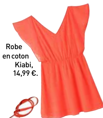
Robe en coton Kiabi, 14,99 €.