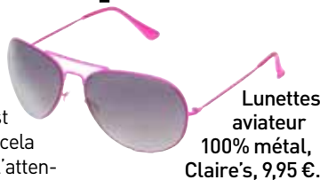
Lunettes aviateur 100% métal, Claire's, 9,95 €.

D'ici là, on ne doute pas que Rihanna aura encore su faire quelques pieds de nez au bon goût. A ne surtout pas imiter, on est bien d'accord... ■