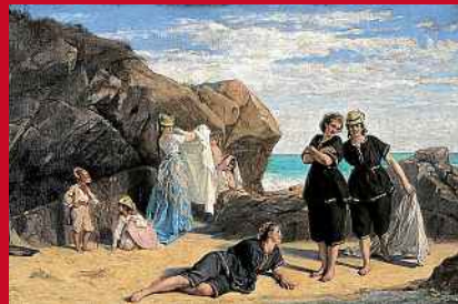
Musée Villa Montebello / Trouville-sur-Mer

Honfleur L'exposition « Les femmes et la mer » au musée Boudin présente notamment Les Baigneuses d'Antigna.