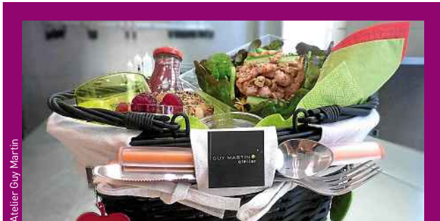
Atelier Guy Martin

Paris L'Atelier Guy Martin a imaginé 10 assortiments pique-nique. Ecolos, les chefs offrent de goûter à qui rapporte le panier ! 20 €.