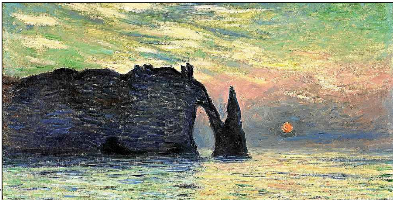
Etretat soleil couchant de Monet fait partie des cent chefs-d'œuvre impressionnistes exposés au musée des Beaux-Arts de Rouen.

ÉVÈNEMENT Le festival Normandie impressionniste se déroule pendant tout l'été