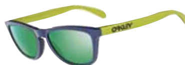
Lunettes Oakley Frogskin, 128 €.