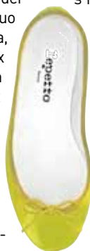
Ballerine cendrillon Repetto, 180 €.

Alors comment porter ses derniers achats ? « Les tons fluo sont très durs au teint. Et cela, surtout pour les peaux claires. Donc, on évite d'en porter sous le visage. » Exit donc le collier plastron dégoté pour quelques euros chez H&M. Sauf pour celles qui ont la chance de ne pas ressembler à un cachet d'aspirine : les peaux noires, métissées, méditerranéennes bref bien habillées pourront se permettre un peu plus. Pour