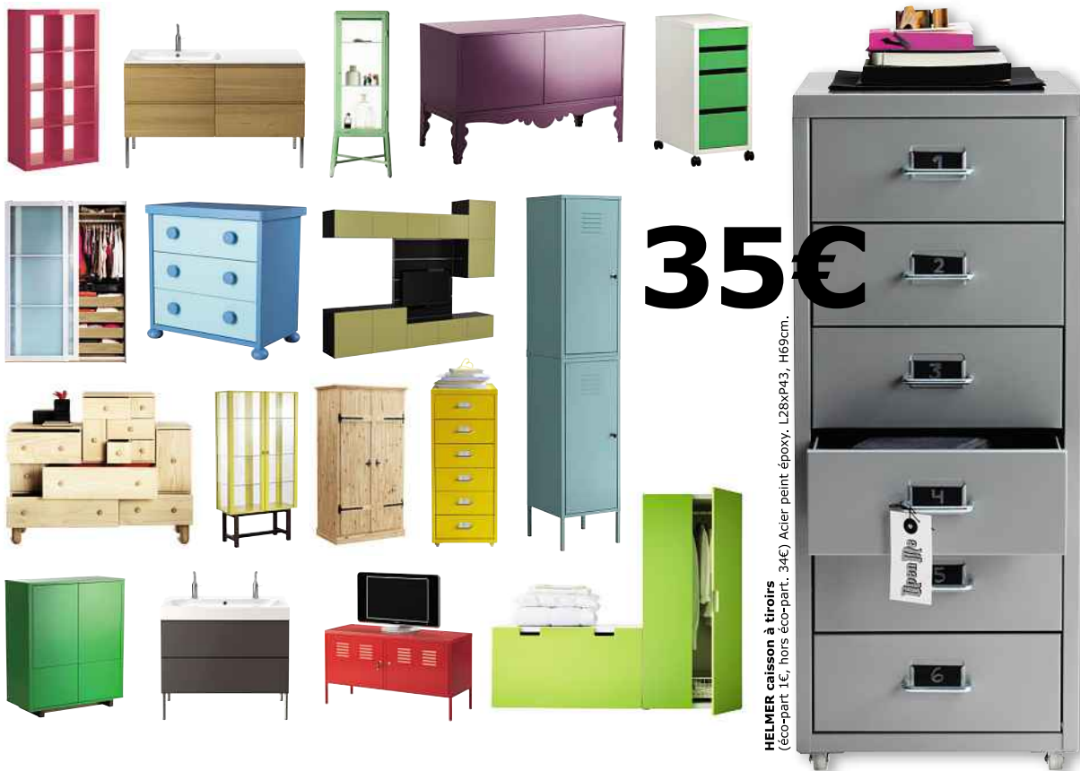
HELMER saison à tiroirs (éco-part 1€, hors éco-part. 34€) Acier peint époxy. L28xP43, H69cm.

(1) Mobilier de rangement salon, chambre, entrée, salle de bains, pièces annexes, bureau et aménagements intérieurs KOMPLEMENT, EXPEDIT et INREDA.