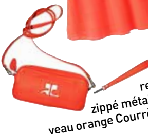
Mini sac rectangulaire zippé métal argent en veau orange Courrèges, 550 €.