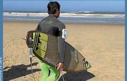
Move 'N See

Jukebox Sonorisez vos soirées d'été avec cette puissante enceinte nomade. Party time ! UE Boom, 249 €.