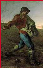
Museum of Fine Art, Boston

Granville Cette robe Pompon de 1952 de l'exposition « Impression Dior » n'est pas sans rappeler Coquelicots de Monet.