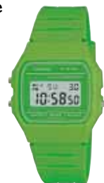
Montre Casio vintage, bracelet en résine, 30 €.