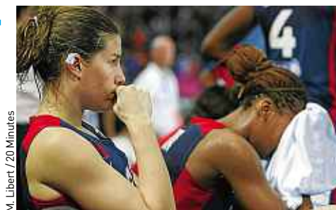
M. Libert / 20 Minutes