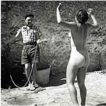
Pierre Jamet / Coll. Corinne Jamet