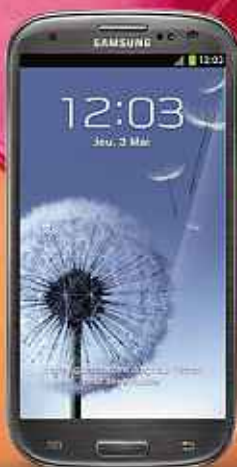
Samsung Galaxy S3 titanium DAS (2) : 0,342 W/kg