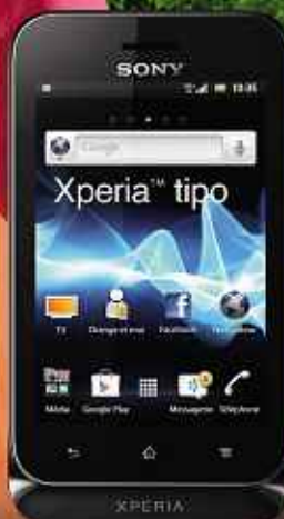
Sony Xperia tipo noir DAS (2) : 1,62 W/kg