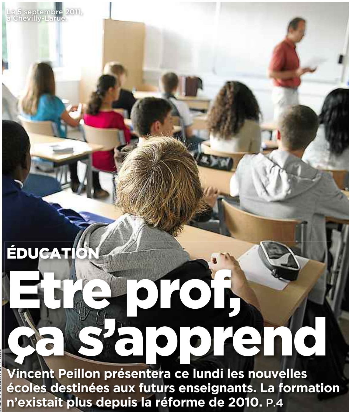
Alexandre Gélébart / 20 Minutes