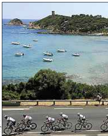
Les coureurs du Tour de France.

Quatre traversées spéciales de ce bras de Méditerranée sont prévues par la compagnie depuis la région de la Balagne, entre Calvi, ville d'arrivée de la