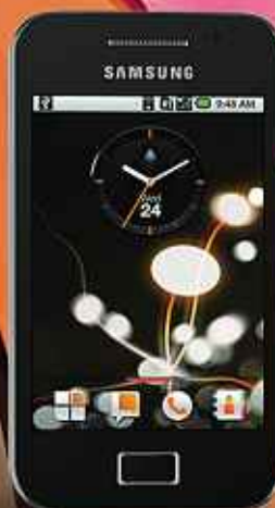
Samsung Galaxy Ace noir DAS (2) : 0,616 W/kg