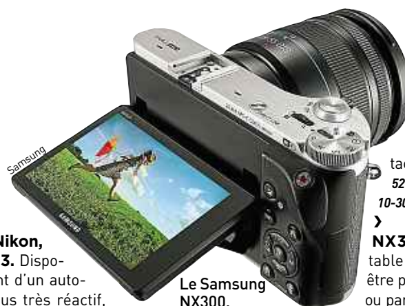
Le Samsung NX300.

tactile et le wi-fi. 529 € (avec 10-30 mm).