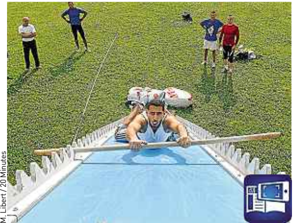
M. Libert / 20 Minutes

Sur votre smartphone, une vidéo de l'entraînement.