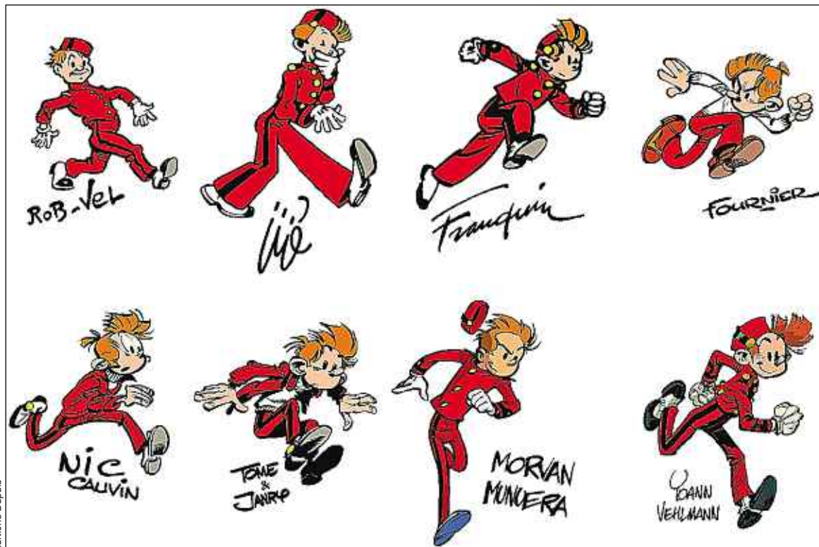
L'évolution du dessin du personnage de Spirou depuis sa création en 1938 sous le pinceau de Rob-Vel.

« Spirou a été dessiné par de multiples auteurs qui lui ont permis de s'adapter à l'air du temps. »