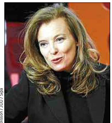
Valérie Trierweiler ne répond plus aux twittos.