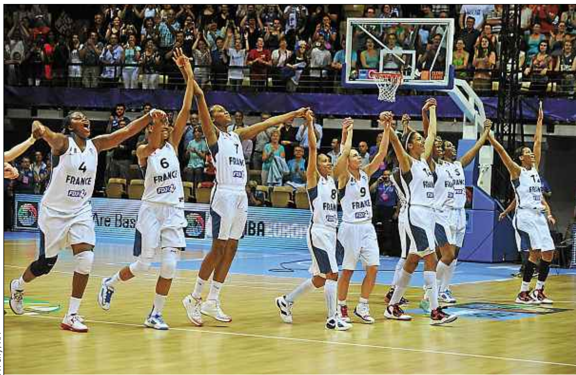
Les joueuses de l'équipe de France sont pour l'instant invaincues lors de cet Euro.

« Elle a un peu deux de tension (rires). Même quand elle fait des un contre un, c'est toujours en mode ra-