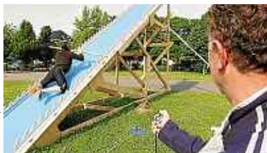
M. Libert / 20 Minutes

A « Intervilles », un match retour, 51 ans après P.2