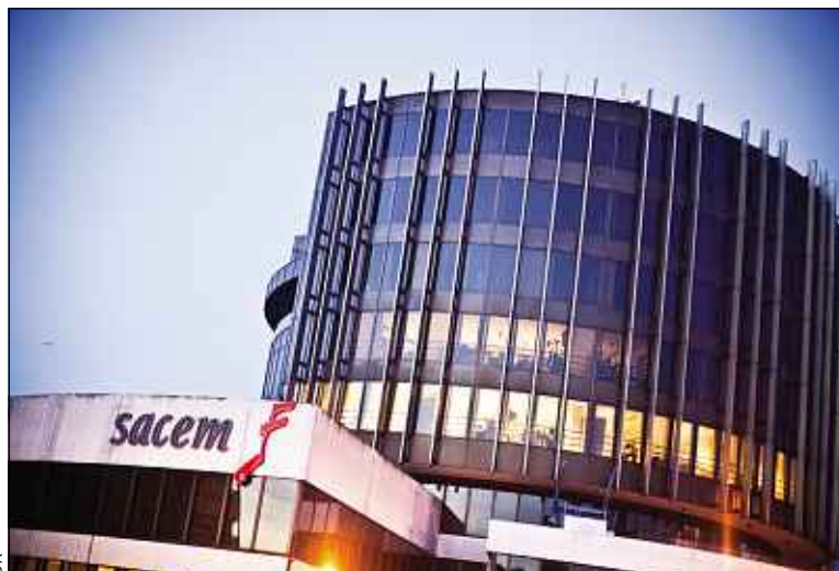
La société représente 70 millions d'œuvres du répertoire mondial.

Société civile à but non lucratif gérée en coopérative, elle est, selon Jean-Noël Tronc, son directeur, « la maison des artistes qui fabriquent de la musique ». La loi lui accorde le monopole en France pour la collecte et la répartition des droits d'auteur. Elle compte 145 000 sociétaires, la quasi-totalité des auteurs de musique en France, parmi lesquels