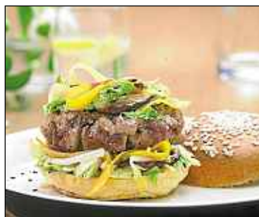
Virginie Garnier / Stylisme Marion Chateletain

➤ Tailler en petits cubes d'un demi-centimètre le poisson. Les mettre dans un bol sur des glaçons, ajouter une demi-cuillère à soupe de sauce soja et du poivre moulu. Mélanger vivement à