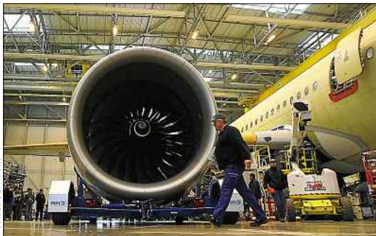
Afin d'honorer ses commandes, la filière continue à recruter.

La filière se démène et innove pour repérer, former et recruter les compétences nécessaires pour honorer ses commandes. « Nous avons des besoins importants, des ingénieurs aux techniciens, mais aussi des exigences de qualification élevées à tous les niveaux de