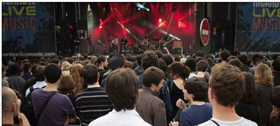
V. Wartner / 20 minutes