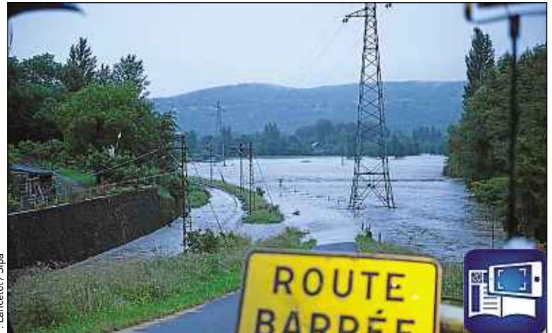
La dernière victime avait emprunté une voie barrée par les pompiers.