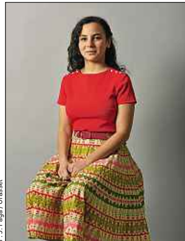
F. J. Paga / Grasset

Cléo Le Tan dépeint une famille bourgeoise et loufoque, attachante et aliénante, violente et dysfonctionnelle. « Comme toutes les familles ! », précise-t-elle. Dans son roman, Michel, le père, est décrit comme un artiste érudit aussi drôle qu'introverti. La sœur, Pénélope, comme une femme ambitieuse et sensible, séduisante et psychorigide. Derrière ces personnages de