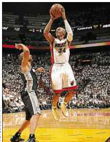
Tony Parker et Ray Allen.