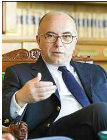
V. Wartner / 20 Minutes

Constatez-vous une hausse du nombre d'évadés fiscaux qui