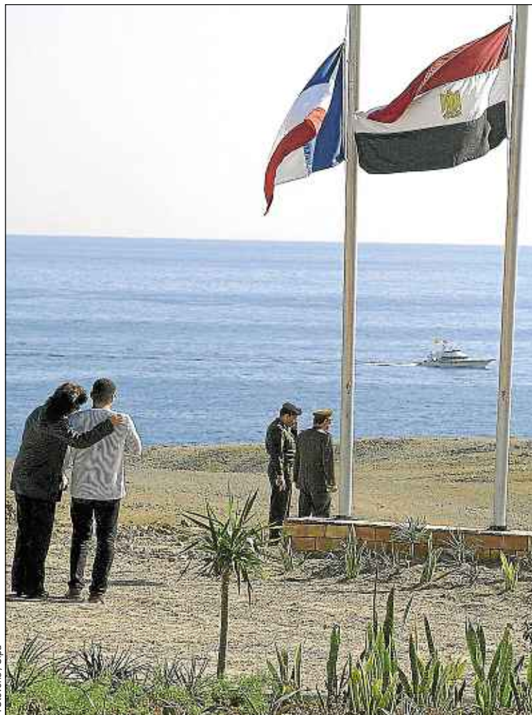
Le crash avait causé la mort de 148 personnes, dont 135 Français, en 2004.

Questionnées par trois commissions rogatoires internationales, les autorités égyptiennes ont en effet clairement indiqué qu'elles refusaient de collaborer. « Les juges ont notamment réclamé l'enregistrement des voix des pilotes, poursuit Jean-Pierre Bellecave. Est-ce-que cela aurait permis d'en savoir plus ? Je ne sais pas... » Car le dossier est déjà bien épais. En 2009, un rapport d'experts avait déjà pointé « le manque de formation et d'expé-