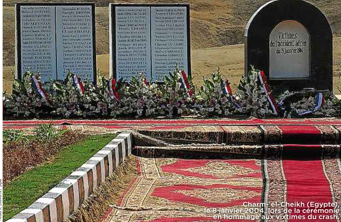
Charm-el-Cheikh (Egypte), le 8 janvier 2004, lors de la cérémonie en hommage aux victimes du crash

Près de dix ans après l'accident d'avion qui a causé la mort de 135 Français en Egypte, le juge qui instruit l'enquête s'apprête à prononcer un non-lieu. P.6