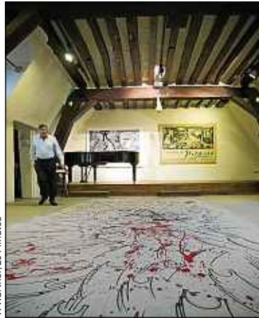
Picasso a peint Guernica , son œuvre la plus célèbre, dans ces lieux.

C'est un lieu rare. Les 250 m 2 du Grenier Picasso, nichés au dernier étage de l'hôtel de Savoie, au 7, rue des Grands-Augustins à Paris (6 e ), ont vu passer quelques grands noms de ce siècle, comme Picasso, qui y a peint son tableau le plus célèbre, Guernica , en 1937. Cet espace se retrouve aujourd'hui au cœur d'un conflit entre la Chambre des huissiers de justice de Paris, qui possède l'immeuble, et le Comité national pour l'éducation artistique (CNEA) qui l'occupe gracieusement depuis 2002, dans le cadre d'une convention de mécénat signée avec le propriétaire.