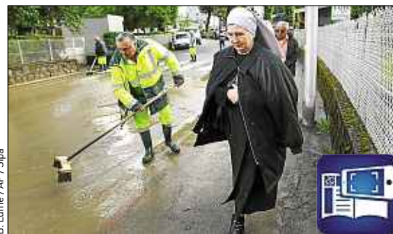
B. Edme / AP / Sipa