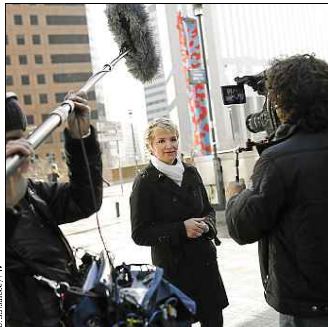
Elise Lucet, lors du tournage d'un numéro du magazine.

Les journalistes étrangers reprochent souvent à leurs collègues français de ne pas assez insister lorsqu'ils n'obtiennent pas les réponses à leurs questions. Là, on enfonce le clou. « On n'est pas les seuls à être en mode offensif, nuance Elise Lucet. Mais oui, c'est encore trop rare. Dommage, car c'est ce que les téléspectateurs attendent. Il y a trop de choses qui sortent partout pour qu'on se contente d'un refus. » En images, cela donne des questions bien senties posées pendant les AG d'HSBC ou dans les coulisses de celles d'Arcelor Mittal