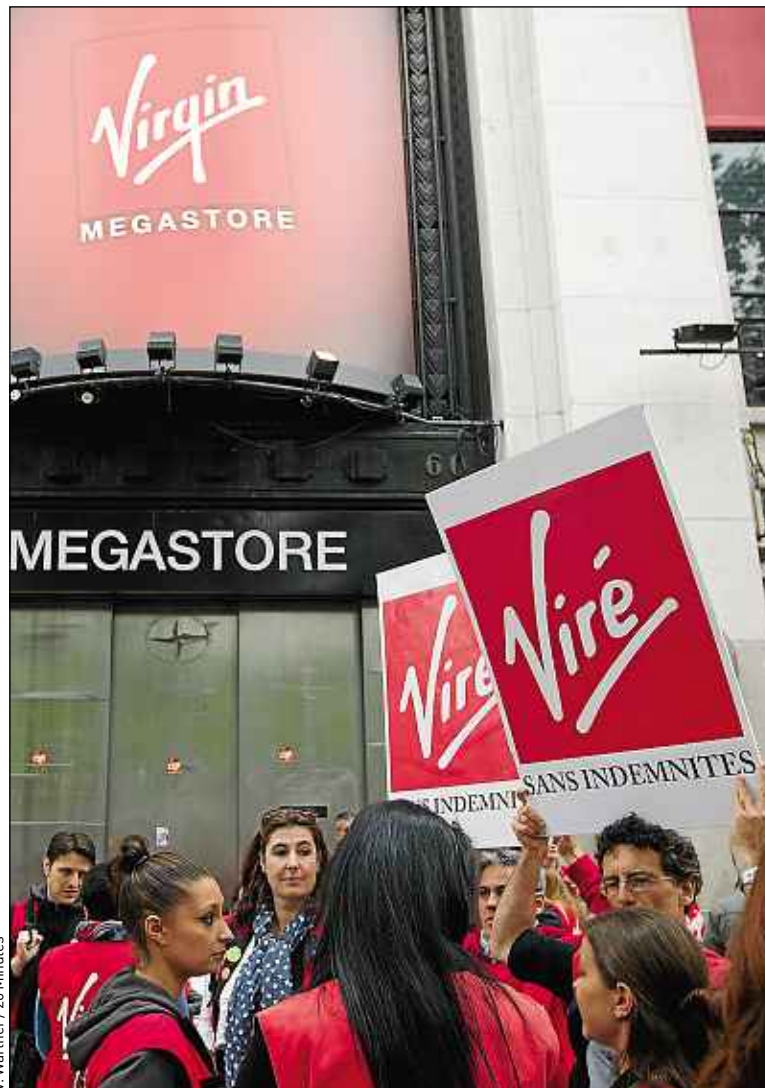
Une audience spéciale sur la liquidation judiciaire aura lieu lundi 17 juin.