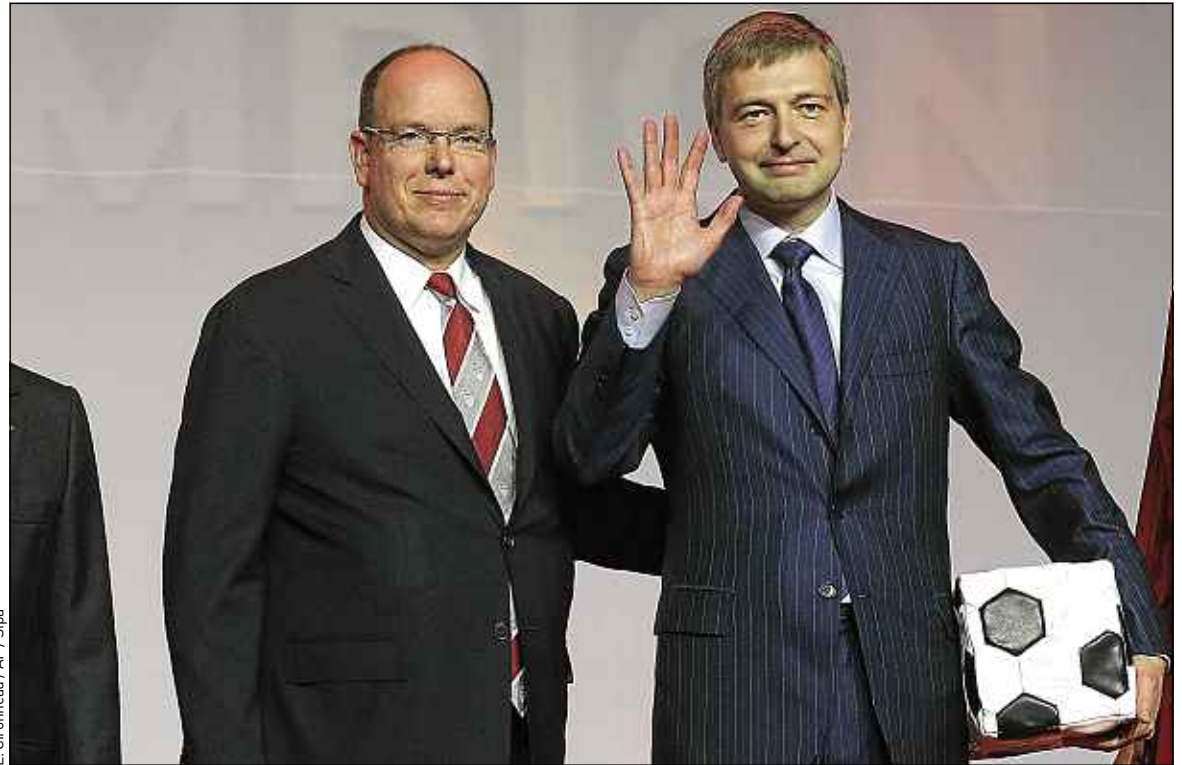
Le prince Albert de Monaco et le propriétaire russe de l'ASM, Dmitry Rybolovlev, le 31 mai.