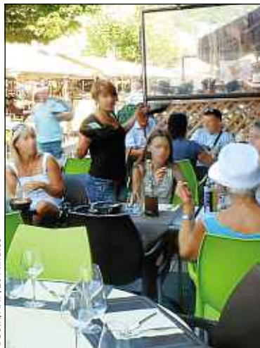
Les restos recrutent.

► Réconcilier les employeurs avec les seniors. Fin avril, les plus de 50 ans sans emploi étaient 19 110 dans