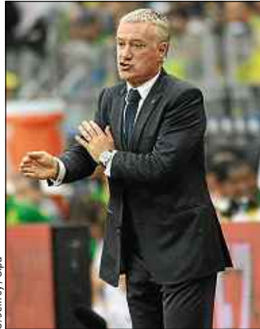
Le sélectionneur Didier Deschamps.

Critique face à des joueurs « pas là ni dans la tête ni dans les jambes » après le revers contre le Brésil (3-0), Deschamps doit faire face à certaines limites – notamment offensives – de sa