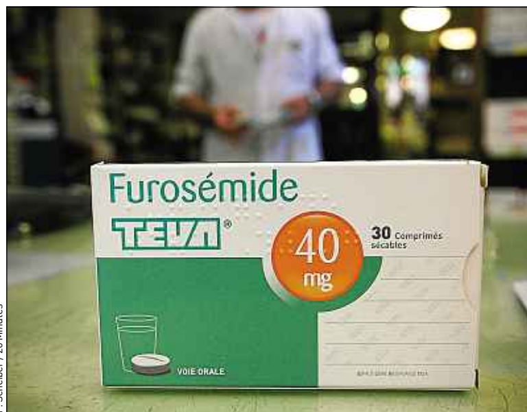
Les boîtes incriminées font partie de deux lots de 95 000 unités chacun.

› Quels sont les effets ? Le diurétique aurait été remplacé par du Zoplicone, un somnifère. S'il n'est pas dangereux en soi, il peut entraîner des effets de somnolence et donc des chutes, notamment chez les personnes âgées. Surtout, en le prenant, les patients arrêtent de prendre leur diurétique, ce qui peut conduire à des œdèmes pulmonaires et autres difficultés, notamment cardiaques. ■