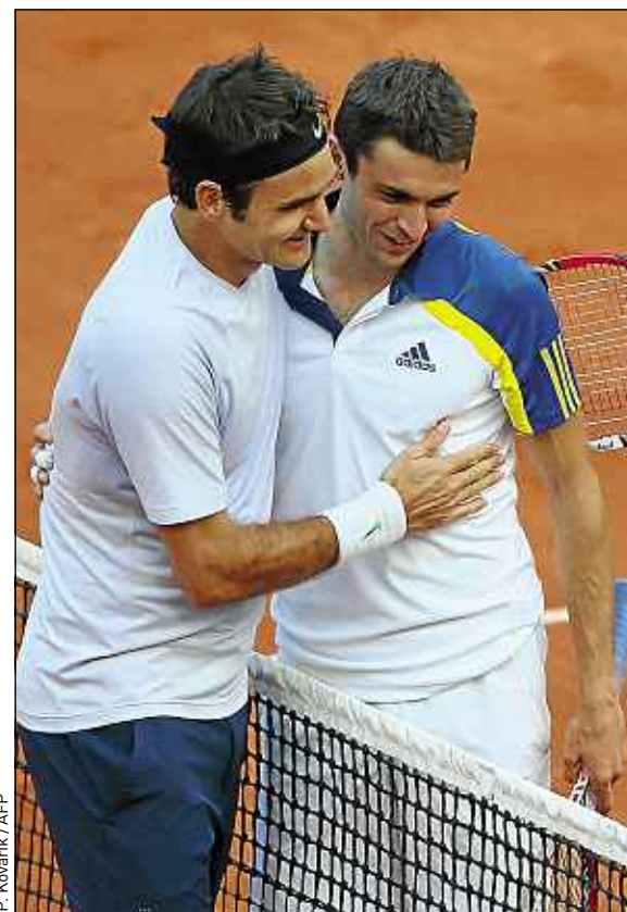
Roger Federer et Gilles Simon sont tombés dans les bras l'un de l'autre à la fin d'une rencontre haletante.

« Le numéro un français s'est qualifié pour les quarts de finale de Roland-Garros. Son parcours sans faute m'impressionne. C'est un Tsonga puissant et offensif qui sévit depuis le début de la semaine Porte d'Auteuil. Déjà quart de finaliste l'an passé, la terre battue est finalement une surface qui lui réussit bien. Depuis le début du tournoi, il n'a pas perdu un set. Il est en pleine réussite et son coup droit est fracassant. Ses progrès en revers sont remarquables. Il ne se pose pas de question, il avance. Son relâchement et sa façon d'attaquer les matchs m'impressionnent. De quoi aborder ce qui l'attend en toute sérénité. Jo est très fort, il peut aller loin. »