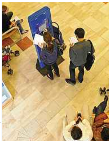
Le gouvernement va réformer la politique familiale.

Non, car seuls seront concernés 10 à 15% des foyers les plus aisés qui ga-