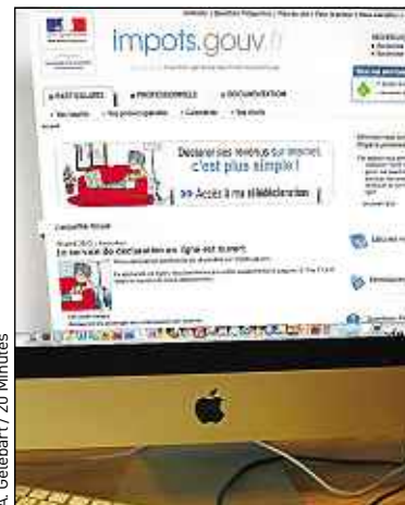
Pour certains départements, le dernier délai est ce lundi soir.

nuit. Afin d'éviter les embouteillages de dernière minute sur le serveur, connectez-vous donc au plus vite sur le site impots.gouv.fr , muni de votre formulaire de déclaration papier et de votre avis d'imposition 2012, qui contiennent les éléments pour vous identifier. Une fois cette étape franchie, il vous suffira de vérifier l'exactitude des données préremplies. Si tout est bon, trois clics permettent de signer et valider la déclaration. Y compris depuis votre smartphone via l'application Impots.gouv .