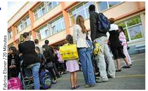
Fabrice Elsner / 20 Minutes