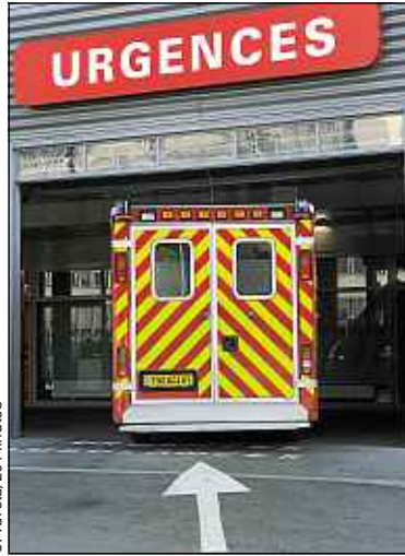
Au Nouvel Hôpital Civil.