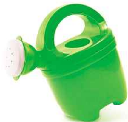
La Plage numérique