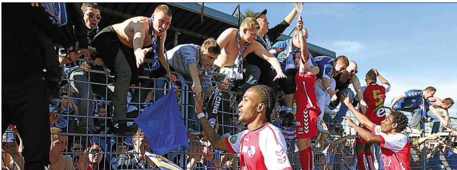
Les supporters strasbourgeois qui ont fait le déplacement à Epinal ont assisté à la deuxième montée consécutive des Strasbourgeois.

FOOTBALL Le Racing bat Raon-l'Etape (2-3)