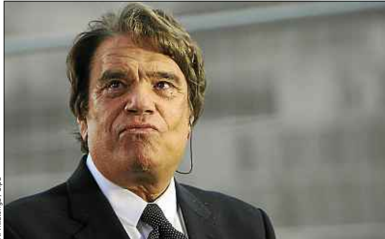
Bernard Tapie a affirmé qu'« aucun centime » n'a été indûment versé.

« Bernard Tapie dit deux choses : premièrement, s'il y a corruption, je rends l'argent ; deuxièmement, s'il y a corruption, je le découvre maintenant,