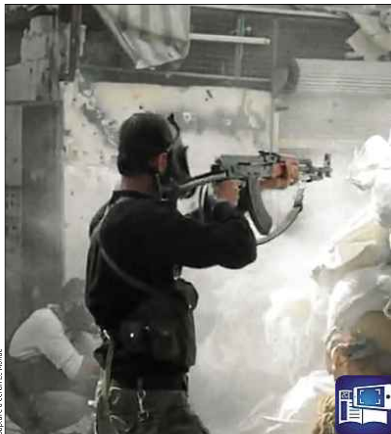
Capture d'écran Le Monde

il franchirait une « ligne rouge » qui « changerait la donne », laissant entendre que les Etats-Unis pourraient intervenir militairement. Le 30 avril, il impliquait dans cette action « la communauté internationale tout entière ». Avant toute décision, « je dois être sûr », a expliqué Obama, même si Washington a déclaré mi-mai avoir la « preuve solide » de l'utilisation de gaz chimiques. Et aucun consensus international n'existe sur cette question. Pour la France, une intervention internationale ne serait, selon le Quai d'Orsay, que la « quatrième étape » d'un processus après « l'envoi de l'Organisation pour l'interdiction des armes chimiques pour mener une enquête sur place [- mission entravée par Damas -], puis le recueil de preuves, puis le fait de savoir à qui imputer l'usage d'armes chimiques (au pouvoir ou aux rebelles ?) ». Tant qu'aucun consensus n'émergera, une intervention reste ainsi très hypothétique. ■