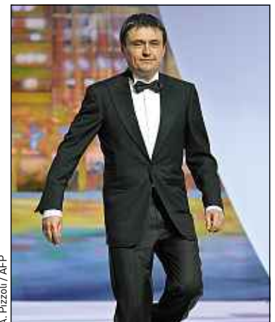
Cristian Mungiu a contribué à faire pencher la balance.

Selon nos informations, le consensus pour la récompense suprême s'était d'abord formé autour du film d'Asghar Farhadi, Le Passé . L'administration du festival a même convoqué toute l'équipe du film. On comprend dès lors bien mieux la surprise de Béatrice Bejo en entendant son nom pour le prix d'interprétation... Stupéfaction, car le règlement est formel: ce prix annulait d'un coup tout espoir de palme pour Le Passé . Que s'est-il alors passé? Dans les dernières minutes de délibération, deux des jurés, Cristian Mungiu et Lynne Ramsay, sont parvenus à renverser le consensus évoqué par Steven Spielberg. Jusqu'au bout, ce dernier a