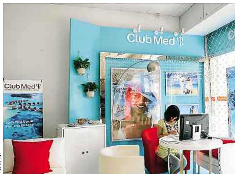
Les agences du Club fleurissent en Asie, comme ici à Pékin.