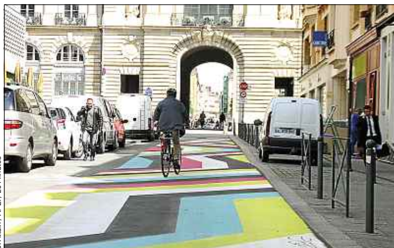
La rue Jules-Simon a été investie par les artistes suisses Lang & Baumann.

La première fois qu'ils ont peint le bitume, c'était en 2003. Sur une toute petite route, perdue au milieu du Jura. Pour leur septième œuvre de street-painting, les artistes suisses Sabina Lang et Daniel Baumann ont opté pour la rue Jules-Simon, une artère fréquentée du centre-ville de Rennes. Invités par la galerie 40mcube, ils exposeront pendant un an leurs bandes colorées, apposées sur plus de 60 m de