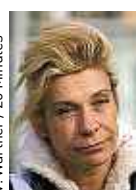
Frigide Barjot Porte-parole de la Manif pour tous

« Il faut que nous combattons encore le fondement de cette loi, mais sûrement pas son application.