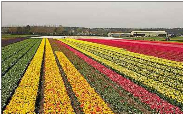
Les fleurs importées en France viennent majoritairement des Pays-Bas.

Le reste de l'année, les fleurs ont des origines plus variées (Belgique, Italie, Kenya, Colombie), « car le pays ne produit que 40 % de ses besoins en fleurs », explique Pascale Denain, responsable