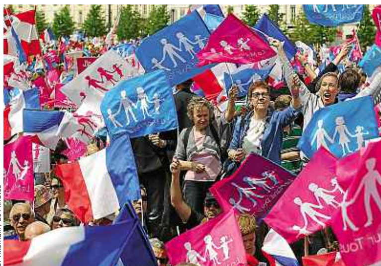
C. Vittebain / 20 Minutes

Dimanche, trois cortèges convergeront vers le centre de la capitale.