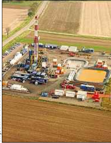
Ecogi/Electricité de Strasbourg

► La géothermie à Rittershoffen. Une centrale géothermique est en construction à Rittershoffen. En 2015, elle alimentera en chaleur l'usine Roquette de Beinheim, qui produit de l'amidon. Les eaux chaudes puisées à 2500 m de profondeur permettront d'économiser 16 000 tonnes équivalent pétrole d'énergie fossile par an. L'investissement de 45 millions d'euros est réalisé par l'entreprise Écogi, qui rassemble Electricité de Strasbourg, le groupe Roquette et la Caisse des