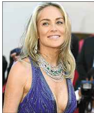
Sharon Stone avec des bijoux Grisogono et Audrey Tautou en robe Yiqing Yin.