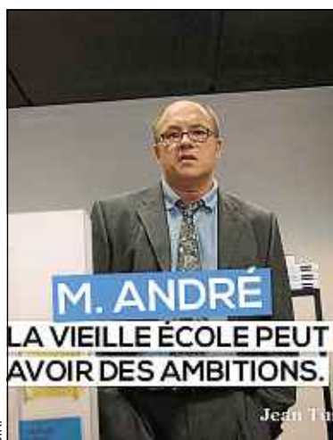
Les acteurs sont tous alsaciens.