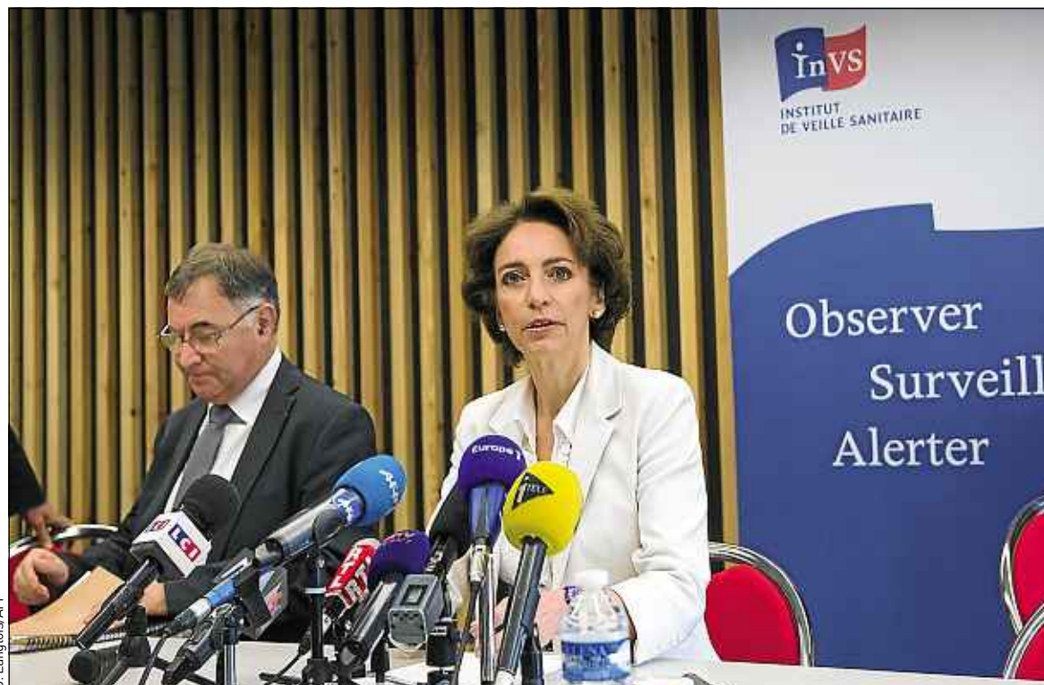
Marisol Touraine a donné dimanche une conférence de presse, accompagnée de spécialistes de la santé.

Nous mettons en place une politique de vigilance, d'information et de précaution. Elle se traduit notamment par trois enquêtes épidémiologiques menées par l'Institut de veille sanitaire. La première porte sur 124 personnes, qui ont été en contact avec le premier malade, la seconde sur 39 personnes, qui ont voyagé avec lui aux Emirats arabes unis et la