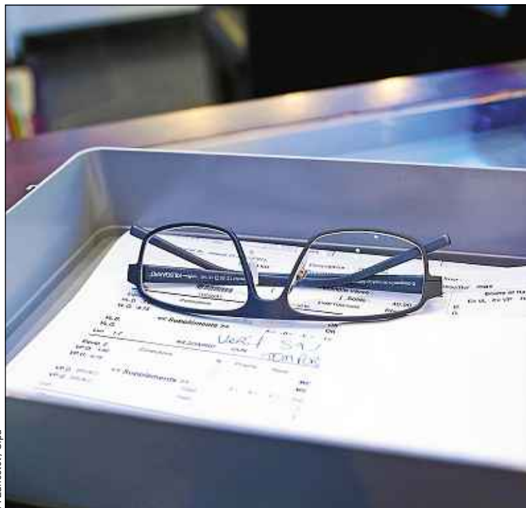
F. Lancelot / Sipa

Dans notre réseau nous observons des marges brutes comptables d'environ 60 % et des marges nettes d'environ 6,7 %. Les chiffres de l'UFC ne sont pas calculés sur la même base, mais pas très différents. Son analyse est biaisée quand elle dit que c'est trop. Ces taux sont comparables à ceux d'autres commerces d'équipement de la personne