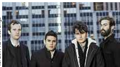
A.J. Bek / XL Recordings

Vampire Weekend clôt sa trilogie à Los Angeles P.10