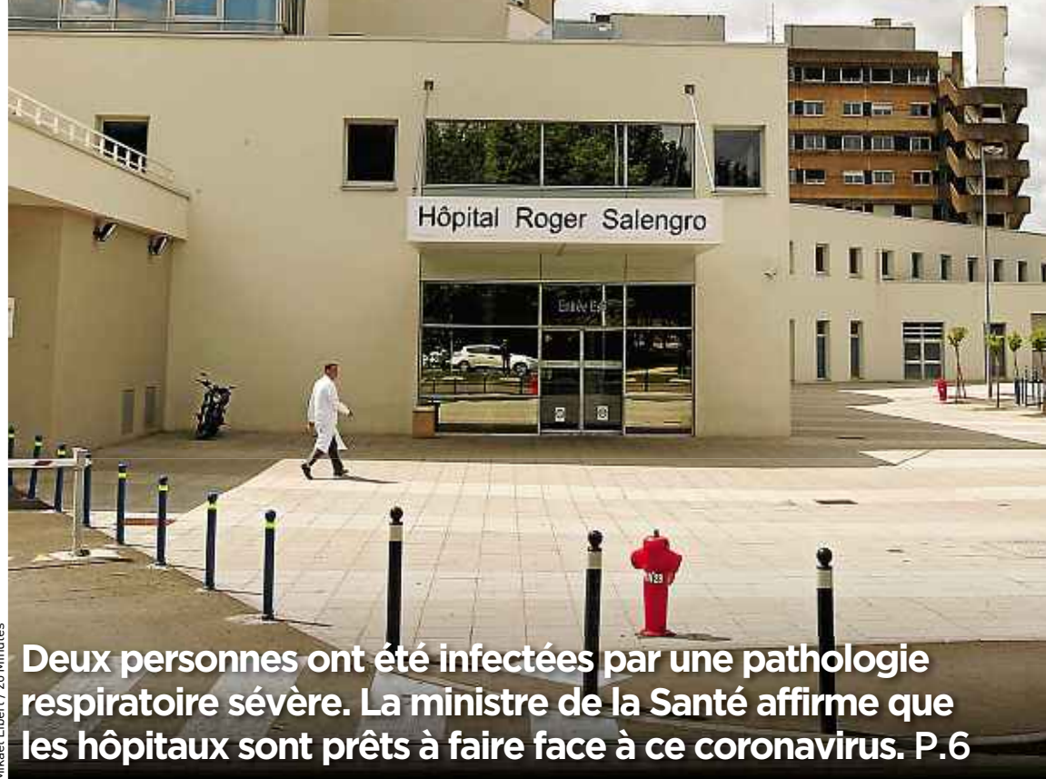
Mikaël Libert / 20 Minutes

Deux personnes ont été infectées par une pathologie respiratoire sévère. La ministre de la Santé affirme que les hôpitaux sont prêts à faire face à ce coronavirus. P.6