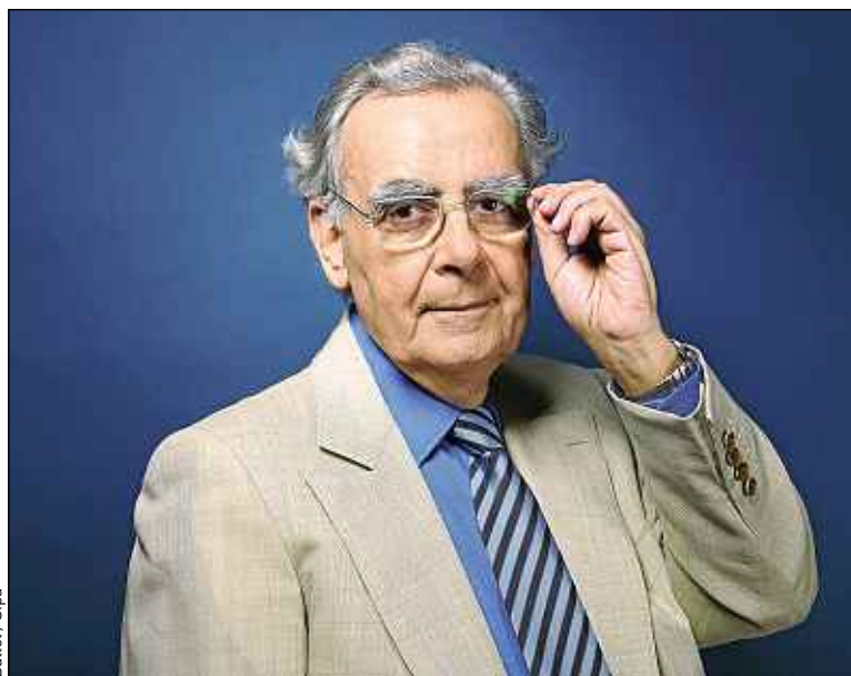
Bernard Pivot twitte en moyenne neuf fois par jour, et surtout le matin.

► Il n'est pas très hashtag dans l'âme. A part #FF (les « Follow Friday » envoyés traditionnellement le vendredi pour inciter à suivre un compte), Bernard n'aime pas les mots-clés (ou mots dièse, ou hashtags). Son twitter en compte moins de 0,01 %. « Je trouve que ça complique la lecture dans les tweets donc je n'en mets effectivement jamais ou presque. En revanche, j'en ai mis dans mon livre, comme titre de chapitres. »