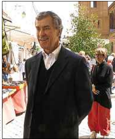
Jérôme Cahuzac était samedi sur le marché de Villeneuve-sur-Lot.

« Le point commun de Guaino, Cahuzac, Guéant : la suffisance, l'impudence et le bras d'honneur aux institutions », vitupère sur Twitter la socialiste Marie-Pierre de La Gontrie. Les hommes po-