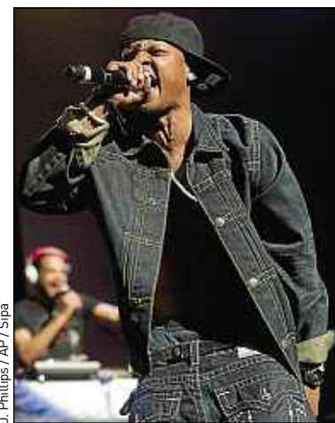
Chris Kelly en février à Atlanta.

Les deux compères avaient été découverts à peine un an plus tôt, en 1991, par le célèbre producteur Jermaine Dupri, alors qu'ils chantaient dans un centre commercial d'Atlanta. Cependant, Kriss Kross n'ira pas plus loin que trois albums – le dernier en 1996 – le succès déclinant dès le deuxième. Le