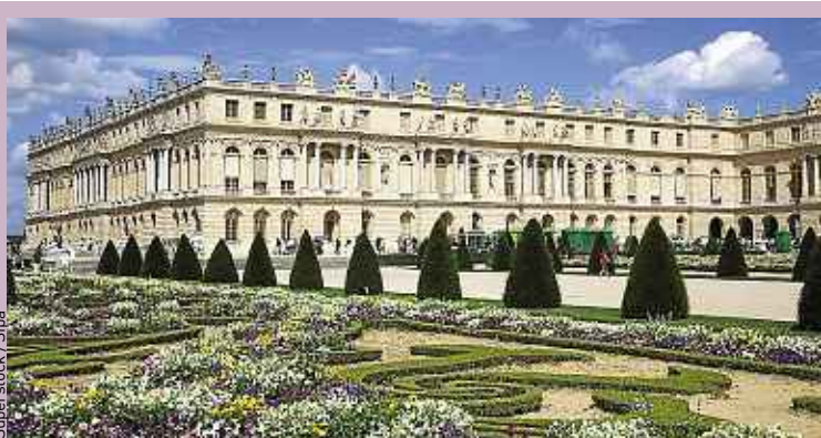
Un parterre du parc du château de Versailles, dessiné par Le Nôtre.

L'émission qui revient sur les faits insolites du jour.