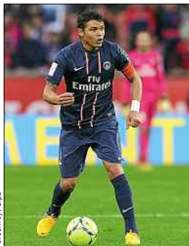
Thiago Silva, maître de la défense.

Avec neuf points d'avance sur l'OM à quatre journées de la fin, les Parisiens pourraient célébrer le titre de champion contre Valenciennes. Pour éviter les calculs, Paris doit obtenir un meilleur résultat que Marseille, qui reçoit Bastia la veille. En revanche, s'il ne fait pas mieux que l'OM, Paris ne serait pas mathématiquement sacré. Mais officieusement oui, puisque le PSG possède une différence de but largement supérieure à celle de l'OM (+ 41 contre + 6).