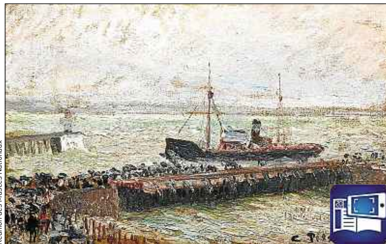
Bateau, entrée port du Havre, de Camille Pissarro, 1903.

« Eblouissants reflets, 100 chefs-d'œuvre impressionnistes », à Rouen, rassemble les plus grands peintres (Monet, Pissarro, Caillebotte, Renoir...) autour du motif du plan d'eau. « Un été au bord de l'eau, loisirs et impressionnisme », à Caen, témoigne de l'essor des loisirs aquatiques au XIX e siècle. On découvrirait alors les joies des bains de mer, du canotage, des régates... « Pissarro dans les ports », au Havre, présente un Pissarro à l'inspiration résolument urbaine. Enfin, une expo