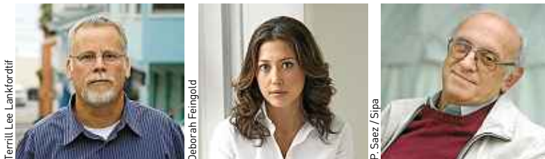
Michael Connelly, Cristina Alger et Petros Markaris (de g. à dr.).