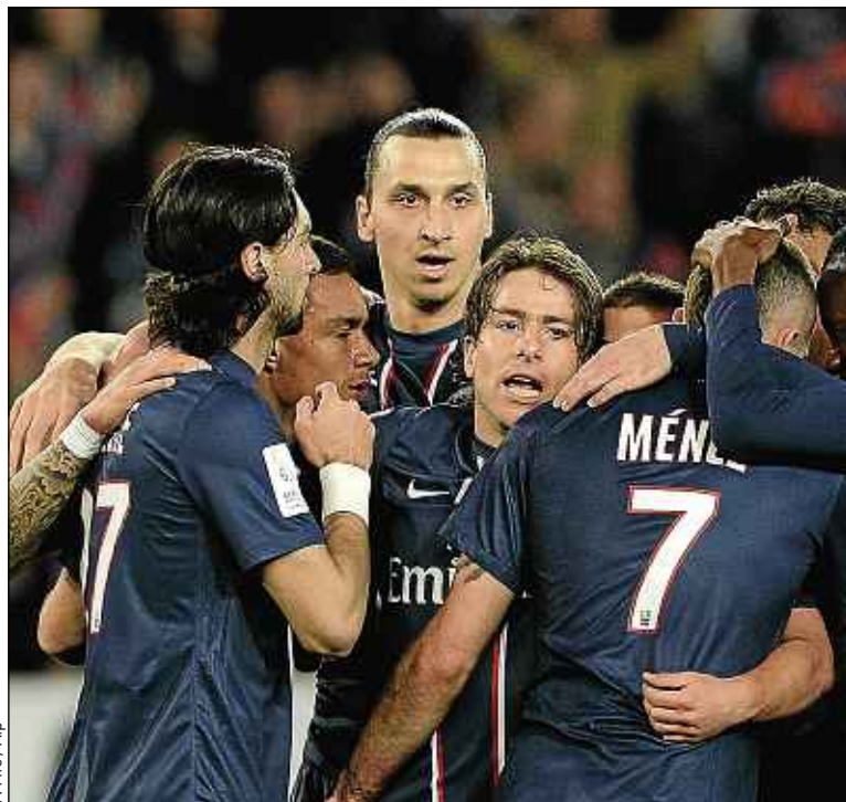
En cas de titre, les Parisiens renoueraient avec un passé glorieux.