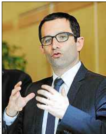
Le ministre de la Consommation lors de la présentation du projet de loi.

Dans la majorité des cas, le remboursement pourra intervenir dans l'année