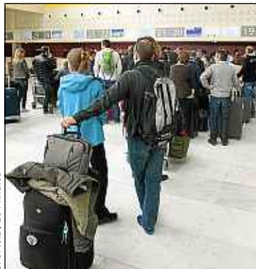
S. Ortiola / 20 Minutes

P lus besoin d'arriver en avance à l'aéroport ni de faire la queue pendant des heures pour enregistrer vos bagages... Un service se charge désormais de cette tâche et dépose vos bagages dans le lieu de votre choix. Ce service, c'est Liberty-bag. Après réservation, par téléphone ou Internet, et paiement par carte bancaire, un employé vient à domicile peser votre bagage et l'envoyer vers la destination de votre choix.