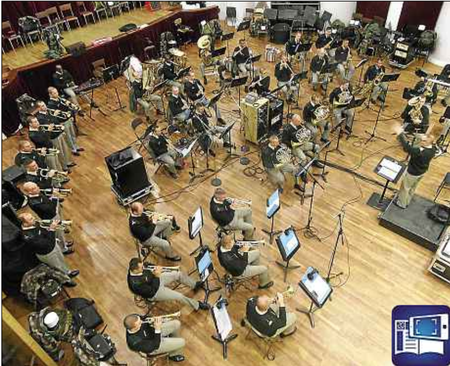
DR Les membres de « La Musique » en séance d'enregistrement.

En journal augmenté, découvrez la chanson « Le Boudin ».