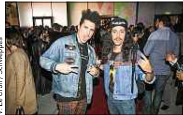
V. Le Cron / Schweppes