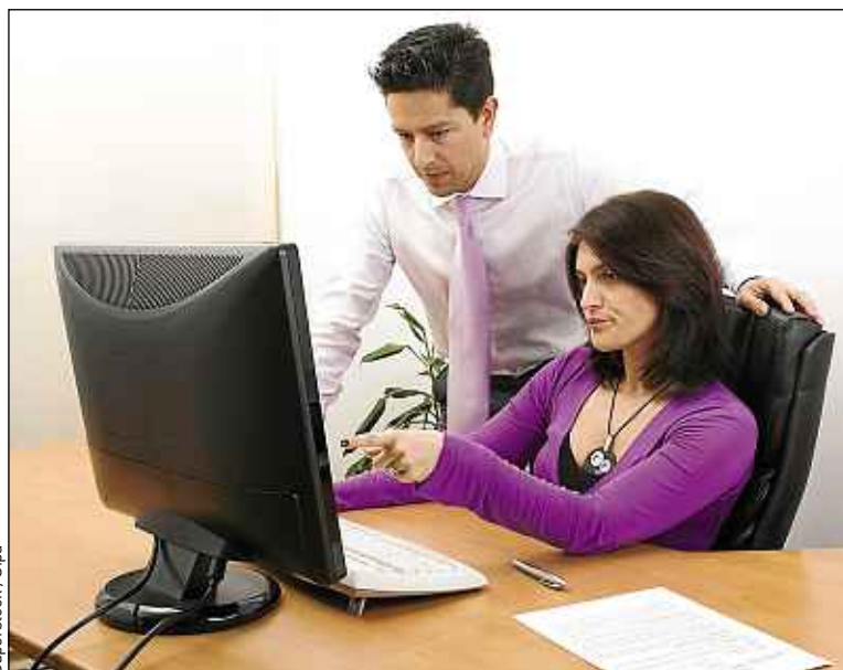
L'égalité de rémunération est inscrite dans le Code du travail.

En effet, si les sanctions prévues dans la loi de 2010 n'ont jamais été appliquées et sont restées au stade de menaces, elles viennent de devenir bien réelles. Najat Vallaud-Belkacem, ministre des