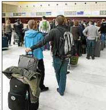
L'enregistrement peut être long.

P lus besoin d'arriver en avance à l'aéroport ni de faire la queue pendant des heures pour enregistrer vos bagages... Un service se charge désormais de cette tâche et dépose vos bagages dans le lieu de votre choix. Ce service, c'est Liberty-bag. Après réservation, par téléphone ou Internet, et paiement par carte bancaire, un employé vient à domicile peser votre bagage et l'envoyer vers la destination de votre choix.