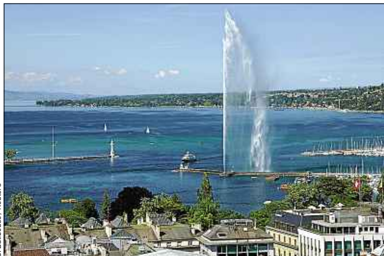
Le célèbre jet d'eau du lac Léman, depuis la cathédrale Saint-Pierre.

On y trouve aussi un petit zoo, de superbes volières et des serres. C'est au nord, et plus précisément autour de la place des Nations que sont installés la plupart des sièges des organismes in-