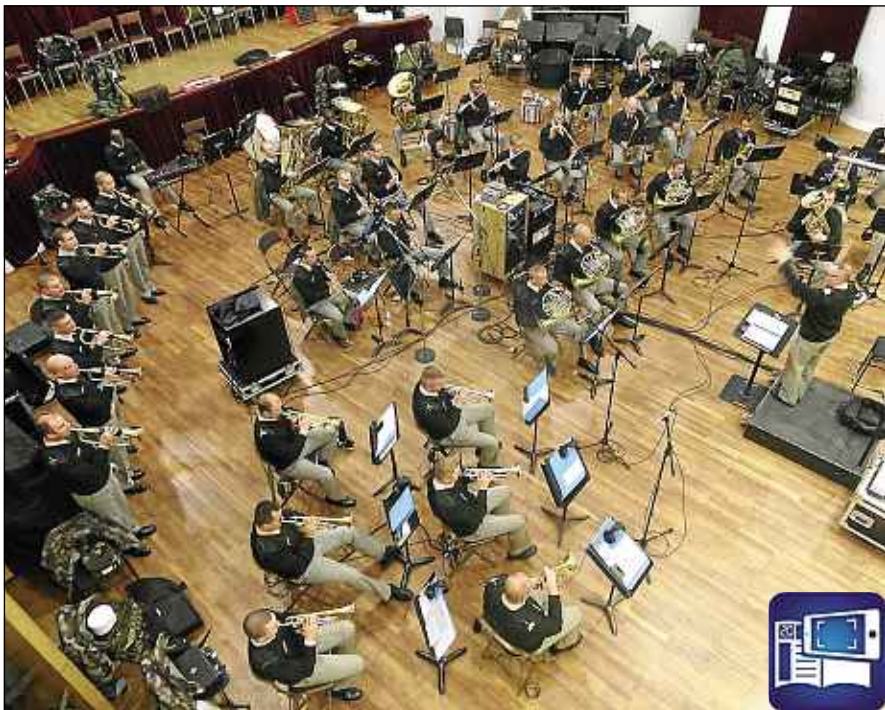
DR Les membres de « La Musique » en séance d'enregistrement.

En journal augmenté, découvrez la chanson « Le Boudin ».