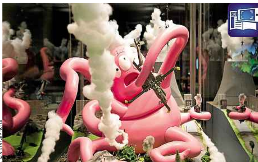
Le Barbapatomic peut facilement décimer une armée de petits soldats.