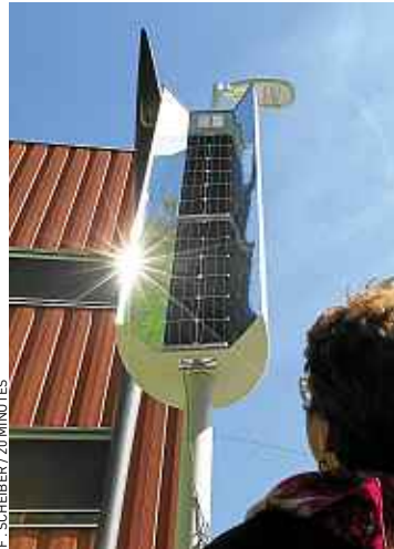
Le lampadaire bouge avec le soleil.