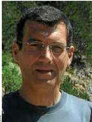
Xavier Dupont de Ligonnès a disparu peu après les meurtres.