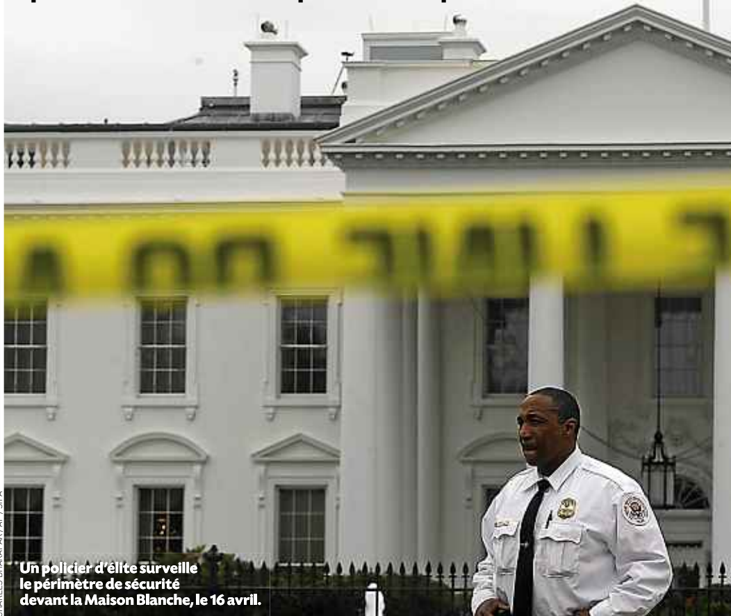
Un policier d'élite surveille le périmètre de sécurité devant la Maison Blanche, le 16 avril.

Deux jours après l'attentat de Boston, la Maison Blanche a reçu une lettre contenant de la ricine, une substance mortelle. Ce scénario rappelle les courriers à l'anthrax qui avaient suivi les attaques du 11 septembre 2001. P.10