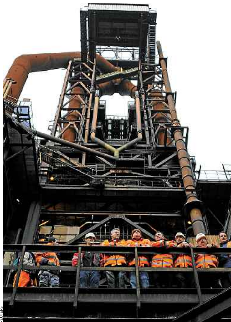
L'industrie (ci-dessus : ArcelorMittal) devrait continuer à détruire des emplois.

Alors que la France a perdu près de 100 000 emplois en 2012, l'OFCE prévoit la destruction de 150 000 nouveaux postes cette année et de 110 000 autres en 2014. Le taux de chômage atteindrait alors 11,6 %, contre 10,8 % aujourd'hui. L'OFCE s'inquiète aussi des rémunérations des Français. Echapperont-elles à la baisse, alors que les salaires des Espagnols, des Portugais ou encore des Hollandais ont déjà diminué ? L'accord sur l'emploi, actuellement examiné au Parlement, permettra à ce propos aux entreprises en grave difficulté de baisser