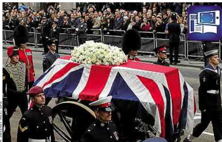
Des milliers de personnes se sont massées sur le parcours du cortège.

Des milliers de personnes s'étaient massées sur le parcours du cortège. Seuls les sifflets d'opposants sont venus rappeler la personnalité controversée de « la Dame de fer ». Certains entonnaient Ding, Dong, la sorcière est morte , chanson du film Le Magicien d'Oz . D'autres se sont détournés ou ont sifflé au passage du cercueil. « La Dame de fer », disparue le 8 avril à l'âge de 87 ans, a toujours divisé les Britanniques. ■