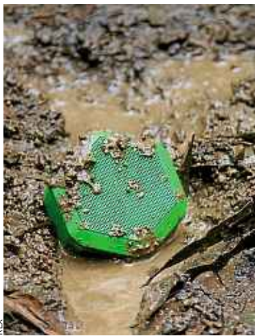
Boombot REX ne craint pas la boue.