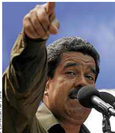
Nicolas Maduro est le dauphin désigné d'Hugo Chavez.

Pour Nicolas Maduro, l'enjeu est de taille : il s'agit d'asseoir sa légitimité. Désigné par Hugo Chavez comme son dauphin, il n'a en effet jamais eu de mandat électoral. Il a toutefois engrangé les bénéfices de l'émotion suscitée dans le pays par la mort de son mentor. Le scrutin est aussi un test pour l'opposition. Son candidat, Henrique Capriles, avait remporté 6,5 millions de suffrages à l'élection présidentielle d'octobre 2012, contre 8,2 millions pour Hugo Chavez. Fera-t-elle aussi bien, sinon mieux, cette fois-ci ?