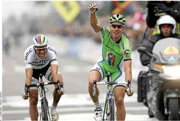
Peter Sagan, vainqueur de la Flèche Brabançonne devant Philippe Gilbert.

En course, où il a accroché à son palmarès Gand-Wevelgem et la Flèche Brabançonne, mais aussi sur les podiums. Deuxième il y a deux semaines du Tour des Flandres, le Slovaque avait choqué et/ou fait sourire en mettant une main aux fesses d'une hôtesse. Impressionnant ou écœurant, le coureur ne laisse pas le peloton indifférent. « J'ai