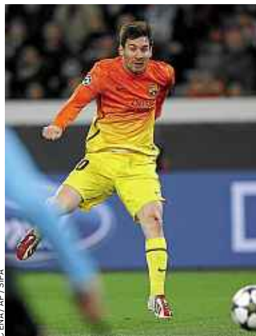
Messi, buteur à l'aller contre Paris.