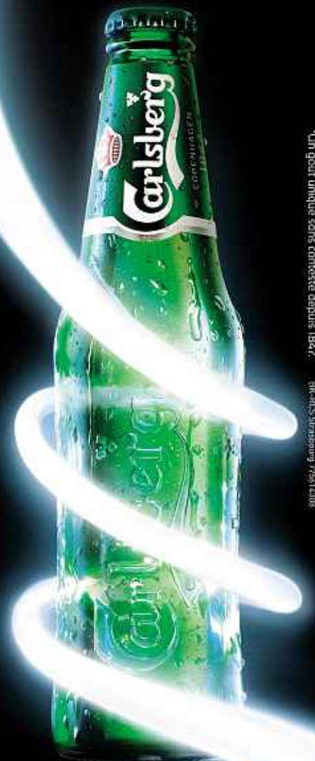
Un goût unique sans conteste depuis 1871. © Carlsberg Breweries 2012

L'ABUS D'ALCOOL EST DANGEREUX POUR LA SANTÉ. À CONSOMMER AVEC MODÉRATION.