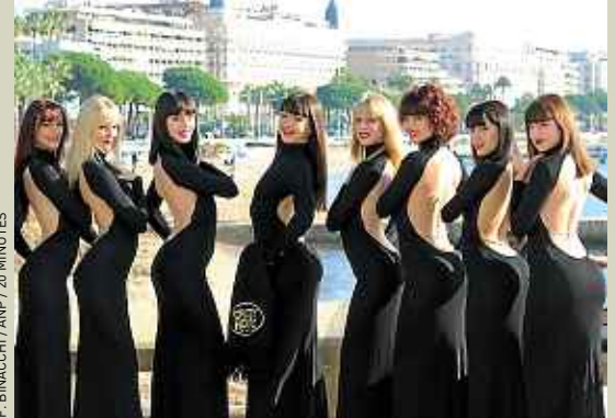
Le cabaret parisien s'était déjà délocalisé à Cannes pour quatre dates, à la fin 2011 (archives).