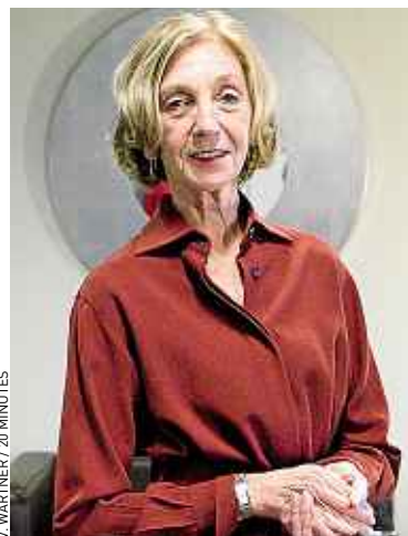
Nicole Bricq veut développer la part de marché française au Vietnam.

Notre part de marché est de 1 % au Vietnam, contre 1,5 % en moyenne dans l'ensemble des pays du Sud-Est asiatique. Ce n'est pas normal. Le Vietnam