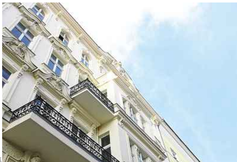
Le prix moyen de 2600 €/m 2 permet de bons investissements locatifs.