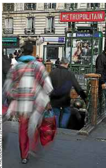
Choisir son métro mérite réflexion.