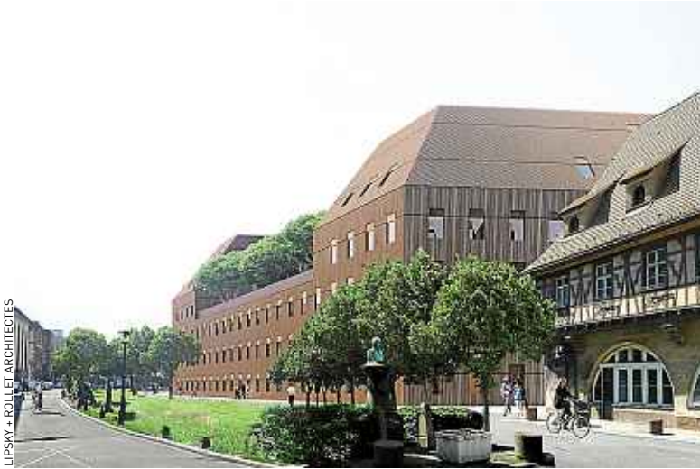
Le bâtiment accueillera 2 200 étudiants à la rentrée 2015.

cabinet d'architectes Lipsky + Rollet sera construit sur le site de l'ancienne clinique médicale A. « Nous avons pour le moment 4 500 m 2 que nous partageons avec l'IPAG, et nous allons plus que doubler notre surface, se réjouit Sylvain Schirmann, le directeur de l'IEP. Cela va nous permettre d'augmenter et