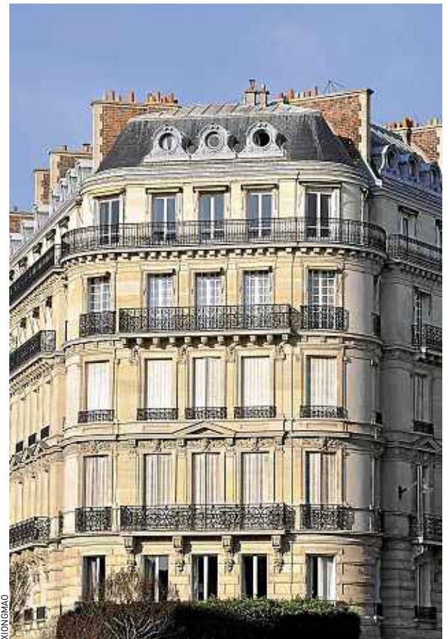
Une SCI se crée très facilement devant le greffe du tribunal.

Alors que l'accession à la propriété devient de plus en plus difficile pour les jeunes générations, certains parents aident leurs enfants en achetant avec eux leur résidence principale en SCI. L'enfant devient gérant de la SCI afin d'en faciliter la gestion courante et, plus tard, la transmission du bien. Autre astuce pour investir, des particuliers s'associent en SCI pour acquérir un logement, que l'un d'eux louera à la société, ou afin de partager une résidence secondaire. ■