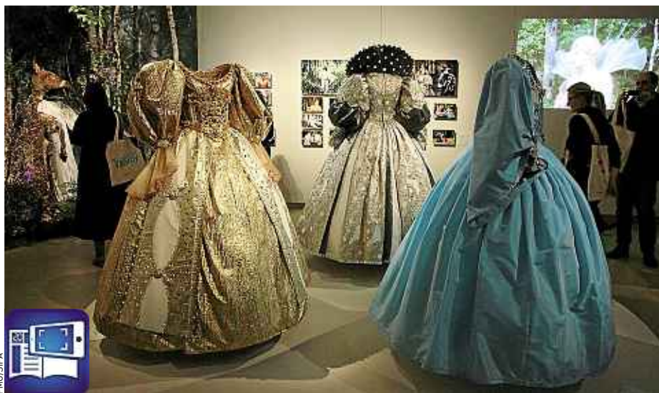
Les trois robes de Catherine Deneuve dans Peau d'âne , et, au fond, la peau d'âne.

Un soin particulier a été apporté aux ambiances musicales, à la mise en valeur des photos d'Agnès Varda, des gouaches de Bernard Evein, des costumes et des papiers peints multicolores. Mais le clou de l'exposition, qui va ravir les enfants, c'est l'espace