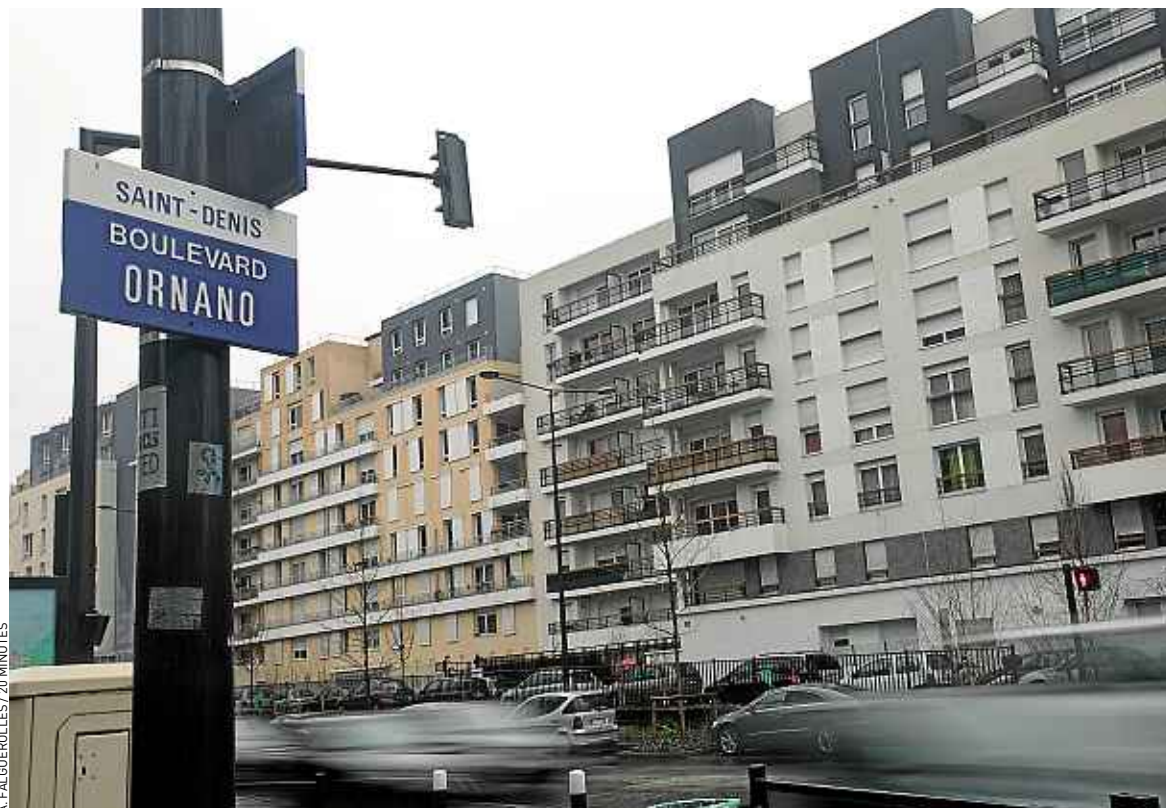
La Seine-Saint-Denis se développe grâce aux nouveaux aménagements, et les prix commencent déjà à grimper.