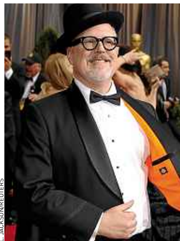
William Joyce aux Oscars en février.

J'aimerais bien. Je continue à écrire maintenant que j'ai terminé Epic (sortie le 22 mai) sur lequel j'ai travaillé avec Chris Wedge. Je viens de voir le film et j'en suis très fier. ■ RECUEILLI PAR C. V. DreamWorks, DVD 20 €, Blu-Ray, 25 €.