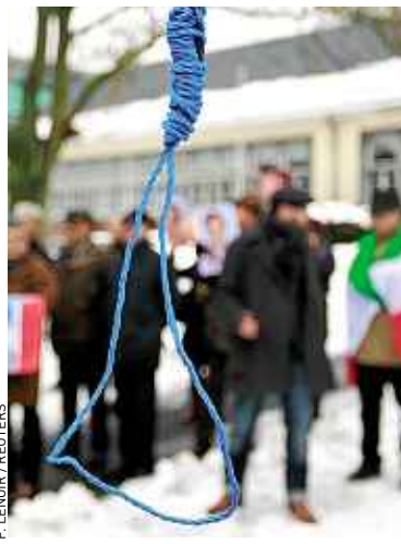
Des Iraniens manifestent contre la peine de mort à Bruxelles, en 2010.

d'exécutions qu'en 2011 (43) qui ont eu lieu dans neuf Etats en 2012, contre 13 en 2011. En avril 2012, le Connecticut est devenu le 17 e Etat abolitionniste. Le nombre de pays ayant supprimé la peine de mort est d'ailleurs en augmentation : avec la Lettonie, il est passé à 97 en 2012, contre 80 en 2003. « Au total, 140 pays ont aboli la peine capitale en droit ou en pratique », note Amnesty. ■ F.V.