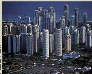
D. BEBBER / SIPA