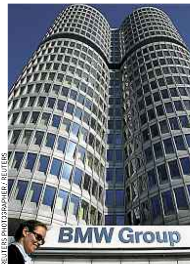
Le siège de l'allemand BMW.

Volkswagen), trois américaines (Apple, Google, Microsoft), et seulement deux françaises (Danone et La Poste) et une franco-allemande (Airbus). A noter que le plan social initié par PSA a dû jouer sur son image, puisque c'est la seule entreprise qui voit son indice de sincérité baisser de manière significative. ■ C.B.