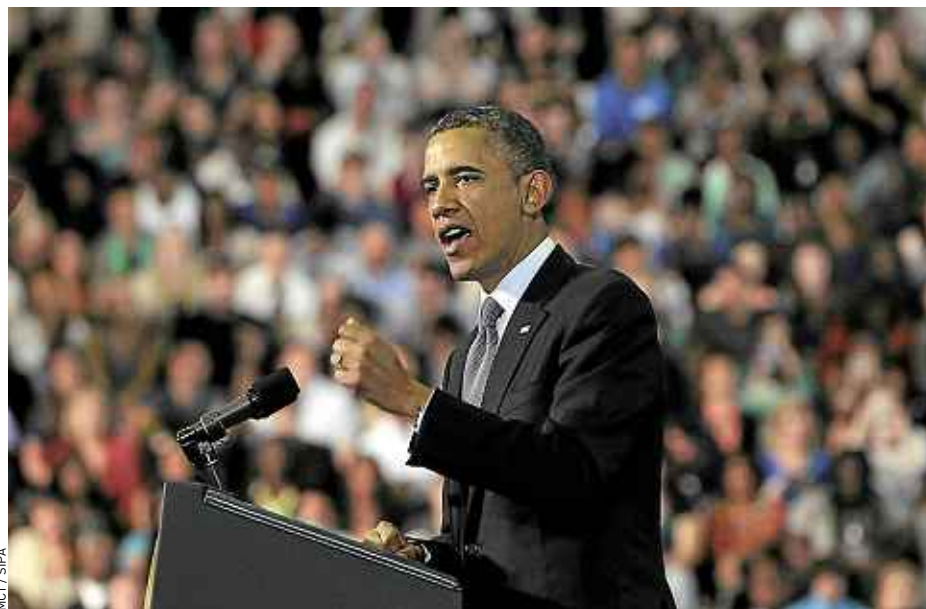
Le président des Etats-Unis est allé défendre son projet dans le Connecticut, lundi.