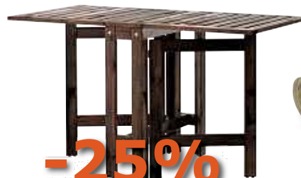
8 Sur toutes les tables de la gamme ÄPPLARÖ