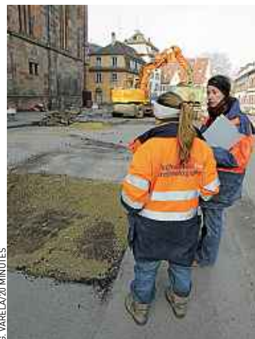
T.C. Trois fosses ont été creusées.

cimetière, poursuit-il, nous avons trouvé des traces de la ville carolingienne, ce qui montre que la zone d'habitation a été abandonnée et transformée en zone funéraire, et encore en dessous, aux alentours de 2 m de profondeur, des vestiges de la ville romaine. » La deuxième phase de fouilles va concerner trois fosses dans lesquelles doivent être plantés les arbres d'ornement de la place réaménagée. Les archéologues présumant qu'ils y trouveront de nouveaux vestiges funéraires. ■