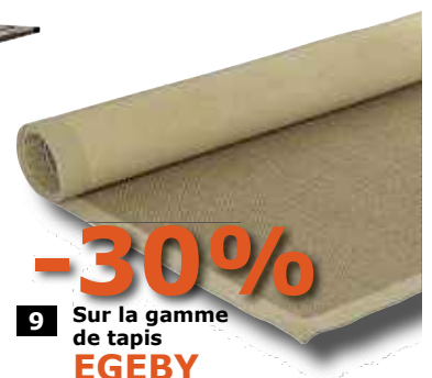
9 Sur la gamme de tapis EGEBY

1 Toute la gamme KIVIK : canapés, fauteuils, convertibles et méridiennes. 2 Cadre de lit + rangement MANDAL 160x200 : inclus : un support médian et un sommier à lattes. Matelas et literie non inclus. bouleau massif, vernis acrylique incolore. MANDAL 140x200cm : prix non membre 299€ - prix membre IKEA Strasbourg 229€ 3 Armoire métallique IKEA PS rouge ou blanc : L119xP40H63cm, serrure et 2 clefs inclus. Acier, peinture epoxy 4 Chaise pivotante MALKOLM : L52xP65xHmax123cm. Hauteur réglable, soutien lombaire intégré. Acier, 25% coton, 75% polyester, 100% polyuréthane. 5 Service ARV 28 pièces blanc : 6 assiettes 28cm, 6 assiettes creuses 26cm et 6 assiettes à dessert 22cm. Faïence. 6 Housse de couette SPRINGKORN + 2 taies : 220x240cm, divers coloris. 52% polyester, 48% coton 7 Table enfant MAMMUT verte, rose ou bleue : Plastique, un matériau résistant et facile à entretenir. 8 Tables de la gamme ÄPPLARÖ : acacia massif, lasure acrylique. 9 Toute la gamme de tapis EGBY : plusieurs tailles : 133x195cm, 165x230cm, 200x300cm, 80x140cm et 80x250cm. 100% sisal, latex.