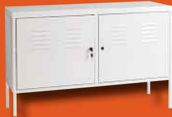
3 Armoire métal. IKEA PS Prix non membre 79€ Prix membre IKEA Strasbourg 59€