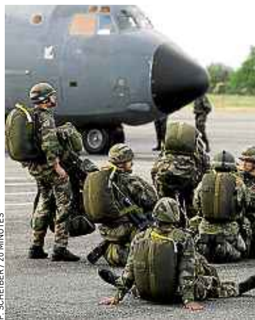
Les militaires sont préparés au retour à la vie civile.

Puéricultrice, conducteur, plombier, archéologue ou médecin : les besoins du secteur sont importants et variés avec 80 000 recrutements prévus en 2013 dans 500 métiers. Si 20 % des embauches sont contractuelles (CDD, CDI), « le concours reste la voie privilégiée de recrutement, comme la loi l'impose pour un poste permanent mais aussi parce qu'elle est la plus démocratique », explique le directeur général de la fonction publique.