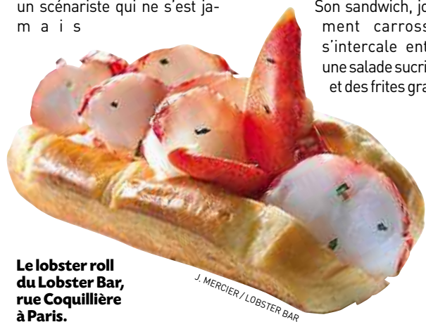
Le lobster roll du Lobster Bar, rue Coquillière à Paris.