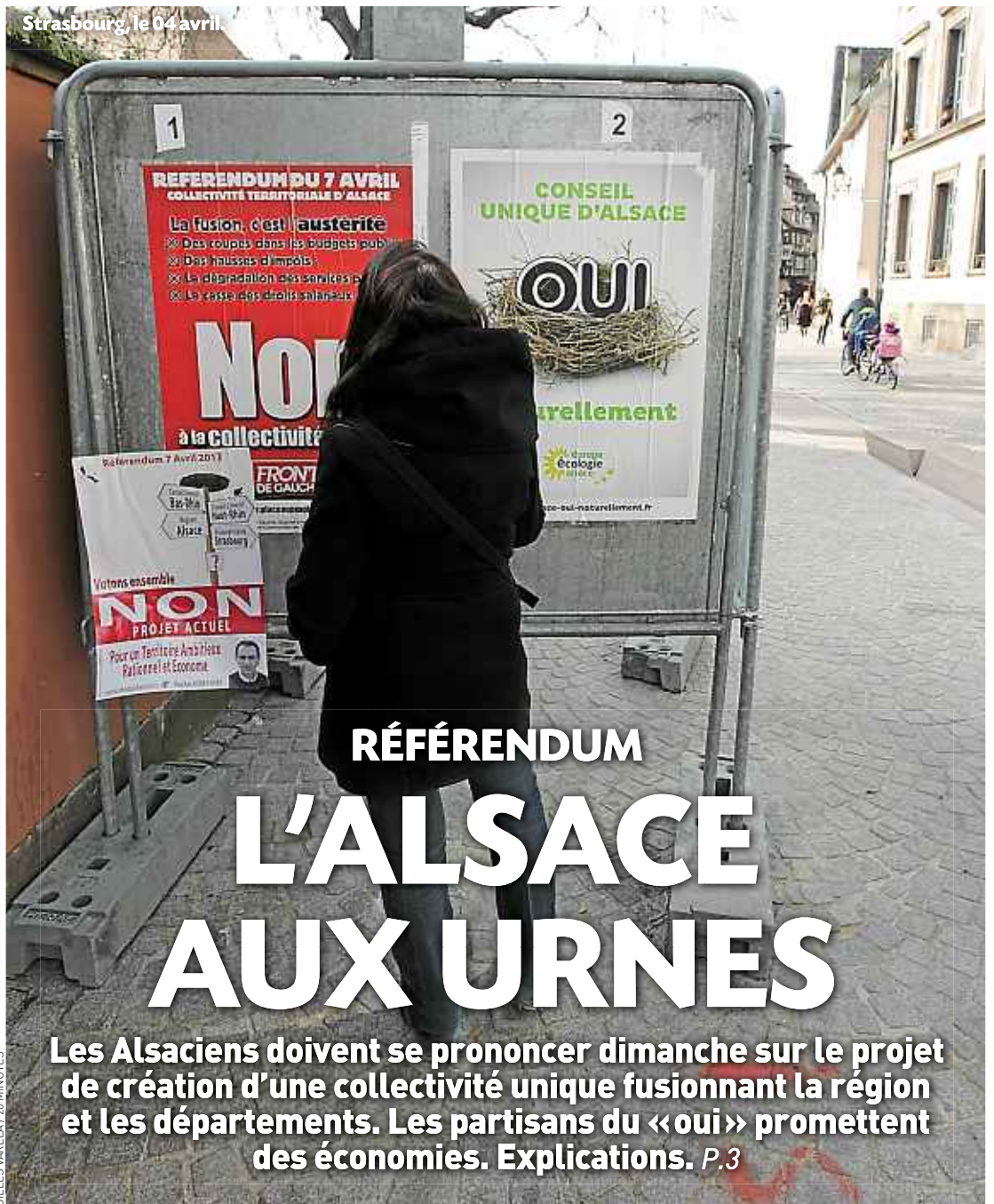
Strasbourg, le 04 avril.