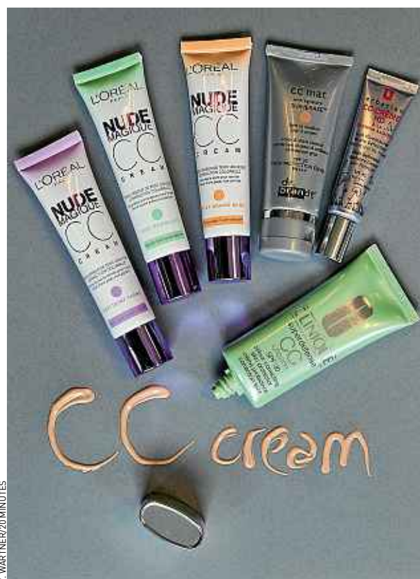
Les CC Cream sont des BB Cream améliorées.

La pionnière : CC Crème HD, Erborian, 15 €, en exclu chez Sephora. Notre héroïne : CC Cream, Clinique, 29 €. Pour les peaux mixtes à grasses, CC Mat, Dr Brandt, 39 €, disponible en juin en exclu chez Sephora. Pour les peaux sujettes aux rougeurs : Nude Magique CC Cream, L'Oréal, 14,50 €.