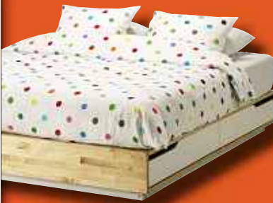
2 Cadre de lit + rangement MANDAL 160x200cm Prix non membre 339€ Prix membre IKEA Strasbourg 229€