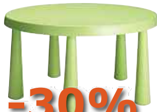
7 Sur les tables enfants MAMMUT vertes, roses ou bleues