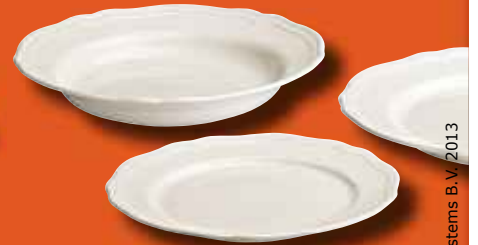
5 Service 18 pièces ARV Prix non membre 39,95€ Prix membre IKEA Strasbourg 29,95€