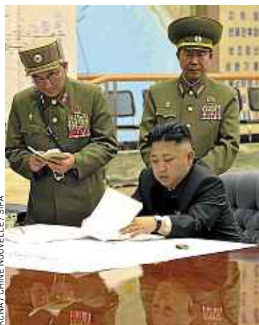
Kim Jong-un a autorisé une attaque.

Les autorités militaires de Corée du Nord estiment que la responsabilité de la crise se déroulant actuellement « incombe entièrement » aux Etats-Unis. Ils évoquent notamment la participation de B-52 capables de transporter des