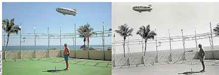
Florida 1967. Meyerowitz hésitait encore entre couleur et noir et blanc.