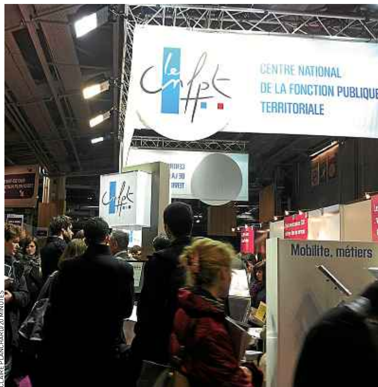
Le Salon de l'emploi public a attiré une affluence record jeudi à Paris.