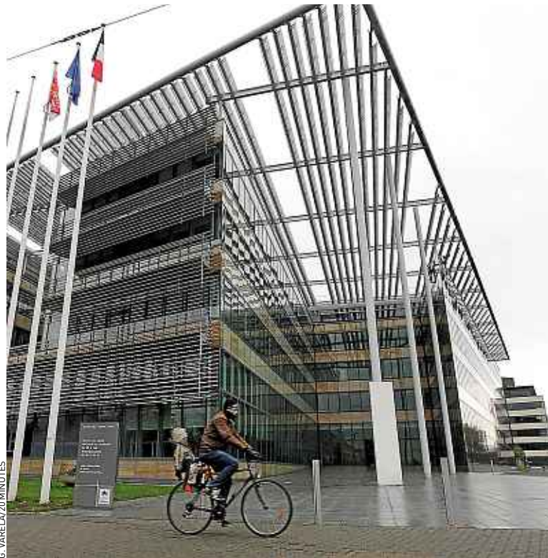
Le siège du conseil régional d'Alsace, au Wacken, à Strasbourg.