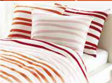
6 Housse de couette 2 pers. SPRINGKORN + 2 taies Prix non membre 19,95€ Prix membre IKEA Strasbourg 12€