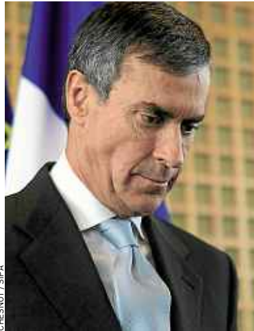
L'affaire Cahuzac écœure à la fois les contribuables et les fonctionnaires.

« Depuis deux jours, nos collègues, en contact direct avec le public, notamment aux services du recouvrement et du redressement, sont pris à partie », témoigne-t-il. « Des remarques qui pèsent. Nos collègues ont un devoir de