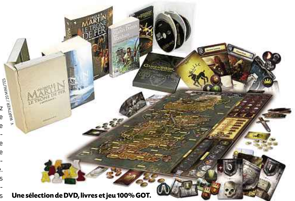
Une sélection de DVD, livres et jeu 100% GOT.

vos amis et attendre fébrilement la suite du roman, que George R. R. Martin retarde encore et encore.