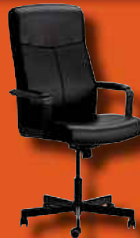
4 Chaise pivotante MALKOLM Prix non membre 99,90€ Prix membre IKEA Strasbourg 79€