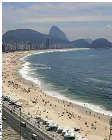
La plage de Copacabana, à Rio.

Des minibus de ce genre, il en circule 6 000 officiels dans la métropole brésilienne et autant d'illégaux. « Il faut éviter de prendre ces bus seul, la nuit. Surtout