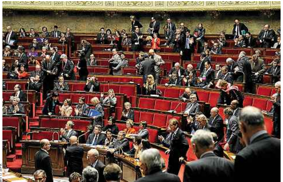
Le texte est critiqué par le Front de gauche, Europe Ecologie-Les Verts et le Parti communiste.

Plusieurs points promettent de belles prises de bec. Celui des accords de maintien dans l'emploi est brûlant. Les entreprises confrontées à de « graves difficultés conjoncturelles » pourront négocier, comme viennent de le faire Renault et PSA, des baisses du temps de travail et des salaires, pendant deux ans, en échange d'un maintien des effectifs, sous réserve de l'accord des syndicats représentant une majorité des salariés. « Et après ? Dans l'accord, il n'est pas dit que, si la crise passe, les conditions antérieures seront rétablies », a lancé Jean-Luc Mélenchon, le coprésident du Front de gauche, mardi sur BFMTV. Pour éviter un plan social, les