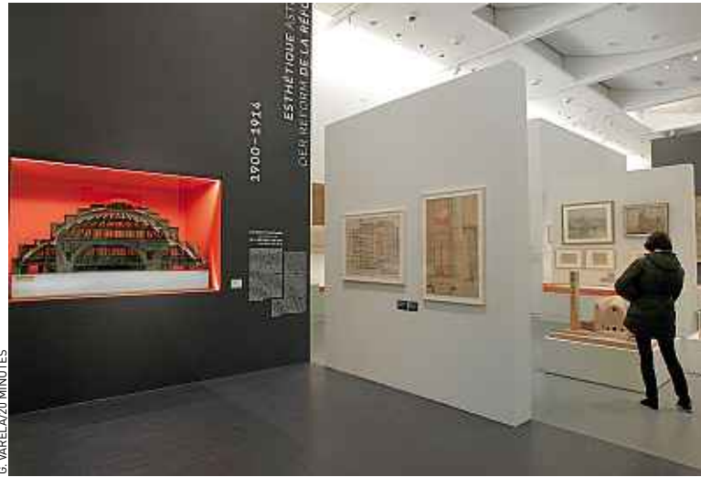
Plus de 400 objets sont exposés au Musée d'art moderne et contemporain.

► Une part d'histoire. C'est l'occasion de comprendre pourquoi, par exemple, Goethe a publié De l'architecture allemande en référence aux bâtiments strasbourgeois. Et parce que les rela-