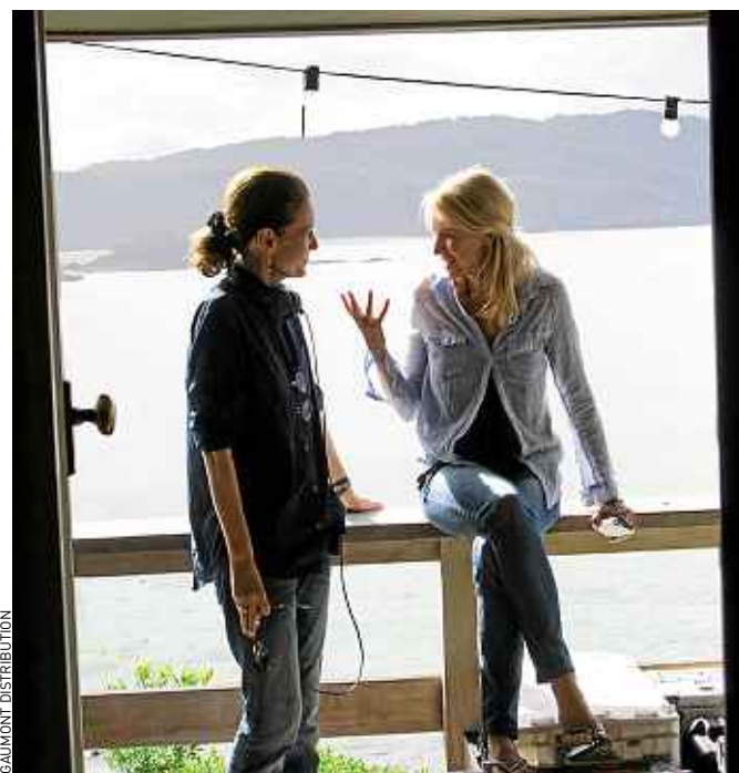
La Française Anne Fontaine (à g.) dirige Naomi Watts.

La comédienne est cependant consciente que le sujet peut choquer. « En France, vous êtes plus ouverts d'esprit, mais aux Etats-Unis, ce genre de relations est mal accepté. J'estime pourtant que ce film n'a rien de graveleux. Il s'agit surtout d'une réflexion sur la peur de vieillir et l'amitié féminine. » A 44 ans, la comédienne qui a tourné avec Peter Jackson ( King Kong , 2005) et Michael Haneke ( Funny Games US ) avant d'être citée à l'Oscar cette année pour The Impossible a envie de prendre des risques. Elle incarnera la prin-