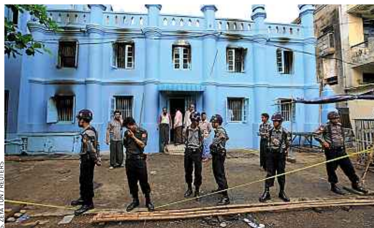
D. B. Treize jeunes garçons ont trouvé la mort dans ce dortoir, mardi.

en Birmanie. Celles-ci ont provoqué la mort de 43 personnes depuis le 20 mars à Meiktila et elles se sont propagées à une quinzaine de villes et de villages. Des habitants et des témoins rapportent que les portes du dortoir qui a pris feu à Rangoun avaient été verrouillées. « Il semble que les garçons n'aient eu aucune chance de sortir parce que les portes étaient fermées à cause de la situation instable », estime un habitant. ■