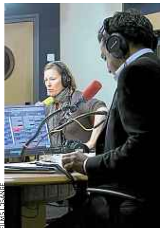
Dans la Maison ronde.