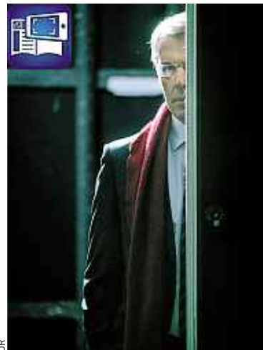
Wilson dans un thriller politique.