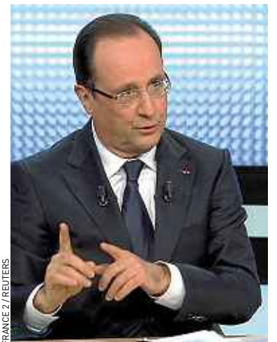
François Hollande a promis un « choc de simplification », jeudi.

Comment en est-on arrivé là ? « Dans notre pays, il y a une dictature de la bonne conscience, qui amène à légiférer plutôt qu'à résoudre le problème. C'est une question culturelle à résoudre », résume le libéral Hervé Novelli. ■ M.G.O.