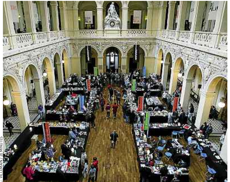
Le festival prend ses aises dans le magnifique Palais du commerce de Lyon.

pliquer l'enquête du policier et de sa jeune coéquipière, Nina. Et réveiller bien des passions. Au fil des pages et à mesure que l'ensoleillement grandit, l'auteur nous plonge dans l'univers méconnu d'un peuple tiraillé entre traditions et modernité. Le lecteur se trouve aussitôt happé par des paysages fascinants et propulsé dans une ambiance lourde de non-dits. Pour un premier essai, Olivier Truc réussit le tour de force de faire un livre lumineux avec des personnages hauts en couleur dans cette région où l'obscurité dure, dure... ■