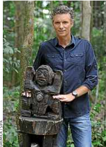
Denis Brogniart, l'animateur.

L'enquête s'ouvre alors que s'opposent deux versions des faits. Selon Adventure Line Production (ALP), la société qui produit l'émission, Gérald Babin a été victime d'une série d'arrêts cardiaques durant son transfert vers l'hôpital, où son décès aurait été constaté. Une version contestée par un témoignage anonyme,