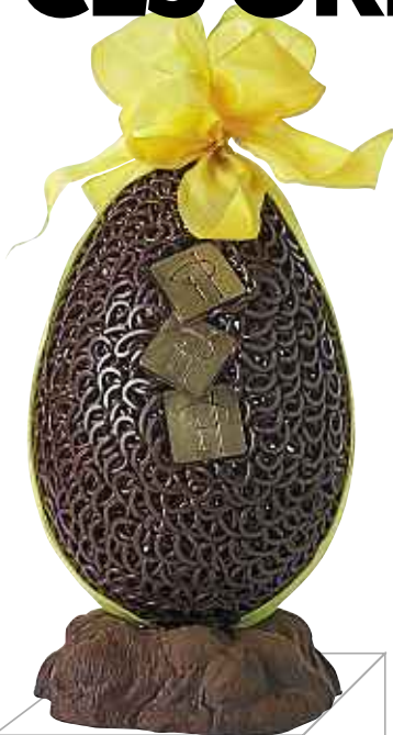
Œuf dentelle noir, Pierre Hermé, 43 €. www.pierreherme.com .

Œuf en chocolat Noir Grand Cru Caraïbes, 66 % de cacao, garni de petits œufs Intense, Infiniment Praliné Noisette, Mathilda, Corso, Sensation et d'œufs croquants Nougatine au chocolat noir et au chocolat au lait fourrés au praliné noisette noir.