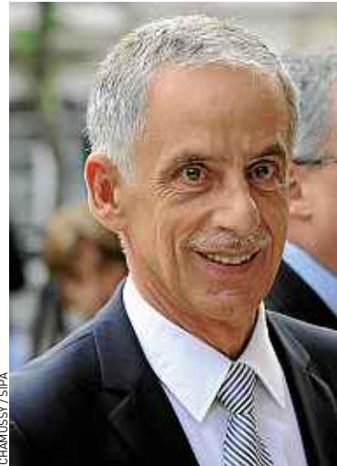
Philippe Louis, président de la CFTC.

Ce vendredi seront divulgués les résultats des élections professionnelles organisées entre 2008 et 2012. Et, avec la réforme de 2008, seuls les syndicats dépassant la barre des 8 % des suffrages exprimés seront désormais considérés comme « représentatifs ». Or, 8 %, c'est peut-être un peu haut pour la CFTC. Qui risque donc de perdre sa place à la table des négociations