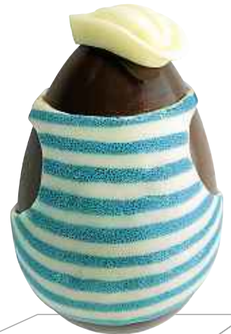
Œuf mayo, Jean-Paul Hévin, 36,90 €. www.jeanpaulhevin.com .

Œuf en chocolat noir Pure origine Pérou, Province de Morropón, Communauté d'Asprobo, 64 % de cacao et décoré de galets aux différents parfums. Garniture de petits œufs.