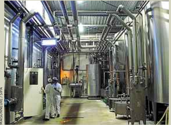
La laiterie Malo (Ille-et-Vilaine) exporte beaucoup.