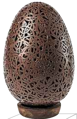
Œuf dentelle noir, Hugo & Victor, 37 €. www.hugovictor.com .

Stiletto en chocolat noir 68 % posé sur des œufs en chocolat.