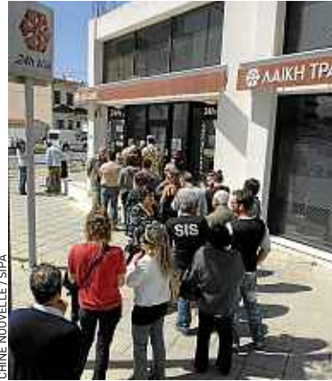
Les Chypriotes ont fait la queue devant les banques, jeudi.

clients attendaient dans le calme devant les succursales de la Bank of Cyprus et de la Cyprus Popular Bank, sous l'œil d'agents de sécurité. D'importants mouvements avaient été effectués récemment via Internet. En moyenne, le montant total des comptes bancaires gérés par des établisse-