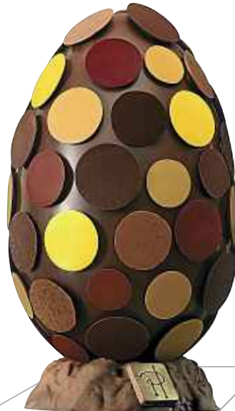
Œuf galets, Pierre Hermé, 89€. www.pierreherme.com .

Œuf en chocolat noir 68 %, garni de fritures et chocolats fourrés de Pâques noir et lait.