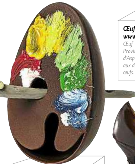
L'Œuf du peintre, Hugo & Victor, simple, 45 €, garni, 58 €. www.hugovictor.com .