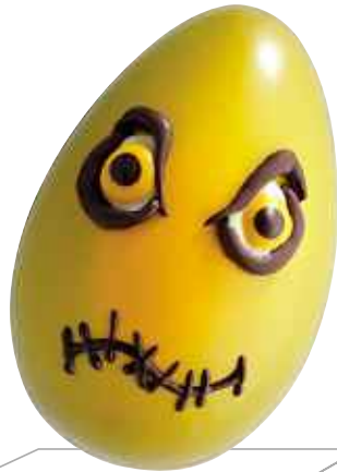
Œuf dur, Jean-Paul Hévin, 24,40 €. www.jeanpaulhevin.com

Œuf en chocolat Noir Grand Cru Caraïbes, 66 % de cacao, garni de petits œufs Intense, Infiniment Praliné Noisette, Mathilda, Corso, Sensation et d'œufs croquants Nougatine au chocolat noir et au chocolat au lait fourrés au praliné noisette noir.