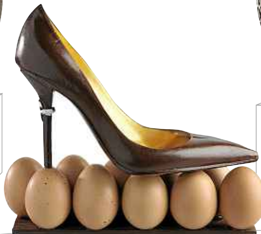
Marcher sur des œufs, Jean-Paul Hévin, 98,80 €. www.jeanpaulhevin.com .

Œuf du Peintre simple ou garni avec friture lait ou noir.