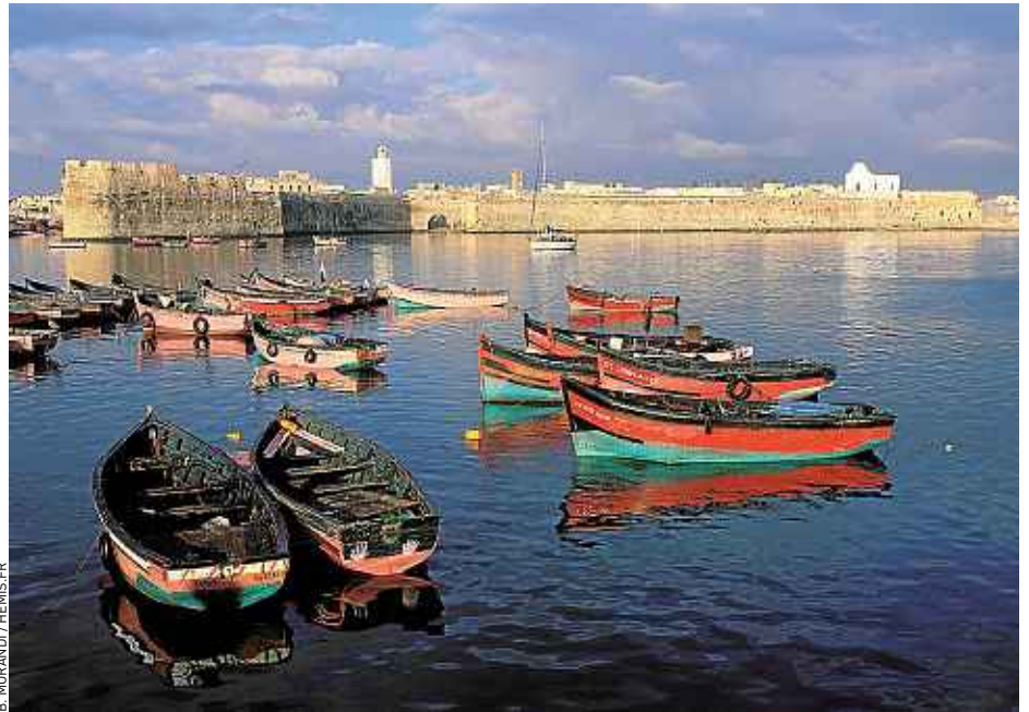
El Jadida est une cité fortifiée qui a conservé de superbes vestiges de son passé portugais.

prendre le temps de se promener dans la splendide cité fortifiée, cernée de remparts et flanquée de quatre bastions restaurés au XIX e siècle. Grimpez sur les larges chemins de ronde pour profiter du panorama. Il règne à l'intérieur de la cité une ambiance de village, d'un calme étrange. Peu de commerces, pas de souk... Cet ensemble complètement hors du temps, renferme une superbe citerne portugaise, classée au Patrimoine mondial de l'Unesco. La salle souterraine de cet ancien dépôt d'armes, dont l'épaisseur des murs dépasse les 3 m, pouvait contenir sur 1000 m 2 près de 2,7 millions