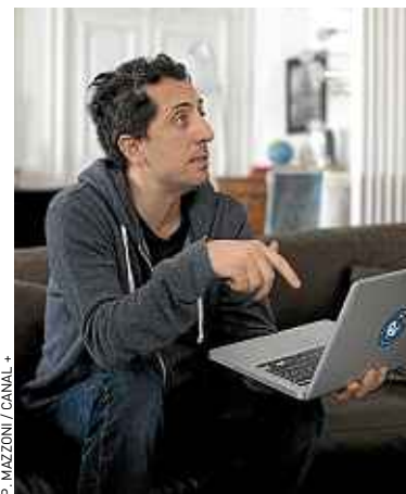
Gad approche le million d'abonnés.

► Coefficient de partage. S'il répond peu (11 % de ses tweets sont des réponses), il lui arrive néanmoins de faire des retweets (35 %). Majoritairement, Gad retweete les messages qui parlent de Gad. En premier lieu la @teamGadElmaleh, puis sa productrice Nicole Coullier. Ce qui lui vaut des critiques de twittos comme @lillibotte qui re-