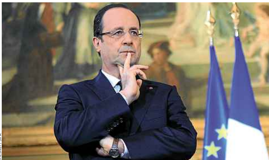
Les prises de paroles de François Hollande (ci-dessus à Dijon) ne l'ont pas rendu plus populaire.

Alors que dire ce jeudi soir ? « Pédagogie », « communica-