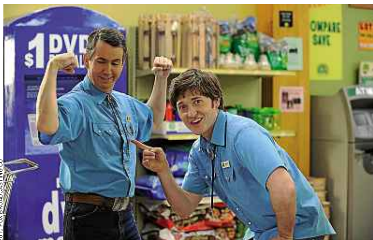
6ter (ici la saison 1 de « Raising Hope ») se trouverait en tête des audiences.