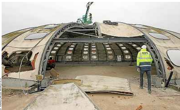
Une peau extérieure en caoutchouc recouvrira le dôme de la piscine.