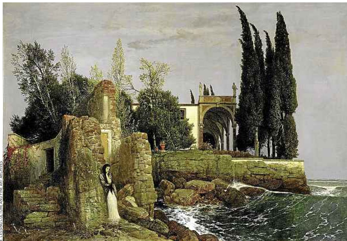
Villa au bord de mer d'Arnold Böcklin, paysage et personnage (sans doute Iphigénie), pareillement tourmentés.

Opportunément sous-titrée « Le romantisme noir », l'exposition « L'ange du bizarre » du musée d'Orsay déborde pourtant les frontières du romantisme. Comme pour les paysages de Friedrich, l'attrait durable pour les figures fantastiques – fantômes, sorcières et diabolins lubriques, ou châteaux hantés et ruines brumeuses – est un des symptômes de la popularité du romantisme. Même si certaines toiles peuvent apparaître ringardes. « Dans l'imaginaire de nos contemporains, malmenés par un quotidien anxiogène, le romantisme est ce qui relie le trivial au sublime, ce qui sauve leurs états d'âme de la banalité », rappelle Danièle Cohn, directrice du Centre d'esthétique et de philosophie de l'art pour expliquer que la peinture romantique revienne au goût du jour par périodes successives. « Même si on a l'impression qu'un certain académisme l'a