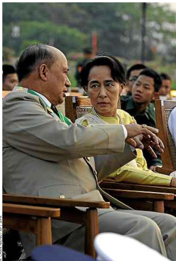
Aung San Suu Kyi, lors des cérémonies de l'armée, mercredi.

A l'époque, Aung San Suu Kyi avait refusé de prendre position. Un silence considéré comme de l'opportunisme. A deux ans de l'élection présidentielle de 2015, elle ne souhaiterait pas saper une base électorale nationaliste. Pourtant, « la montée des tensions religieuses constitue la plus grande menace pour la paix et une future transition vers la démocratie en Birmanie », analyse Célestine Foucher, du site InfoBirmanie. ■