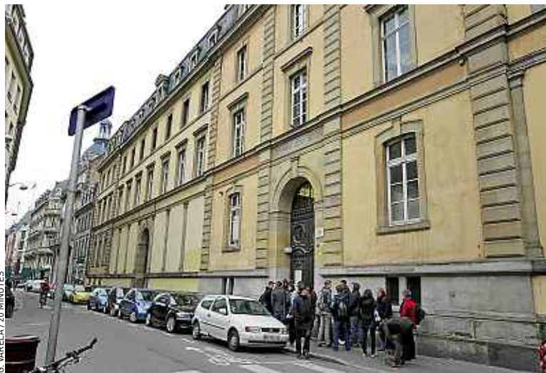
Le gymnase Jean Sturm affiche 100 % de réussite au baccalauréat en 2012.

► De la seconde au bac. Du côté du « taux d'accès » (les chances pour un élève de seconde d'obtenir le bac en restant dans le même établissement),