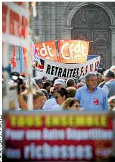
Mobilisation à Marseille, en 2011.

En effet, dès avril, 7,5 millions d'entre eux devront payer une taxe de 0,3 % pour éponger le trou de la Sécu. Au même moment, après l'accord des partenaires sociaux, les complémentaires seront revalorisées en dessous de l'inflation. Résultat, selon l'UCR : un pouvoir d'achat amputé de deux milliards d'euros pour 11 millions de retraités. L'exécutif pour-