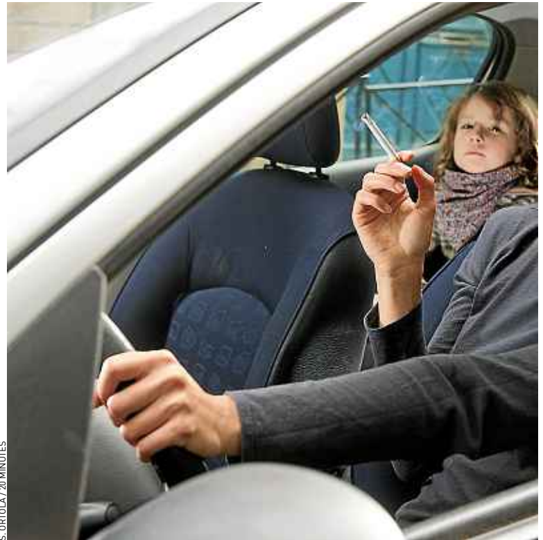
Un sénateur souhaite interdire le tabac en voiture en présence de mineurs.

Certaines plages à Cannes, La Ciotat, Nice, Menton et Ouistreham sont déjà interdites de tabac. A Auxerre, quatre squares et parcs ont déjà banni la cigarette. Depuis 2011, New York a elle aussi interdit de fumer dans ses 1 700 parcs. Une mesure qui aurait contribué à la baisse du taux de fumeurs.