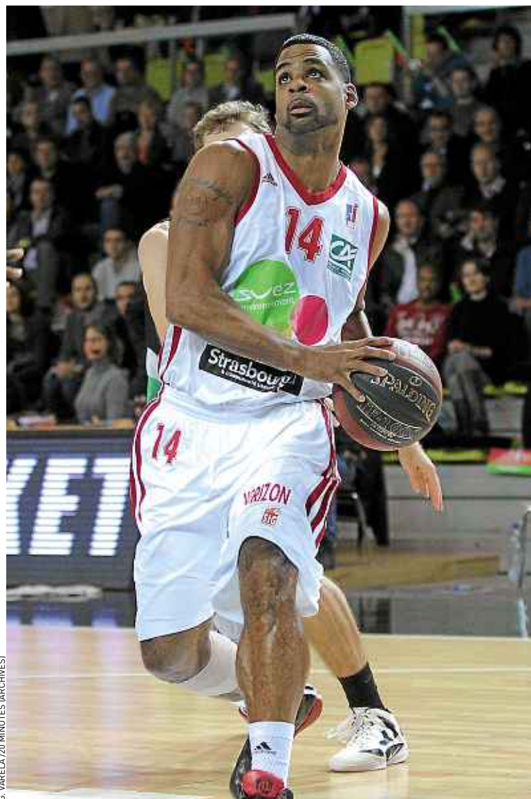
G. VARELA (20 MINUTES ARCHIVES)

Egalement coach de l'équipe de France, Vincent Collet part de jeudi à mercredi aux Etats-Unis s'entretenir avec des Bleus de NBA en vue de l'Euro 2013.