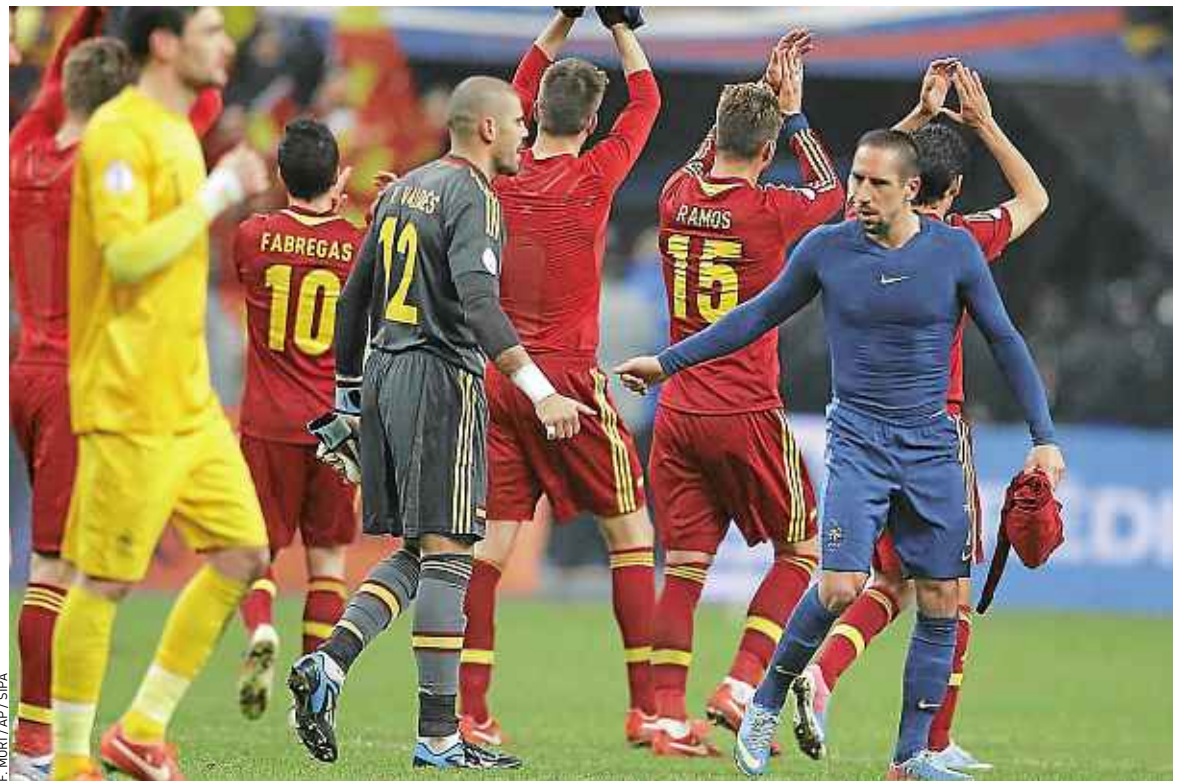
Le gardien espagnol Victor Valdés et le Français Franck Ribéry à la fin de la rencontre, mardi soir.

Le vétéran allemand Tommy Haas (35 ans) a créé la surprise mardi en éliminant en huitième de finale à Miami le numéro un mondial Novak Djokovic (6-2, 6-4). Il n'a eu besoin que de 80 minutes pour dominer le joueur serbe.