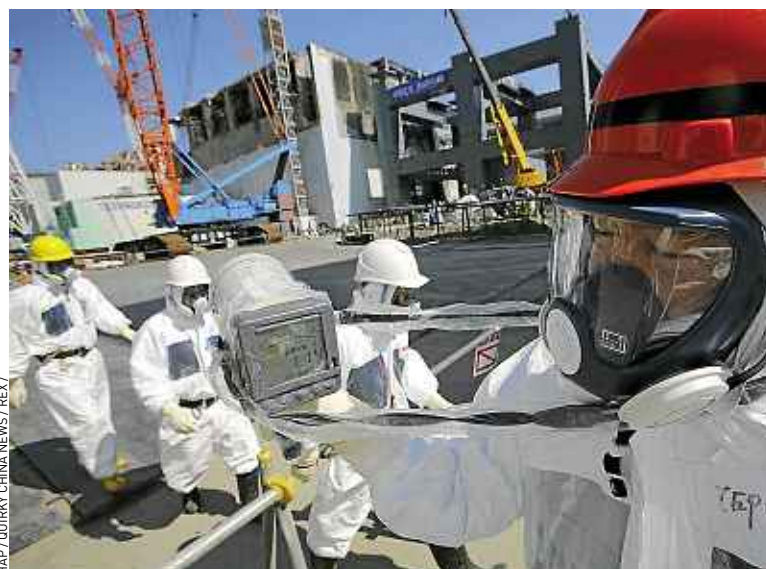
Deux réacteurs nucléaires ont été remis en service depuis la catastrophe.

peu habitué à descendre dans la rue. Selon un sondage récent, 70 % des Japonais sont partisans d'un abandon du nucléaire à terme. Avant Fukushima, le nucléaire couvrait 30 % des besoins en électricité du pays. Ses partisans jugent cette source d'énergie vitale pour assurer un approvisionnement stable en électricité, maintenir des tarifs bas et empêcher les industriels japonais de délocaliser à l'étranger. Un hommage sera rendu lundi aux victimes. A 14 h 46, sirènes et cornes de brume retentiront à la minute où a frappé le séisme. ■