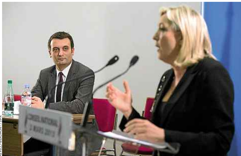
Florian Philippot est l'un des principaux conseillers de Marine Le Pen.