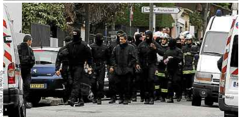
La DCRI (en h.) a été pointée du doigt dans la gestion du dossier Merah (en bas, le jour où celui-ci a été tué).

même les erreurs de la DCRI auraient été évitées, Merah serait quand même passé entre les mailles du filet », estime-t-il. Le travail de la mission d'évaluation du renseignement, préalable à sa ré-