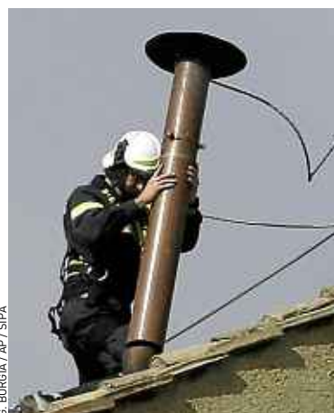
Samedi, la cheminée qui annoncera l'élection du pape, a été installée.

avant les fêtes de Pâques. Ils ont interdiction d'avoir des contacts extérieurs. Les préparatifs avancent. Samedi, des ouvriers du Vatican ont installé sur le toit de la chapelle Sixtine une cheminée dont la fumée devra annoncer si le pape est élu ou non. Comme le veut la tradition, une fumée noire signifiera qu'aucune décision n'a été prise, et une fumée blanche annoncera l'élection du nouveau souverain pontife. ■ F.V. (AVECREUTERS)