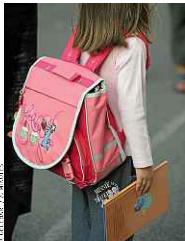
Le projet de loi accorde une grande place à la maternelle et au primaire.

détaillé Vincent Peillon dans une lettre aux personnels de l'Éducation nationale présentant son projet de refondation en décembre. Reste à savoir si ces mesures seront suffisantes pour endiguer l'échec scolaire tant le chantier est grand. Pour l'heure, à l'entrée au collège, 15 % des élèves français connaissent déjà des difficultés sévères ou très sévères et 25 % ont des acquis scolaires fragiles. ■ D.B.