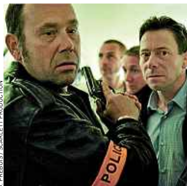
Olivier Gourmet et Mathieu Amalric.

Interpellations des membres du commando, puis pression sur leurs femmes placées en garde à vue, interrogatoires musclés... La trame suit au plus près les PV d'auditions pour retranscrire l'intensité d'un huis clos de quatre-vingt-seize heures au sein de la Direction nationale antiterroriste. Les noms des membres du groupe, condamnés en 2003, ont été