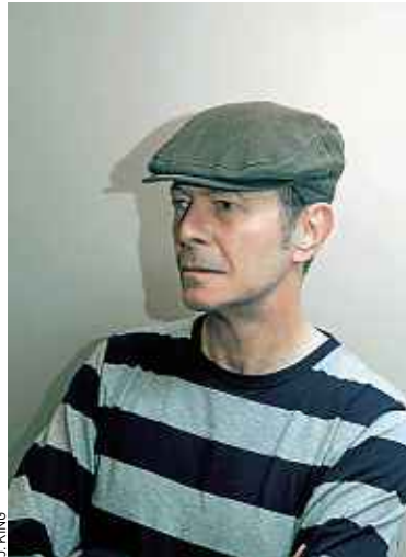
The Next Day , le dernier opus de David Bowie, est en vente ce lundi.

La principale qualité de l'album, et une surprise pour ceux qui pensaient Bowie mourant, est son énergie. Ces chansons donneraient à coup sûr le meilleur d'elles-mêmes sur scène. Hélas, le chanteur ne donnera aucun concert consécutivement à The Next Day . Il faudra donc se contenter de ses versions tarabiscotées à la production très présente. Peu de ballades, beaucoup de chansons rock épiques, quelques expérimentations sonores, du saxophone et des guitares électriques en distorsions systématiques... Mais pas de