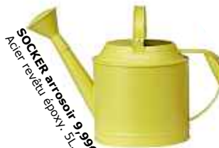
SOCKER arrosoir 9,99€ Acier revêtu époxy. 5L.