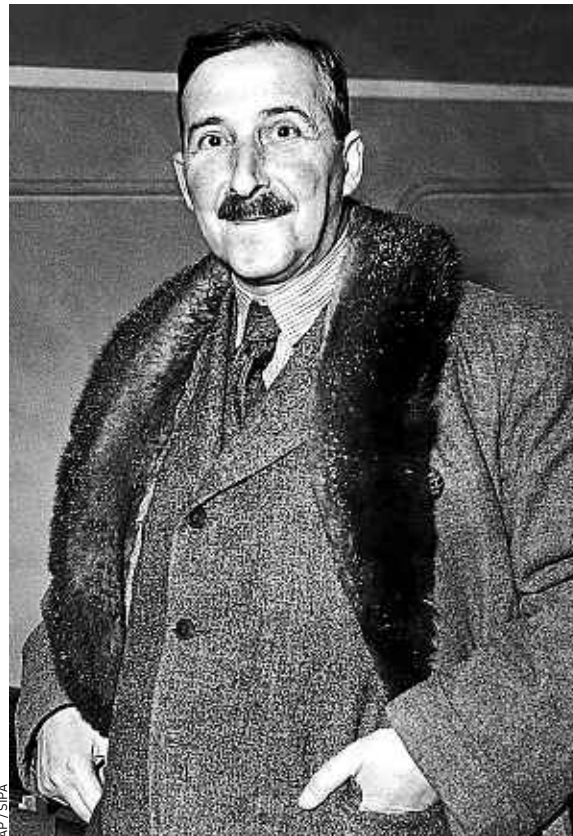
L'œuvre de l'Autrichien Stefan Zweig (à g.) est désormais libre de droit. Celle d'Apollinaire (à d.) le sera cet automne.