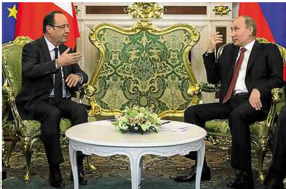
François Hollande et Vladimir Poutine ont affiché peu de gestes chaleureux.

Même sur la Syrie, point de discorde entre Moscou et Paris, les deux parties ont lissé leurs positions. « Nous avons les mêmes objectifs : éviter la dislocation de la Syrie » et ne pas laisser la porte ouverte « aux terroristes », a résumé François Hollande. « Nous avons eu une discussion intense, a reconnu Poutine. Le président Hollande a été d'accord avec certains de nos points de vue. Mais c'est impossible d'arriver à une position commune sans une bonne bouteille de vin ou de vodka. » Hollande, lui, suggère