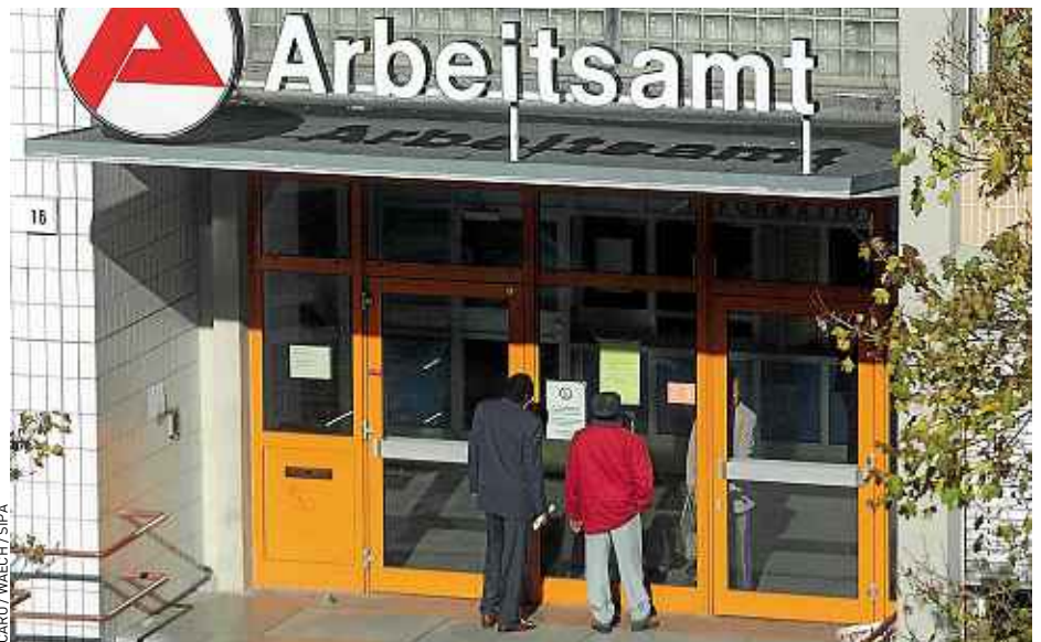
Le CDI dans l'intérim existe déjà en Allemagne (photo), en Italie, aux Pays-Bas et en Suède.