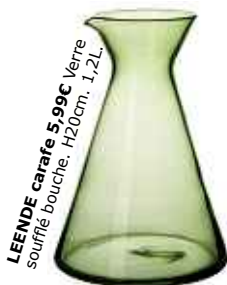
LEENDE carafe 5,99€ Verre soufflé bouche. H20cm. 1,2L.