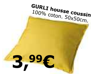
GURLI housse coussin 3,99€ 100% coton. 50x50cm.

VÅSTER suspension LED 69€ nouveau Ø 30cm. H40cm. Acier, peinture laque, plastique acrylique.