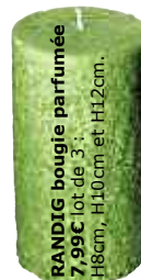
RANDIG bougie parfumée 7,99€ lot de 3. H8cm, H10cm et H12cm.