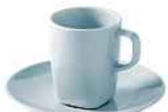
IKEA 365+ tasse expresso et soucoupe 2,59€ 5cl, porcelaine feldpasthique

par tranche de 50€ d'achat sur tous les accessoires et objets déco (2)