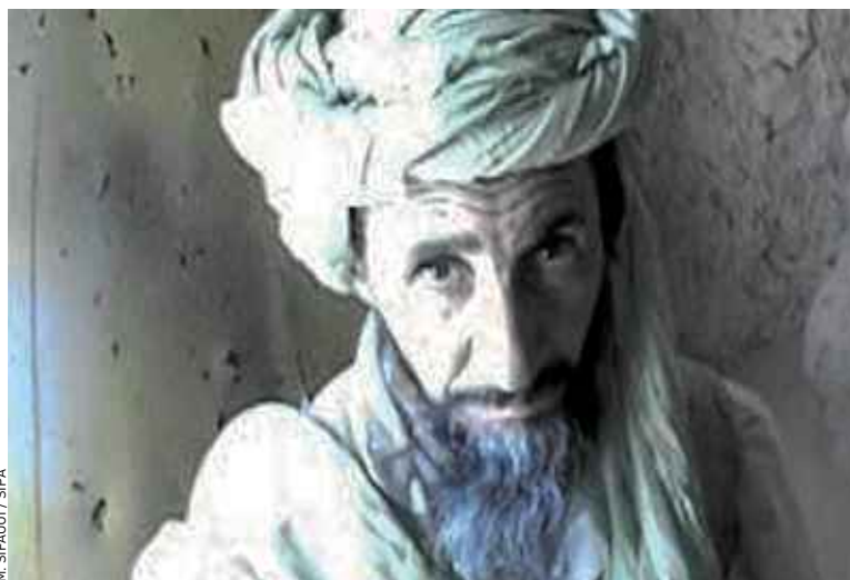
Abou Zeïd est considéré comme l'un des chefs les plus cruels d'Aqmi.

A Paris, l'état-major refusait jeudi soir de confirmer ou d'infirmer la nouvelle. Une source militaire haut placée confiait à 20 Minutes n'avoir « aucune information de cette nature à ce stade » et appelait à la « prudence ». Les autorités algériennes n'ont pas non plus confirmé l'information. Abou Zeïd, d'origine algérienne, est considéré comme l'un des chefs les plus cruels d'Aqmi. On lui attribue deux exécutions, celle du Britannique Edwin Dyer en 2009 et celle en