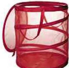
FYLLEN panier à linge 7,99€ 100% nylon, 100% polyester. Acier zingué. H50cm. 79L.