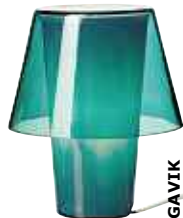
GAVIK Lampe de table 12,99€ Verre givré. H21cm