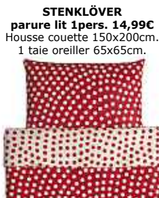
STENKLÖVER parure lit 1pers. 14,99€ Housse couette 150x200cm. 1 taie oreiller 65x65cm.