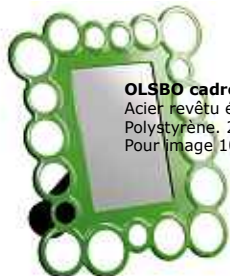
OLSBO cadre 3,99€ Acier revêtu époxy. Polystyrène. 22X26cm. Pour image 10x15cm.