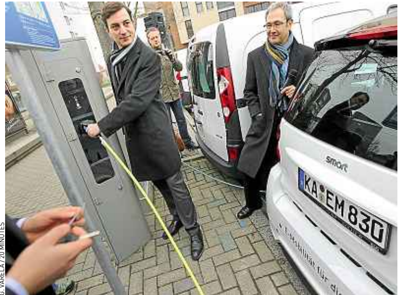
Chaque borne permet de charger simultanément deux véhicules.

d'EDF. Outre leur caractère transfrontalier, les badges donnent accès aux autres bornes installées dans la communauté urbaine de Strasbourg (CUS) : celles implantées pour l'expérimentation des Prius hybrides rechargeables de Toyota, qui vont être modernisées, et celles du réseau des hypermarchés Cora, alliés au constructeur Nissan. La CUS compte désormais 38 points de charge sur l'espace public. Selon Alain Fontanel (PS), vice-président de la CUS, ce maillage doit permettre de sécuriser les utilisateurs potentiels. ■