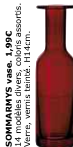
SOMMARMYS vase. 1,99€ 14 modèles divers, coloris assortis. Verre, vernis teinté. H14cm.