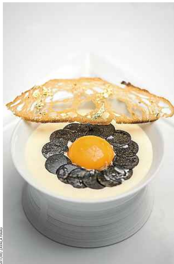
ARTURO ZAVALA HAAG

Pour 4 pers. Chauffer 20 cl de lait avec 10 cl de crème liquide et 50 g de beurre. Ajouter 100 g de beaufort et 100 g de vieille tomme rapés et faire fondre tout doucement comme pour une fondue. Mélanger à l'aide d'une spatule. Assaisonner, passer au chinois fin et tenir au bain-marie. Mettre 4 œufs à chauffer 10 min dans une eau à 55 °C. Couper 24 g de truffe en fines lamelles. Griller 4 tranches de pain de 1 mm d'épaisseur. Disposer la fondue dans une assiette creuse. Dresser les jaunes d'œuf au milieu et les lamelles de truffe autour. Finir en versant quelques gouttes d'huile de truffe.