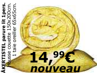
ÅKERTISTEL parure lit 1pers. 14,99€ nouveau Housse couette 150x200cm. 1 taie oreiller 65x65cm.