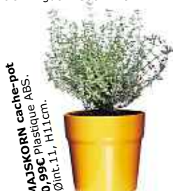
MAJSKORN cache-pot 0,99€ plastique ABS. Øint. 11. H11cm.