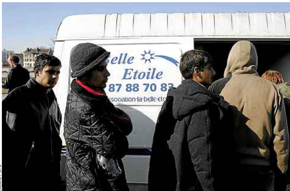
Jeudi, en plus des repas, l'association a offert du pain et du fromage (photo d'archives).

« Le mouvement associatif s'essouffle. Les bénévoles n'en peuvent plus, confie Vincent De Coninck, du Secours catholique. Ils ne comprennent pas pourquoi les pouvoirs publics ne prennent pas la situation en main. » Ce n'est pas faute d'essayer. « A chaque fois qu'on demande à la mairie de Calais un terrain où planter des tentes pour les migrants, ils nous répondent qu'on peut toujours les inviter dans notre jardin », dé-