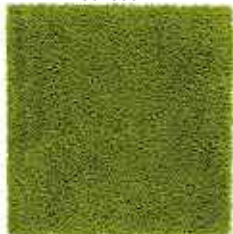
HAMPEN tapis 10,99€ 100% polypropylène. 80x80cm.