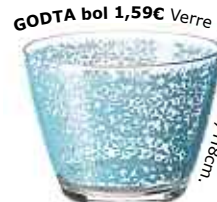
GODTA bol 1,59€ Verre trempé. Ø11. H8cm.