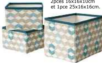
NOTUDDEN corbeilles 6,99€/3pcs 80% polyester, 20% coton. Polyuréthane. Garni polypro. 2pcs 16x16x10cm et 1pce 25x16x16cm.