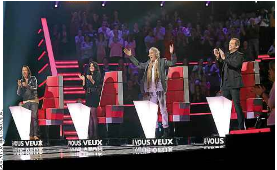
« De juge, les coachs passent au statut de candidat quand ils se retournent. »