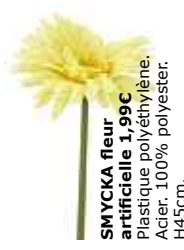
SMYCKA fleur artificielle 1,99€ Plastique polyéthylène. Acier. 100% polyester. H45cm.