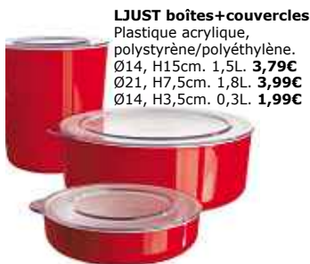
LJUST boîtes+couvercles Plastique acrylique, polystyrène/polyéthylène. Ø14, H15cm. 1,5L. 3,79€ Ø21, H7,5cm. 1,8L. 3,99€ Ø14, H3,5cm. 0,3L. 1,99€