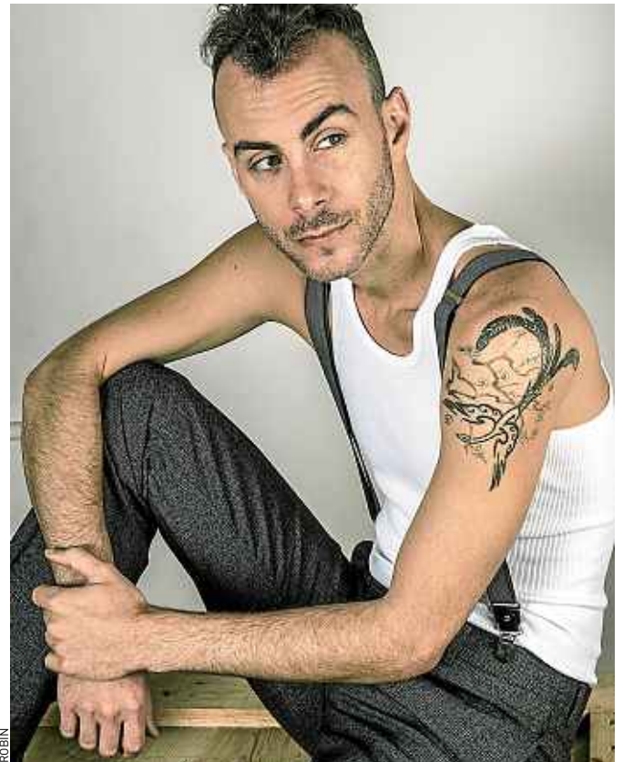
L'artiste israélien, Asaf Avidan, à la voix aiguë et bouleversante.

Oui, j'avais vécu une rupture très douloureuse et j'ai trouvé le chant et l'écriture de chansons pour sou-