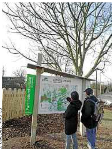
Le point de départ est situé sur le parking d'Emmaüs à Strasbourg.

Pour l'occasion, le parc s'est trouvé un nom. Ce sera « Ill-Bruche », puisque ses 400 ha à cheval sur les quartiers de Koenigshoffen, de l'Elsau et de la Montagne Verte sont au confluent des deux rivières. La nature n'y est pas reine : 35 000 habitants sont recensés. Mais le parc comporte de nombreuses zones