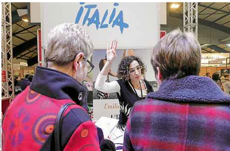
Le stand de l'Italie, destination phare des Alsaciens, ce week-end au Salon du tourisme.