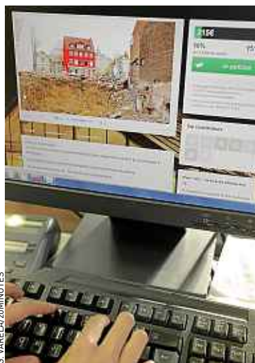
Le projet sur mymajorcompany.com.

d'envoyer des cartes postales ou quelques-uns de ses croquis à l'encre à ses contributeurs, selon la somme investie. En trois jours, 215 € ont été promis au photographe via la plateforme. A noter que samedi 16 février, Guillaume Romero ouvre les portes de son appartement* histoire de proposer au public un petit aperçu de son projet. ■ A.I. * 7, rue de l'Ecurie à Strasbourg, de 18 h à 20 h.