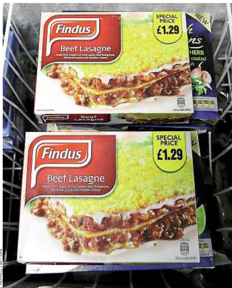
La viande de cheval a d'abord été détectée dans des lasagnes surgelées.