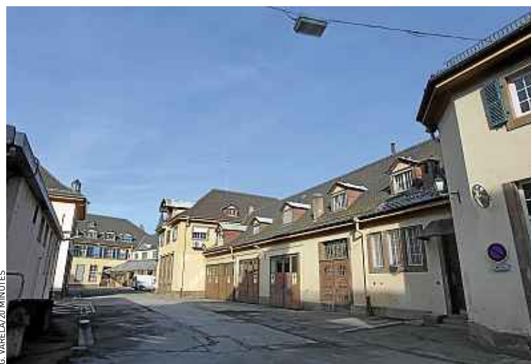
Le projet de campus prévoit la réhabilitation du bâtiment dit « ORL ».

Créer 2 000 emplois en dix ans, susciter l'implantation d'une cinquantaine d'entreprises et proposer des sessions de formations à 6 000 chirurgiens chaque année. Voici quelques-uns des objectifs du futur campus « Techmed » (contraction de « technologies médicales ») qui doit voir le jour à Strasbourg. Un institut de chirurgie mini invasive guidée par l'image en sera l'élément