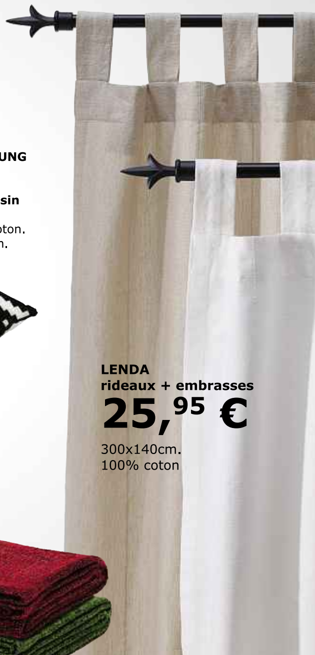
LENDÅ rideaux + embrasses 25,95 € 300x140cm. 100% coton