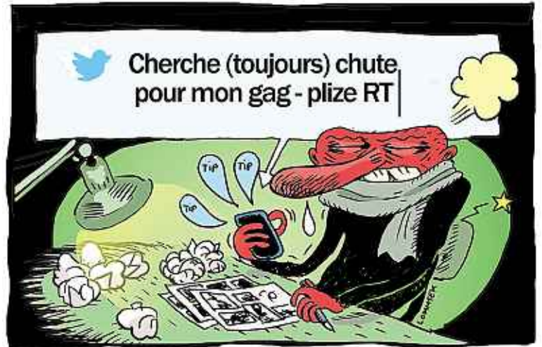
DESSIN EXCLUSIF DE LOMMSEK POUR « 20 MINUTES ».

« En BD, on aime réagir et on déborde d'idées qu'on veut communiquer, affirme de son côté Lommsek. On ne sait pas trop à qui on s'adresse, mais ça renforce les liens avec les lecteurs. » Historiquement, les dessinateurs ont investi les blogs, puis Facebook. « Twitter, c'est le troisième étage de la fusée, estime l'auteur de Qocha (Manolosantis). Le plus rapide et aussi celui qui nous apporte la plus large audience. » Pour transmettre des dessins, Lomm-