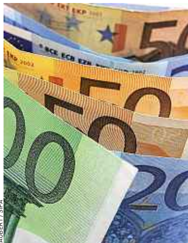
Depuis 14 mois, l'euro est à son plus haut niveau face au dollar.

Mais il dans le même temps victime d'une guerre des monnaies. La BCE refuse la surenchère. Aux États-Unis ou au Japon, sous la pression du pouvoir politique, les banques centrales font tourner la planche à billets afin de doper leur activité, ce qui a pour corollaire d'affaiblir la valeur de leur monnaie. « La Banque centrale européenne (BCE), qui tient à son indépendance, refuse la surenchère », décrypte Jacques Le Cacheux, économiste à l'Observatoire français des conjonctures économiques (OFCE). Résultat : la monnaie unique est à son plus haut niveau depuis 33 mois