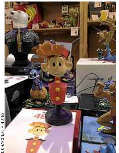
B. CHAPONZO MINUTES

tez l'ouvrage de référence L'Art de la bande dessinée (205 €). Les éditions Citadelles & Mazenot ont dédié le dernier volume de leur prestigieuse collection au 9 e art. Et les splendides reproductions des plus grands classiques de la BD des pionniers à nos jours suffisent à démontrer qu'il était temps de pouvoir ranger ce volume aux côtés des autres beaux-arts. ■ A ANGOUËME, B. C.