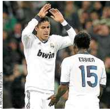
Raphaël Varane et Michael Essien.

Personne ne s'étonnera donc que le lendemain, Didier Deschamps le convoque pour la deuxième fois chez les Bleus. Lui qui avait déjà fait partie du groupe pour affronter l'Uruguay en amical début août, sans entrer en jeu, a prouvé au sélectionneur des Bleus qu'il était prêt pour l'étape d'après. « Il a un temps de jeu beaucoup plus important (18 matchs titulaires) sur le début d'année, a expli-