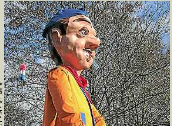
O.T. MONTS DE FLANDRE

La saison des carnivals démarre ce week-end.