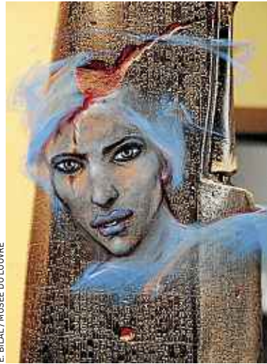
E. BILAL / MUSÉE DU LOUVRE

Le regard tourmenté, le visage couleur de craie, le spectre d'Antonio di Aquila vient briser la tranquillité de La Joconde . Il y a aussi Lantelme Fouache ou William Tümpeltdt, compagnons disparus de la Jeune orpheline au cimetière de Delacroix et du Bœuf écorché de Rembrandt. Tous sont morts du jour au lendemain, fauchés par une diligence, coupés en morceaux... En fait-diversier improvisé, Enki Bilal s'est amusé à raconter leurs fins tragiques au travers des vingt-trois bio-