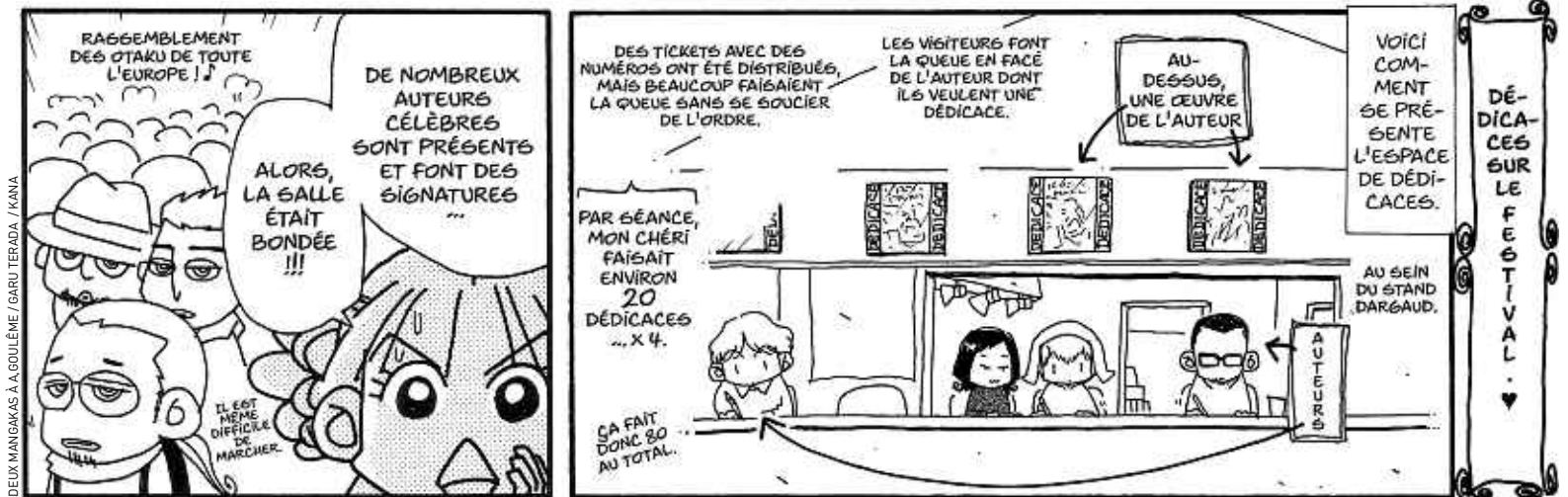
Cases extraites de Deux mangakas à Angoulême (Kana, 12,70 €) de Garu Terada, qui raconte le séjour angoumois des Japonais Toru et Garu Terada.