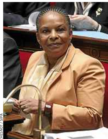
Christiane Taubira, mercredi.

Reste que le timing pose question. Surtout chez les socialistes où l'on dénonce une tactique hasardeuse. « Je ne comprends pas l'intérêt et la stratégie du gouvernement, d'autant moins que les Français attendent en priorité des réponses sur les sujets sociaux et écono-