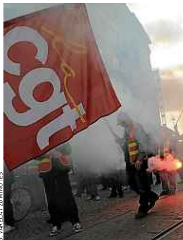
Un défilé de la fonction publique, à Strasbourg en 2011.