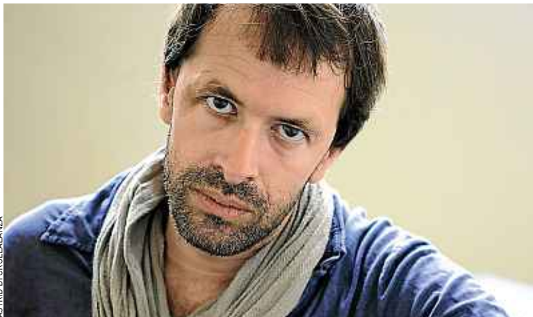
Notre mariage est le deuxième roman de Christophe Mouton.