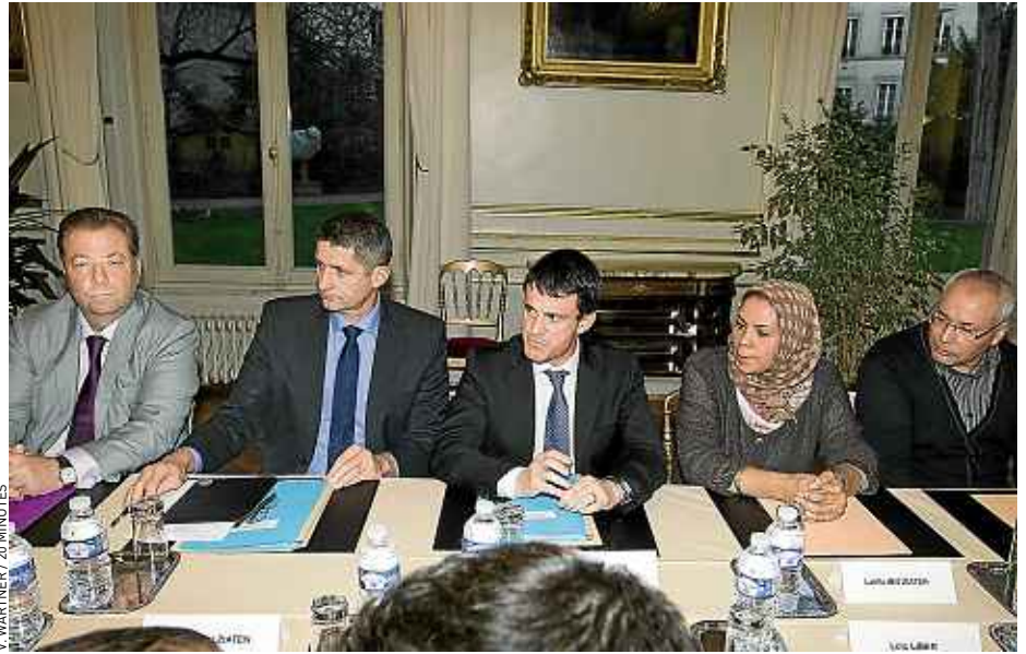
L'entretien avec Manuel Valls (au c.) n'a pas satisfait les familles des victimes de Mohamed Merah.