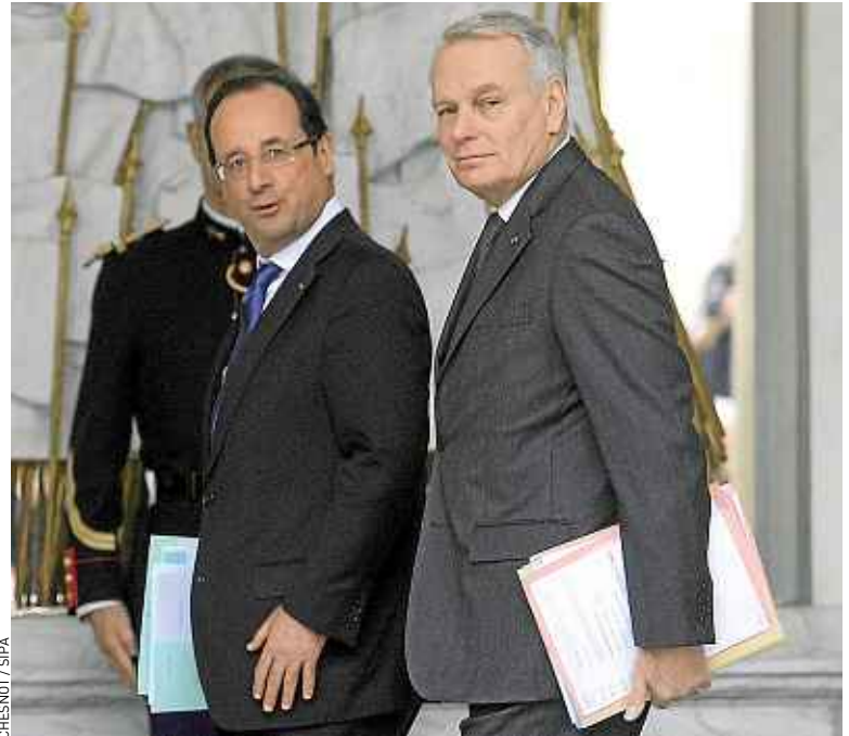
Selon Matignon, c'est Hollande qui aurait demandé à Ayrault de relancer les sujets pouvant faire l'objet d'une réforme constitutionnelle.