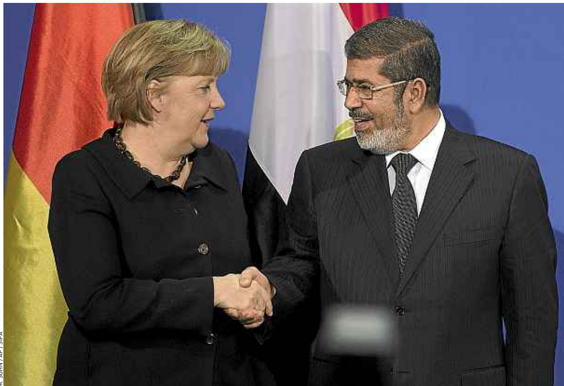
La chancelière allemande Angela Merkel et le chef de l'Etat égyptien Mohamed Morsi, mercredi à Berlin.

En signe de bonne volonté – ou par tactique politique –, Mohamed Morsi a affirmé depuis Berlin que l'Égypte allait être gouvernée selon les principes d'un « Etat de droit, dans le cadre d'un Etat civil qui n'est pas un Etat militaire ni un