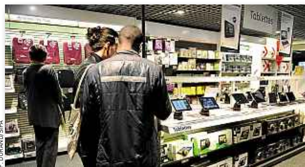
Avant de prendre une extension de garantie, étudiez-la.

« S'il manque un pixel sur votre écran, nous vous le remplaçons. Encore mieux ! Si votre appareil tombe en panne, nous le changeons par un produit plus récent ! » Le vendeur du magasin de matériel informatique aura tout essayé pour vous faire souscrire une extension de garantie sur votre nouveau joujou. Vous avez refusé.