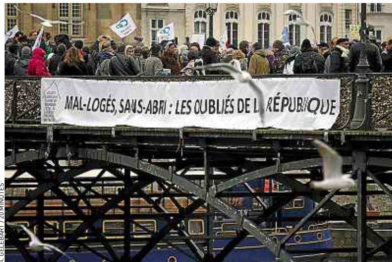
Ces associations avaient déjà manifesté, pont des Arts à Paris, le 5 décembre.