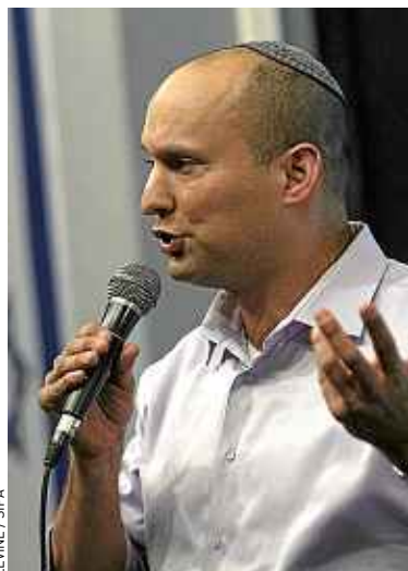
Naftali Bennett, le 3 janvier.

Des législatives avancées se tiendront en Israël le 22 janvier, le gouvernement n'ayant pas réussi à trouver un accord sur le budget. Les Israéliens sont invités à voter pour les 120 députés qui siègent à la Knesset, selon un mode de représentation strictement proportionnelle. Ce qui oblige tout gouvernement à former de larges coalitions. Pour l'élection, le Likoud (droite) a fait une alliance avec le parti ultranationaliste Israel Beytenou.