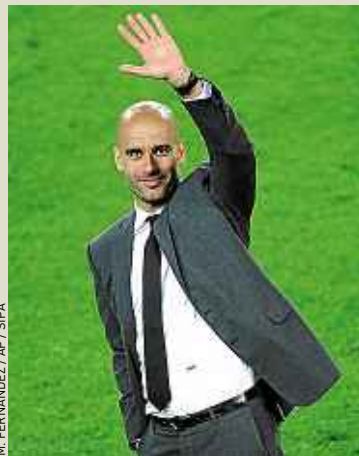
Pep Guardiola, ex-coach du Barça.

Le président du Bayern, Karl-Heinz Rummenigge, s'est exprimé sur l'arrivée de l'ancien technicien de Barcelone sur le site officiel du club. « On se réjouit d'avoir réussi à faire venir Pep Guardiola, alors que de nombreux autres grands clubs européens l'avaient contacté et le voulaient. C'est l'un des entraîneurs les plus talentueux du monde et nous sommes persuadés qu'il va apporter un vrai plus au Bayern, mais aussi au football al-