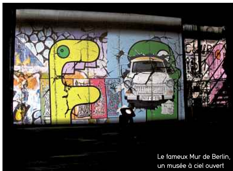
Le fameux Mur de Berlin, un musée à ciel ouvert