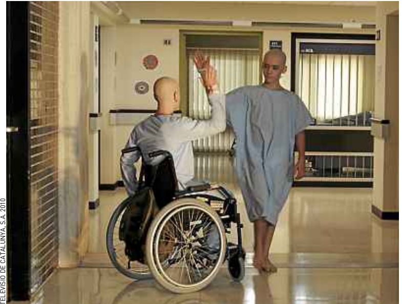
« Les bracelets rouges » ce soir à 20 h 45, sur la chaîne Numéro 23.

Comme toutes les chaînes d'info, France 2 a diffusé dimanche dernier un reportage sur la manifestation contre le « mariage pour tous ». Un passage, très court, y montre Gilbert Collard, député non inscrit proche du Front national, en tête du cortège. A ses côtés, sur la droite, une femme est en train de rire, avec lui vraisemblablement. L'image est rediffusée le lendemain midi. Problème : la femme est journaliste à France 3. Quand elle se découvre à l'image, elle demande que celle-ci soit retirée du service de rattrapage de France Télé, Pluzz. La di-