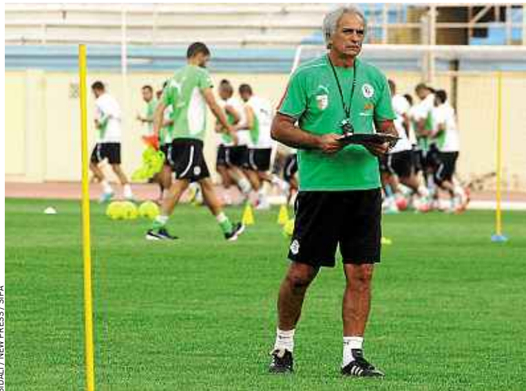
L'Algérie a préféré confier son équipe nationale à Vahid Halilhodzic.

Le problème est également symbolique. S'attacher les services d'une personnalité comme Claude Le Roy ou d'un Vahid Halilhodzic sert de propagande au pouvoir politique. Il est aussi plus compliqué pour un entraîneur du cru de se détacher du contexte local. Dans certains pays, le choix d'un technicien d'une certaine ethnie peut froisser l'autre. Dans d'autres, les querelles de clocher demeurent. « Un entraîneur issu de tel ou