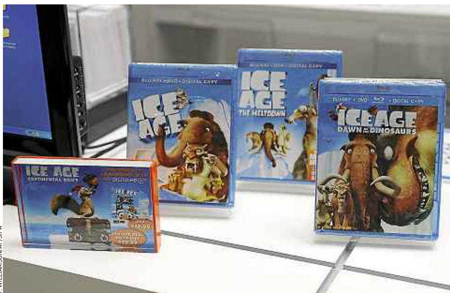
Le quatrième volet de L'Âge de glace fait partie du top 3 des meilleures ventes DVD de 2012.