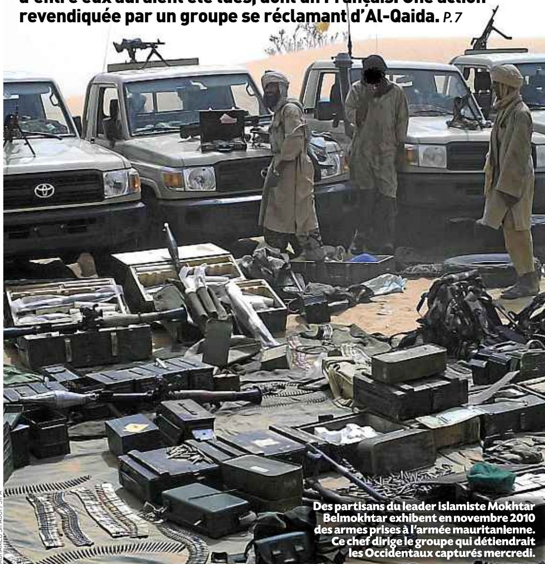
Des partisans du leader Islamiste Mokhtar Belmokhtar exhibent en novembre 2010 des armes prises à l'armée mauritanienne. Ce chef dirige le groupe qui détiendrait les Occidentaux capturés mercredi.

Après l'intervention française au Mali, des islamistes auraient pris en otage 41 Occidentaux, mercredi en Algérie. Plusieurs d'entre eux auraient été tués, dont un Français. Une action revendiquée par un groupe se réclamant d'Al-Qaida. P.7