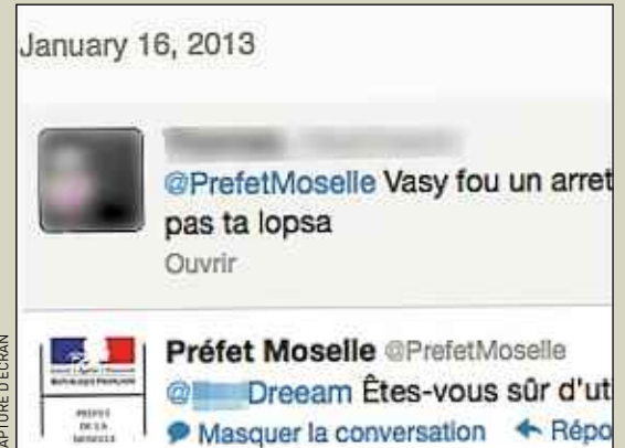
Les messages étaient truffés d'insultes.

exemple envoyé l'un d'entre eux. Le préfet a maintenu sa décision, répondant avec flegme : « Etes-vous sûr d'utiliser le ton adéquat ? » Certains des messages, supprimés de Twitter, ont été réunis pour la postérité sur un Tumblr dédié (vasyleprefet.tumblr.com). Les services du préfet ont, après quoi, reçu de nombreux messages de soutien. ■ VINCENT VANTIGHEM ET CHRISTOPHE QUÉLAIS