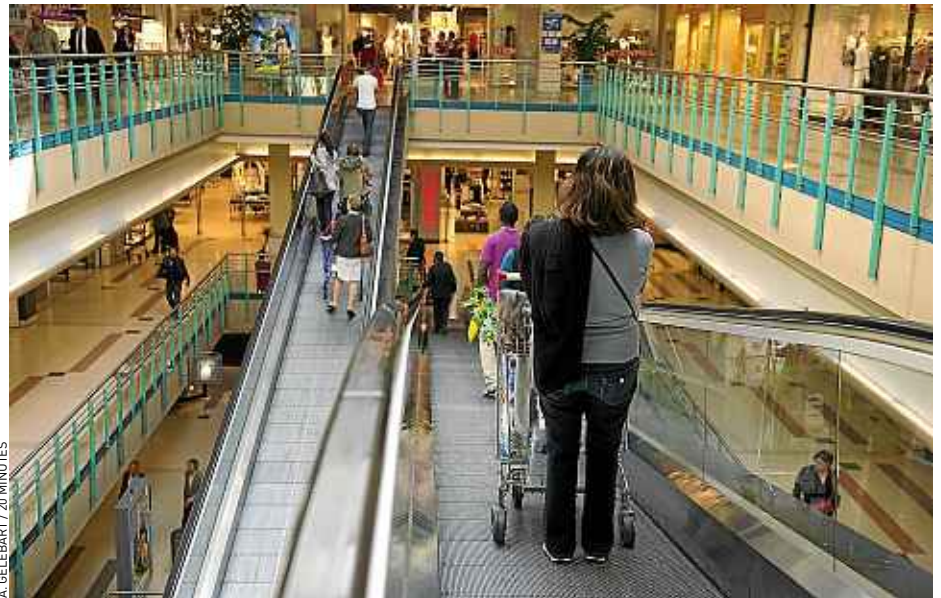
Quelque 488 289 m 2 supplémentaires devraient voir le jour en 2013 (illustration).

Une aberration économique ? Pas toujours. « Dans des zones comme l'Île-de-France, le Sud ou la façade ouest, qui sont en fort développement démographique, c'est assez sain », estime le spécialiste. « En revanche, ailleurs, on peut s'interroger sur la pertinence des projets au vu des pro-