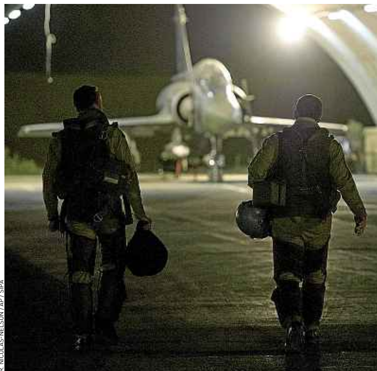
Les avions français frappent les bases islamistes au nord et au centre du Mali.

L'opération – baptisée « Serval », du nom d'un félin d'Afrique – poursuit trois objectifs, a détaillé le ministre : « arrêter l'offensive en cours », « empêcher ces groupes [terroristes et djihadistes] de nuire plus avant et de mettre en péril la stabilité du pays », et protéger les 6 000 ressortissants français au Mali. Elle se traduit par un appui aérien aux troupes maliennes. Parallèlement,