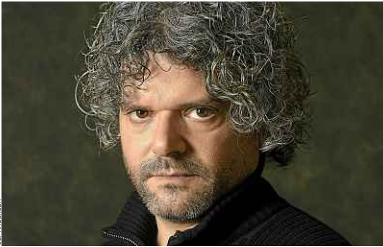
Dans le récit de Shalom Auslander, Anne Frank n'est pas morte...