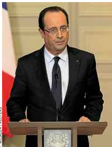
François Hollande, vendredi.