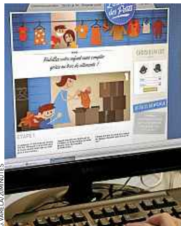
300 lots de vêtements sont en ligne.

« L'originalité ici, c'est que le troc se fait par lots », explique-t-il. Composés de plusieurs vêtements du même sexe et de même taille, chaque lot vaut entre 80 et 100 €, mais les utilisateurs ne