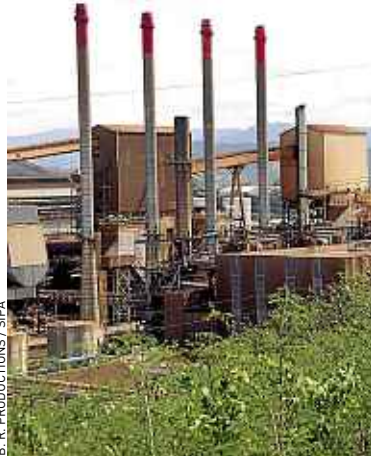
L'usine Eramet-SLN, sur la presqu'île de Doniambo (Nouvelle-Calédonie).