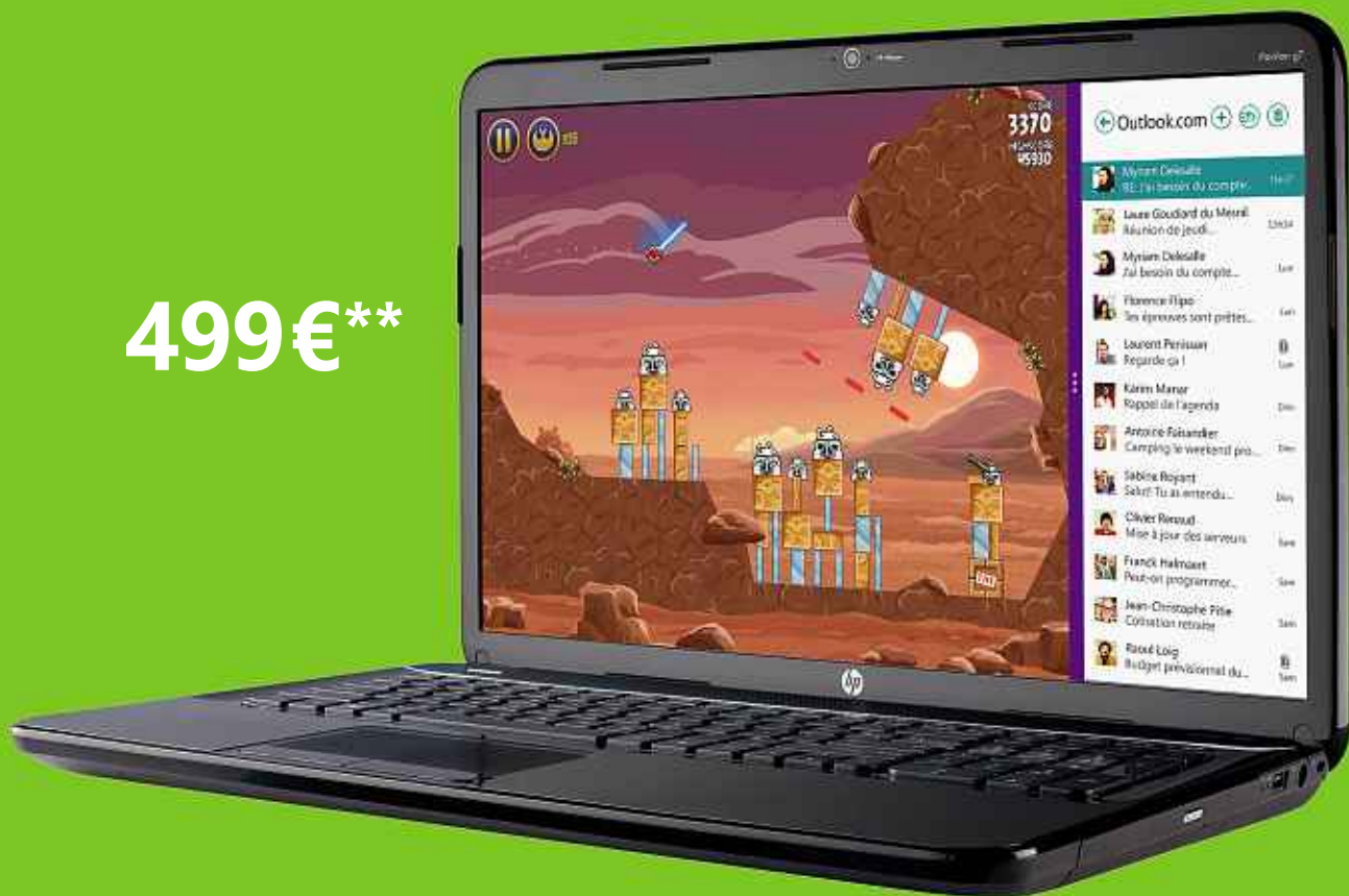
HP Pavilion G7-2242