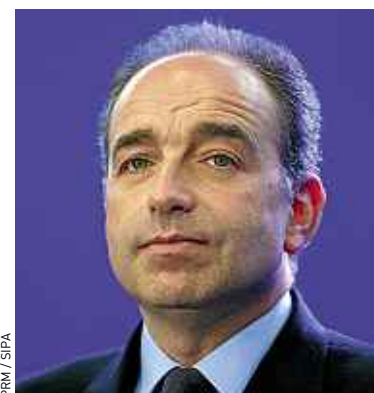
Le président de l'UMP.

Opposé au projet, François Fillon ne manifestera pas. Mais difficile pour autant de différencier copistes et filonistes. Luc Châtel et Jean-Pierre Raffarin ne défilent pas, alors que les fidèles de l'ancien Premier ministre Valérie Pécresse et Laurent Wauquiez en seront. « Je ne suis pas un grand fan des manifestations. Ce n'est à mon avis pas le rôle des politiques. Et puis sur le fond du projet, mon avis n'est pas encore tranché. Je préfère attendre le débat parlemen-