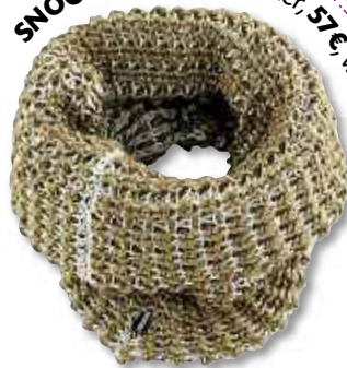
SNOOD EN LAINE - Blauer, 57€, www.blauer.it