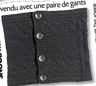
SNOOD MIRA MIRA - vendu avec une paire de gants assortie, Emu Australia, 119€, www.emuaustralia.com