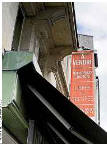
Les banques sont à la recherche d'emprunteurs.