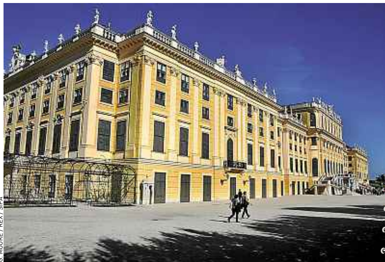
Sissi préférait résider au château de Schönbrunn, plutôt qu'à Vienne.

Fervente adepte de l'exercice physique, obsédée par la minceur, Sissi utilisait des appareils de gymnastique que l'on peut encore voir dans son cabinet de toilette. La visite du Hofburg permet aussi d'admirer de magnifiques parures et une grande collection de services de vaisselle, dont un incroyable centre de table en porcelaine de 30 m de longueur! Plutôt qu'à Vienne, Sissi préfé-