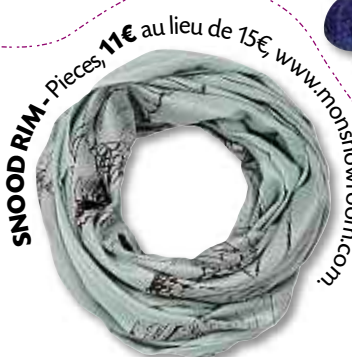
SNOOD RIM - Pièces 11€ au lieu de 15€, www.morishowroom.com

A dieu foulards, adieu écharpes. Pour avoir chaud cet hiver tout en restant ultra-pointue côté style, enfiler une écharpe en forme de tube. Les fashionistas l'ont définitivement adopté et l'appelle le snood . Plus pratique que l'écharpe ? « Facile à enfiler, le snood ne tombe pas par terre. Il colle parfaitement au niveau du cou et tient bien chaud », souligne Chrystèle Pourret-Nolorgues, fondatrice de Cape et crochet. Autre atout : « Depuis que les écharpes ne sont plus les bienvenues dans certaines écoles [et manèges], c'est une alternative pour les enfants », poursuit Chrystèle Pourret-Nolorgues. D'ailleurs, initialement dédié au tricot pour enfants, Cape et crochet s'est doté d'une ligne de snoods pour les « grands enfants », à la suite des demandes incessantes des adultes. Une bonne raison donc pour se mettre au tricot. ■