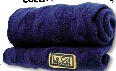
COLENCACHEMIRE - 129€, www.cachemire.com