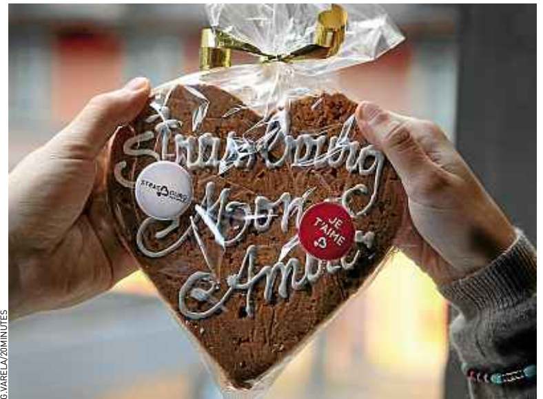
Des pâtisseries participent aussi à l'opération « Strasbourg, mon amour »