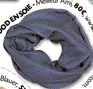
SNOOD EN SOIE - Meilleur Ami, 80€, www.meilleurami.paris.com