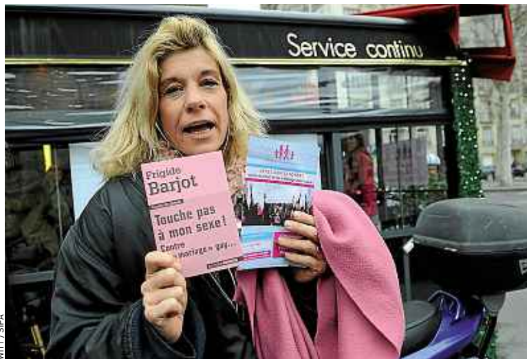
Frigide Barjot : parodiste, chroniqueuse, humoriste et catholique convaincue.

P endant longtemps, elle a plus fréquenté les boîtes de Saint-Tropez que le Saint-Esprit. « Sa Trinité à elle, c'était fêtes, alcool et rock'n'roll », indique ainsi Confessions d'une catho branchée , son autobiographie. Mais dimanche, Frigide Barjot mènera le cortège des opposants au « mariage pour tous » dans les rues de Paris. Officiellement, ce n'est que l'une des sept porte-parole de La Manif pour tous, qui réunit 34 associations contre l'engagement 31 de François Hollande. « Mais c'est elle qui attire toute la lu-