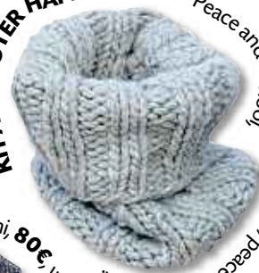
KIT À TRICOTER HAPPY SNOOD - Peace and Wool, 59€, http://peaceandwool.com