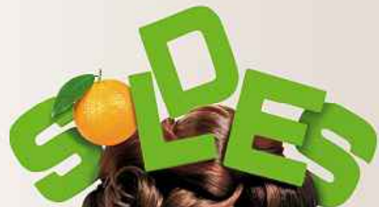
grafit.fr - création coiffure : Linda Bankallah