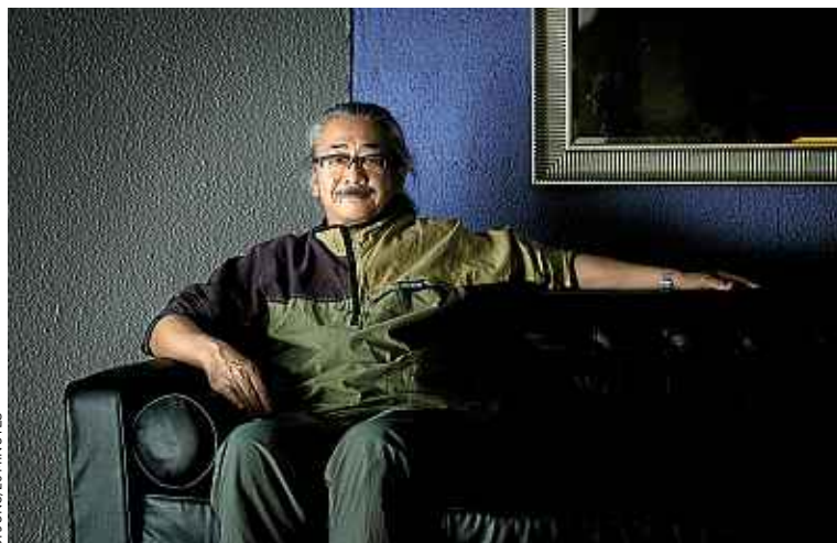
Le Japonais Nobuo Uematsu, musicien et compositeur.

Autodidacte, Nobuo Uematsu a d'abord multiplié les petits boulots : « Voiturier, conducteur d'engins sur les chantiers, travail à la chaîne dans une usine Coca-Cola », raconte-t-il. Nobuo s'acharne. Il crée des musiques pour des spots de pub et fait une rencontre avec un responsable de l'éditeur Square Enix. « Il m'a proposé de petites commandes pour les jeux vidéo. Personne ne voulait s'occuper de ces contrats, ce n'était pas valorisant », se souvient-il. C'était comme pour le ciné au temps du muet. Uematsu compose « à une