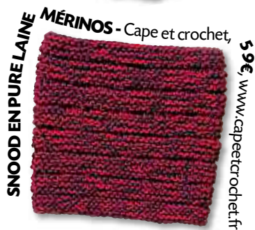
SNOOD EN PURE LAINE MÉRINOS - Cape et crochet, 59€, www.capeetcrochet.fr