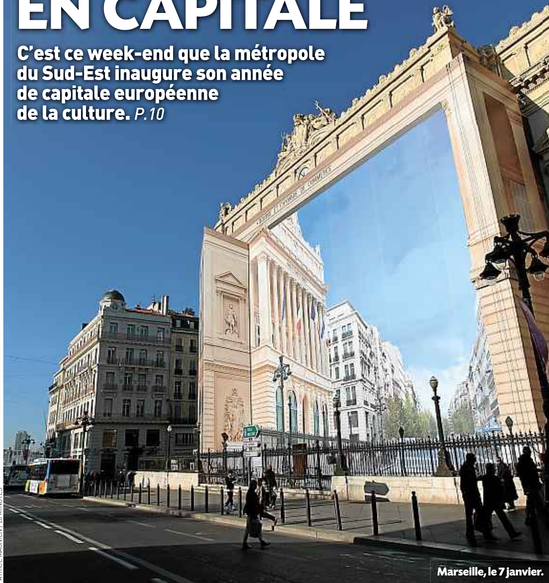
Marseille, le 7 janvier.

C'est ce week-end que la métropole du Sud-Est inaugure son année de capitale européenne de la culture. P.10