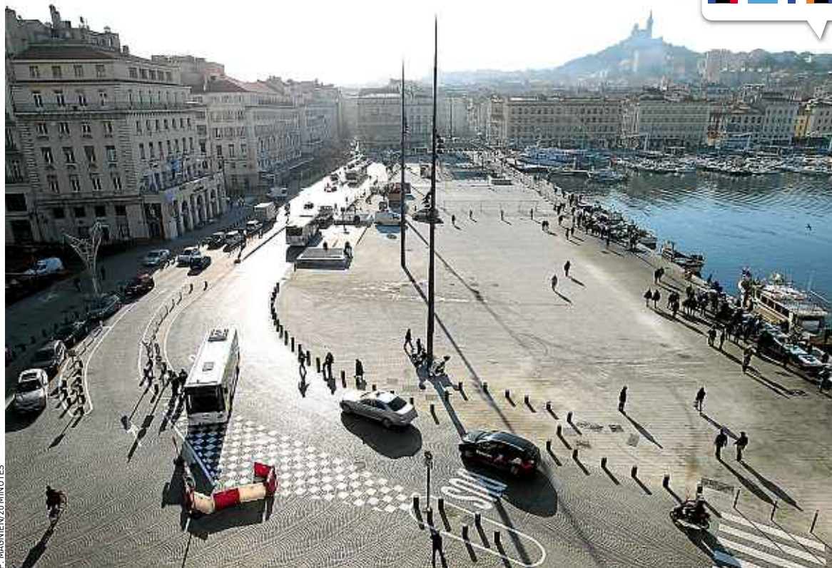
Pour ses différents projets architecturaux (ici, le Vieux-Port rénové), Marseille 2013 a dépensé 700 millions d'euros.

L'impact touristique a également été très positif pour les deux ports de la Baltique, Vilnius (Lituanie) et Tallinn (Estonie), respectivement capitales de la culture en 2009 et 2011. « Nous existons sur la carte des destinations de-