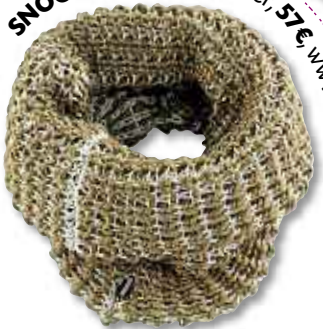
SNOOD EN LAINE - Blauer, 57€, www.blauer.it