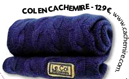
COLENCACHEMIRE - 129€, www.cachemire.com