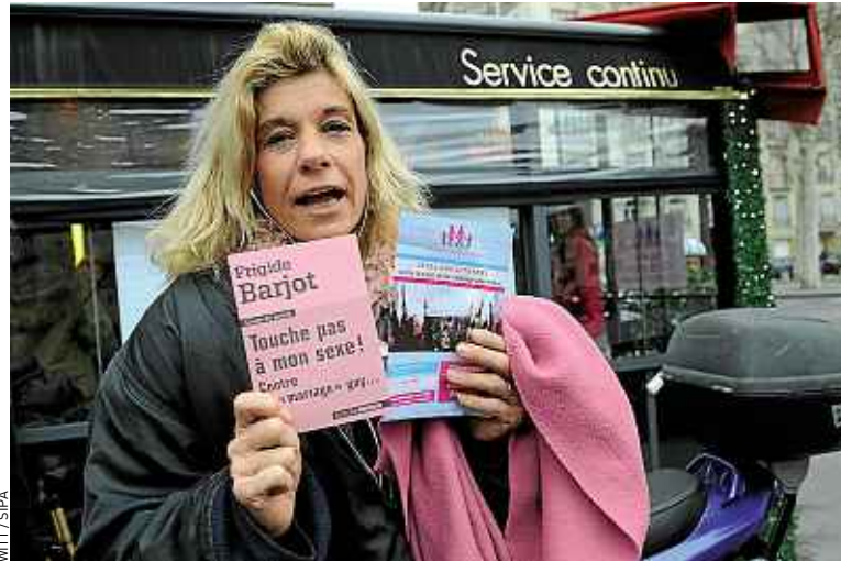
Frigide Barjot : parodiste, chroniqueuse, humoriste et catholique convaincue.

Pendant longtemps, elle a plus fréquenté les boîtes de Saint-Tropez que le Saint-Esprit. « Sa Trinité à elle, c'était fêtes, alcool et rock'n'roll », indique ainsi Confessions d'une catho branchée , son autobiographie. Mais dimanche, Frigide Barjot mènera le cortège des opposants au « mariage pour tous » dans les rues de Paris. Officiellement, ce n'est que l'une des sept porte-parole de La Manif pour tous, qui réunit 34 associations contre l'engagement 31 de François Hollande. « Mais c'est elle qui attire toute la lu-