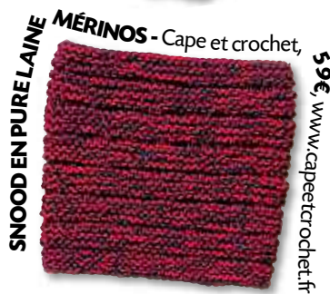
SNOOD EN PURE LAINE MÉRINOS - Cape et crochet, 59€, www.capeetcrochet.fr