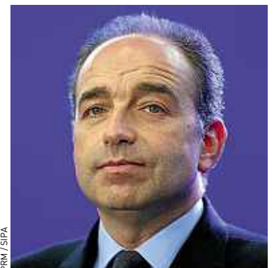
Le président de l'UMP.

Opposé au projet, François Fillon ne manifestera pas. Mais difficile pour autant de différencier copéistes et filonistes. Luc Châtel et Jean-Pierre Raffarin ne défilent pas, alors que les fidèles de l'ancien Premier ministre Valérie Pécresse et Laurent Wauquiez en seront. « Je ne suis pas un grand fan des manifestations. Ce n'est à mon avis pas le rôle des politiques. Et puis sur le fond du projet, mon avis n'est pas encore tranché. Je préfère attendre le débat parlemen-