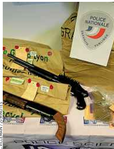
La drogue et les armes saisies à Villeurbanne.

Au total, l'an passé, 5 700 personnes ont été interpellées dans le Rhône pour trafic de drogue, soit 15 personnes par