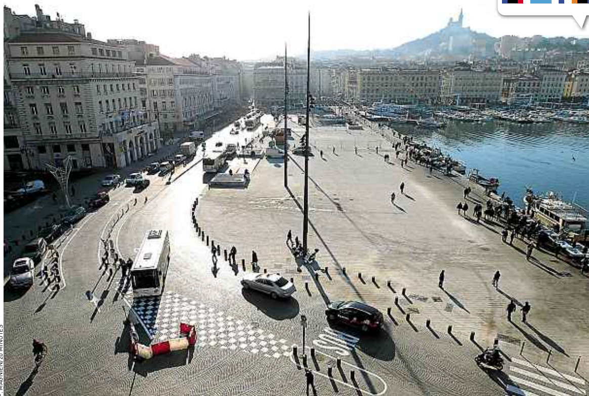
Pour ses différents projets architecturaux (ici, le Vieux-Port rénové), Marseille 2013 a dépensé 700 millions d'euros.

L'impact touristique a également été très positif pour les deux ports de la Baltique, Vilnius (Lituanie) et Tallinn (Estonie), respectivement capitales de la culture en 2009 et 2011. « Nous existons sur la carte des destinations de-