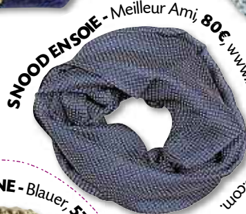
SNOOD EN SOIE - Meilleur Ami, 80€, www.milleurami-paris.com