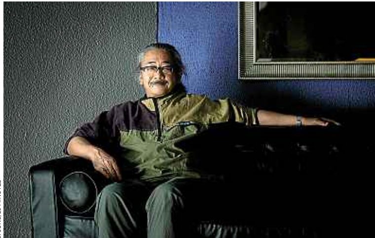
Le Japonais Nobuo Uematsu, musicien et compositeur.

Pour Christophe Héral, compositeur de « Rayman Origins », « il fait partie des gens qui ont balisé la musique de jeux vidéo ». Pour la plupart des joueurs, Uematsu se confond avec la nostalgie de « Final Fantasy VII », premier jeu de rôle japonais (sur PlayStation), à connaître un succès populaire en Occident.