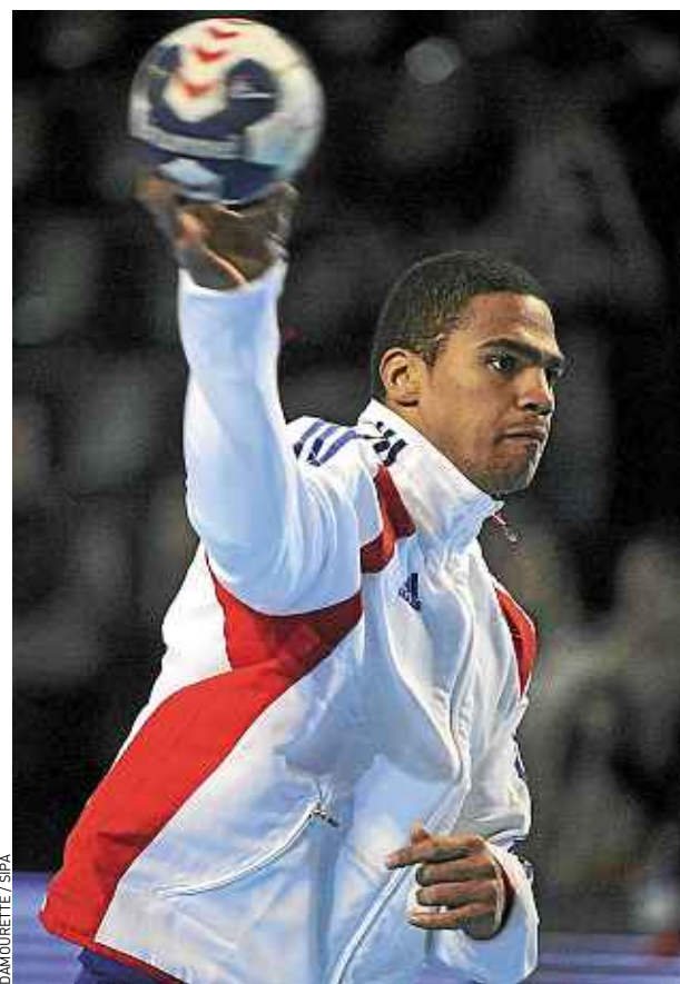
Daniel Narcisse a été élu meilleur joueur du monde en 2012.