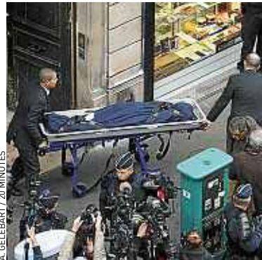
Hier, rue Lafayette, à Paris.

Alors que Manuel Valls qualifie cet acte de « grave et d'inacceptable », dans la foule, des drapeaux à l'effigie du chef kurde Abdullah Öcalan s'agitent et les premiers slogans résonnent. Après avoir crié « Vengeance » et scandé « Les martyrs ne meurent jamais », la foule accuse également : « Turquie assassin, Europe complice ». « C'est un acte politique,