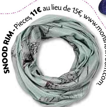
SNOOD RIM - Pièces, 11€ au lieu de 15€, www.monshowroom.com

A dieu foulards, adieu écharpes. Pour avoir chaud cet hiver tout en restant ultra-pointue côté style, enfiler une écharpe en forme de tube. Les fashionistas l'ont définitivement adopté et l'appelle le snood . Plus pratique que l'écharpe? « Facile à enfiler, le snood ne tombe pas par terre. Il colle parfaitement au niveau du cou et tient bien chaud », souligne Chrystèle Pourret-Nolorgues, fondatrice de Cape et crochet. Autre atout : « Depuis que les écharpes ne sont plus les bienvenues dans certaines écoles [et manèges], c'est une alternative pour les enfants », poursuit Chrystèle Pourret-Nolorgues. D'ailleurs, initialement dédié au tricot pour enfants, Cape et crochet s'est doté d'une ligne de snoods pour les « grands enfants », à la suite des demandes incessantes des adultes. Une bonne raison donc pour se mettre au tricot. ■