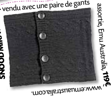
SNOOD MIRA MIRA - vendu avec une paire de gants assortie, Ennu Austria, 19€, www.ennu-austria.com