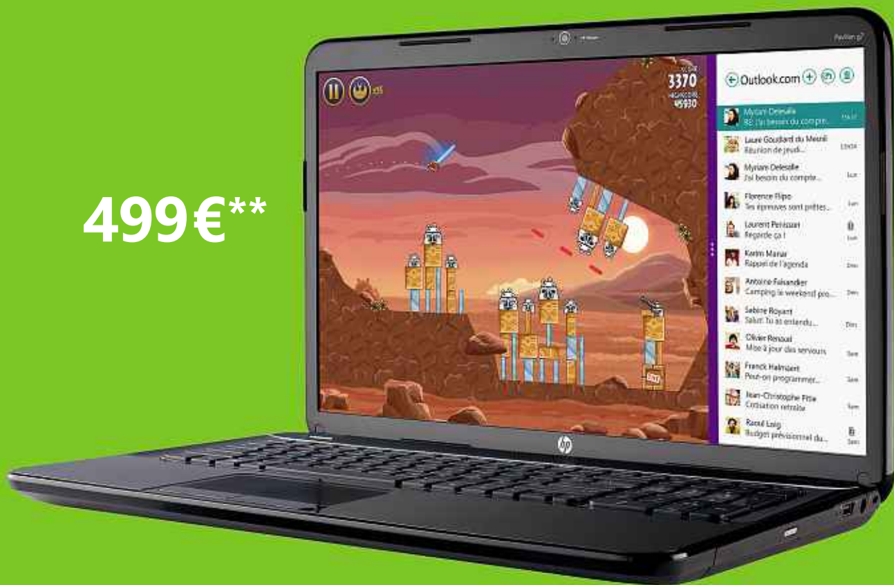
HP Pavilion G7-2242