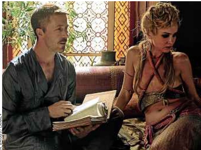
Les scènes de sexe ont plus d'importance à l'écran que sur papier.