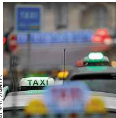
La manifestation sera nationale.

« L a sécu nous tue ». Les syndicats de taxis appellent ce jeudi à manifester dans toute la France pour protester contre une nouvelle mesure législative concernant l'organisation et le financement du transport médical. A Lille, 150 à 200 taxis se donnent rendez-vous place de la République, à 10 h, pour une opération escargot jusqu'à l'Agence régionale de santé (ARS), non loin des gares.