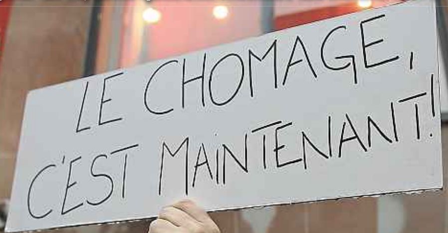
Devant le magasin Virgin Mégastore de Strasbourg, le 9 janvier.

Les partenaires sociaux reprennent ce jeudi les négociations sur la sécurisation de l'emploi. Priorité du président Hollande pour 2013, cette question mobilise les ministres. P.6