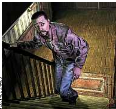
Lee Everett, héros de « The Walking Dead », est suspecté de meurtre.

Le studio américain a choisi de diffuser « The Walking Dead » de manière originale, comme une série, en le proposant en cinq épisodes à télécharger, sur iPhone et iPad, mais aussi sur PC, et consoles de salon PS3 et Xbox 360. Une