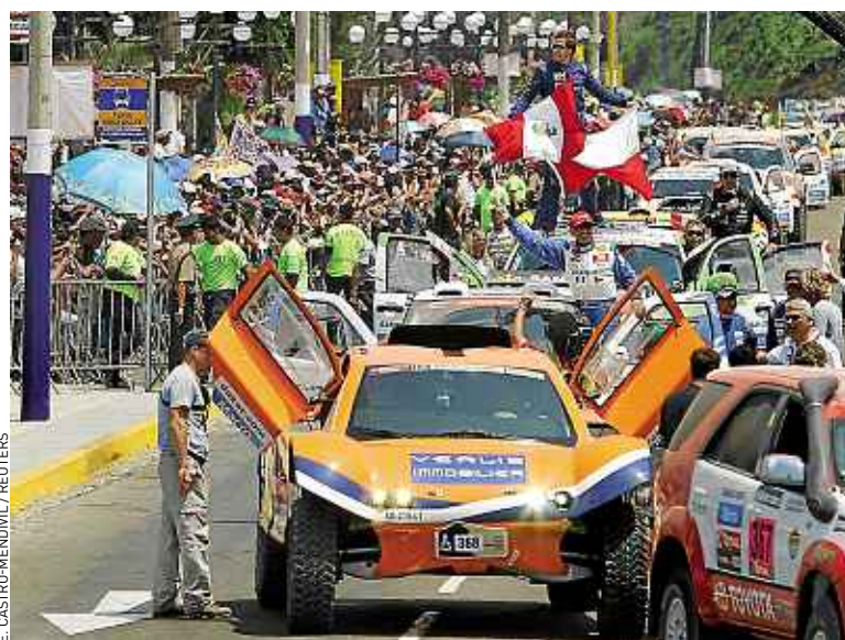
Lors du départ du Dakar 2013, le 5 janvier, à Lima (Pérou).

Pourquoi ces cachotteries ? « Parce que la performance passe par l'innovation, et que chez nous elle n'est pas protégée par des brevets », assure Chicherit. Lui qui a appris sa participation assez tardivement s'est rattrapé artisanalement : « J'ai regardé toutes les vidéos des concurrents, Redbull et X-Raid. Les ai vues 150 fois. » Sur le bivouac, l'espionnage reste donc très amateur. D'une part « parce qu'on n'est pas dans la recherche du millième de seconde