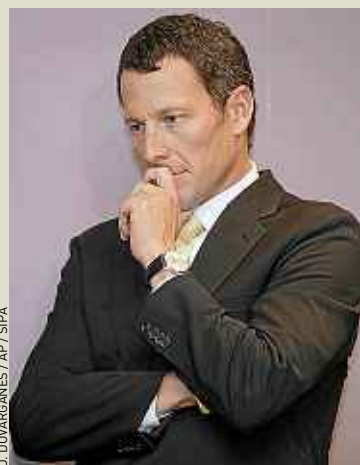
L'Américain Lance Armstrong.

Autre raison avancée pour cette soudaine prise de parole : le poids de ses partenaires. Selon les médias améri-