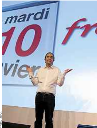
Plus de 4,4 millions de Français se sont abonnés au nouvel opérateur.

Un an plus tard, pari réussi : Free a déjà attiré plus de 4,4 millions de clients et ses tarifs « révolutionnaires » ne surprennent plus personne. Pour stopper l'hémorragie, ses concurrents ont dû casser leurs tarifs, mais aussi accélérer le développement de leurs offres low-cost. Cette mue à marche forcée leur a permis de stabiliser leur parc dès l'au-