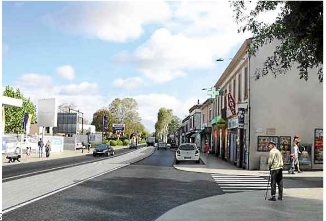
L'une des hypothèses est de faire passer le bus sur la voie centrale de l'avenue de Lardenne.