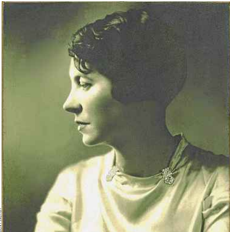
Caroline Miller, lauréate du Pulitzer en 1934 pour Les Saisons et les Jours .

VINTAGE Une nouvelle collection chez Belfond