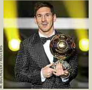
M. BULHOZER / REUTERS