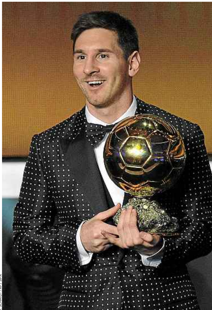
Lionel Messi a devancé dans les votes Cristiano Ronaldo et Andres Iniesta.