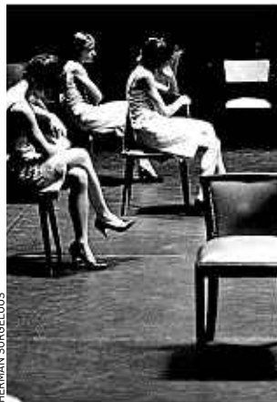
La pièce Elena's Aria .

Un plateau nu, quelques chaises et cinq filles qui malgré leurs gesticulations nous plongent dans un quotidien bien réel. Les mots de Tolstoï chevauchent les envolées de Mozart et Donizetti. On com-