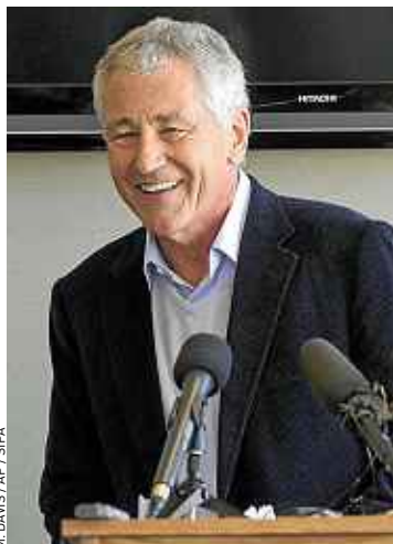
Chuck Hagel, le 1 er novembre.

Défense - le chef du Pentagone au début du premier mandat d'Obama était Robert Gates, lui aussi républicain. Le président américain a par ailleurs nommé son conseiller pour la lutte antiterroriste John Brennan à la tête de la CIA. Il succédera au général David Petraeus, qui avait dû démissionner en novembre après la révélation d'une liaison extraconjugale. ■