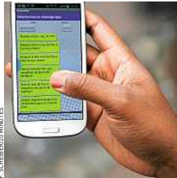
Deeminder existe sur Android.