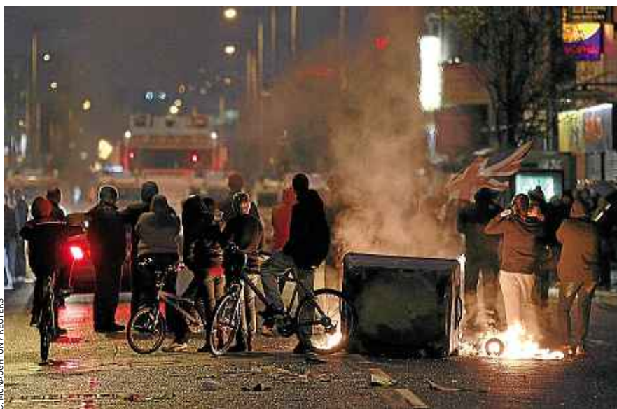
Plusieurs dizaines de policiers ont été blessés depuis la reprise des manifestations, jeudi.

La suppression de l'Union Jack a suscité la colère de certains unionistes protestants qui défendent le maintien de l'Irlande du Nord au sein du Royaume-Uni. En décembre, des manifestations ont déjà fait plus de 40 blessés parmi les policiers. Depuis jeudi, plusieurs dizaines d'entre eux ont été touchés. Selon les forces de l'ordre, soixante-dix interpellations ont été opérées, dont celle, samedi, d'un homme de 38 ans soupçonné de tentative de meurtre.