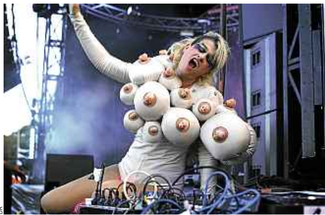
Peaches fait partie du mouvement féministe des Riot Grrrl.

Si si, la femme est l'avenir de l'homme. La preuve avec cette soirée « Diverses, Féminités », où les filles sont à l'honneur. Celles qui aiment tanguer entre le trash et la sensualité, le rock et la soul vont être servies. En tête d'affiche, Peaches, icône des Riot grrrl qui va venir vous jeter à la figure son électro-rock anti-macho. Ou en-