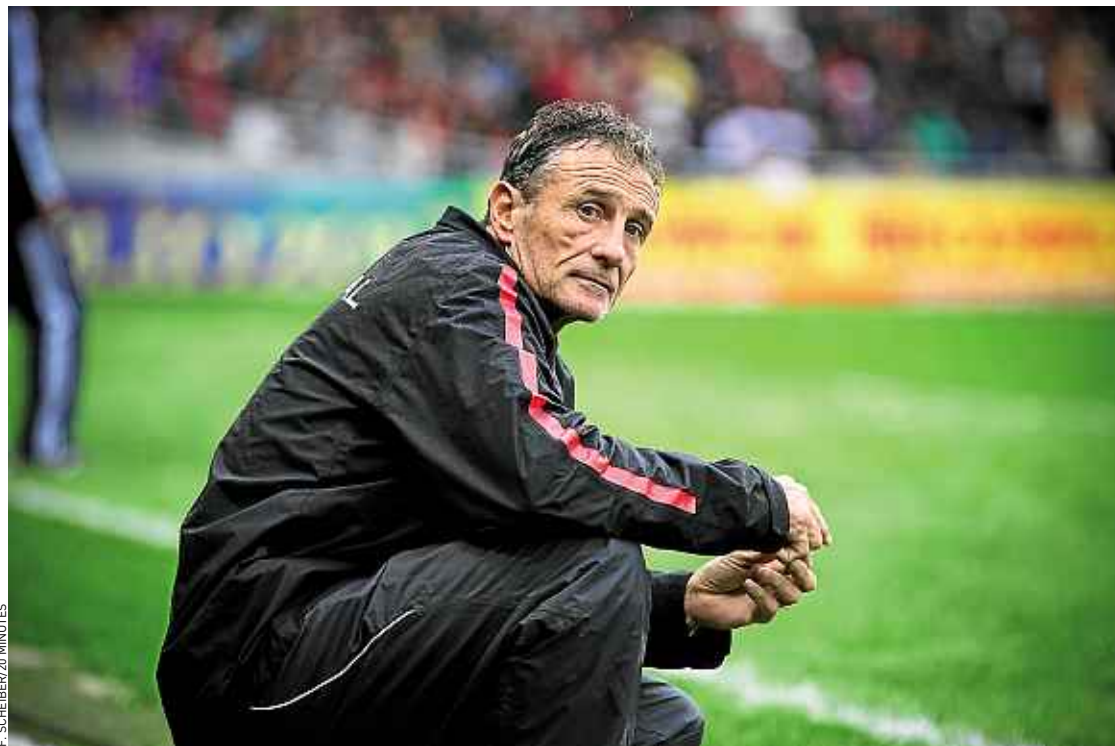
Guy Novès vise une victoire avec bonus contre Trévise puis un succès à Leicester pour atteindre un quart européen.

Il va falloir changer notre fusil d'épaule sur le plan du contenu et du jeu, c'est évident. On ne peut pas décevantement se contenter de ce qu'on fait actuellement. Nous nous satisfaisons de deux vic-