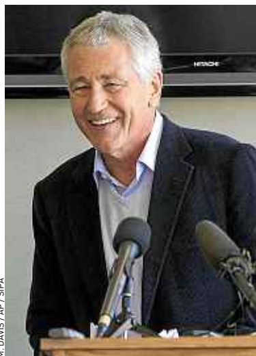
Chuck Hagel, le 1 er novembre.

Défense - le chef du Pentagone au début du premier mandat d'Obama était Robert Gates, lui aussi républicain. Le président américain a par ailleurs nommé son conseiller pour la lutte antiterroriste John Brennan à la tête de la CIA. Il succédera au général David Petraeus, qui avait dû démissionner en novembre après la révélation d'une liaison extraconjugale. ■