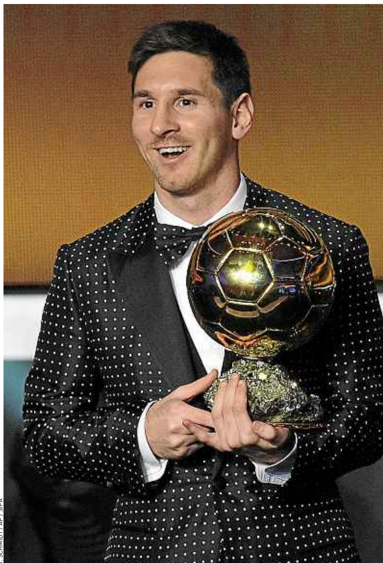
Lionel Messi a devancé dans les votes Cristiano Ronaldo et Andres Iniesta.