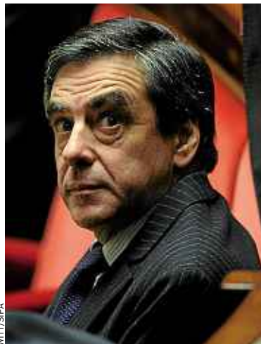
François Fillon brigue des postes stratégiques pour ses soutiens.

D e retour de la trêve des confiseurs, les dirigeants de l'UMP ont-ils enfin digéré la crise intestine ? Mardi, en fin de matinée, Jean-François Copé et François Fillon se rencontrent une nouvelle fois. L'objectif est de finaliser les modalités de mise en place de l'accord conclu le 17 décembre et qui avait permis une trêve après un mois de guerre interne. Principal point de divergence entre les deux camps : les contours de la nouvelle équipe collégiale intégrant « toutes les sensibilités » envisagée par ce document. « L'accord est très clair sur ce point. Pour le bon déroulement de la future campagne qui va arriver très vite, il serait contre-productif politiquement de ne pas le respecter », détaille le député filloniste Jérôme Chartier. Les deux camps se sont d'ores et déjà mis d'accord pour Laurent Wauquiez et Valérie Pécresse, partisans de Fillon, deviennent respectivement « vice-