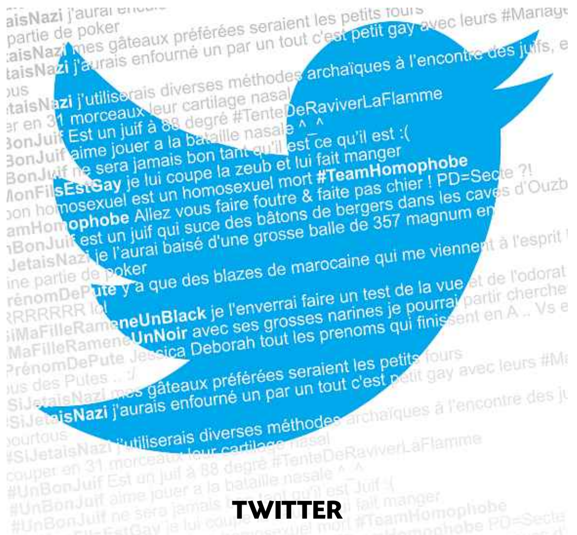
MONTAGE 20 MINUTES

Quatrième nuit de violences à Belfast P.7