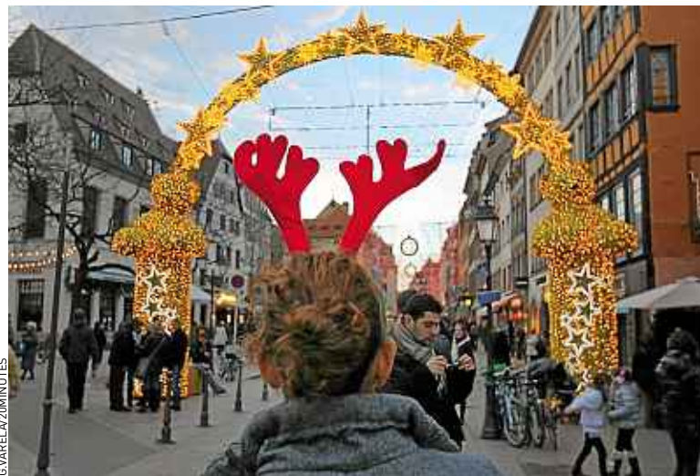
Les touristes consomment toujours, mais un peu moins qu'avant.

La crise se traduit en revanche par une plus grande vigilance sur les dépenses, qui s'élevaient en moyenne à 50 € pour les visiteurs à la journée et entre 150 et 200 € pour les touristes qui séjournent dans un hôtel. « Les commerces de luxe vendent comme avant, ce sont plutôt les