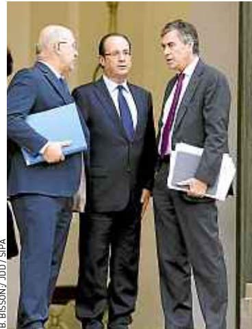
Michel Sapin, François Hollande et Jérôme Cahuzac, vendredi.