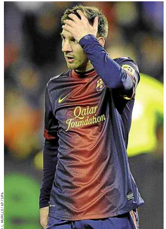
En 2012, Leo Messi n'a gagné qu'un trophée : la Coupe du Roi.

Suivez en live comme-à-la-maison la cérémonie d'attribution du Ballon d'Or , promis à Lionel Messi, à partir de 18 h.