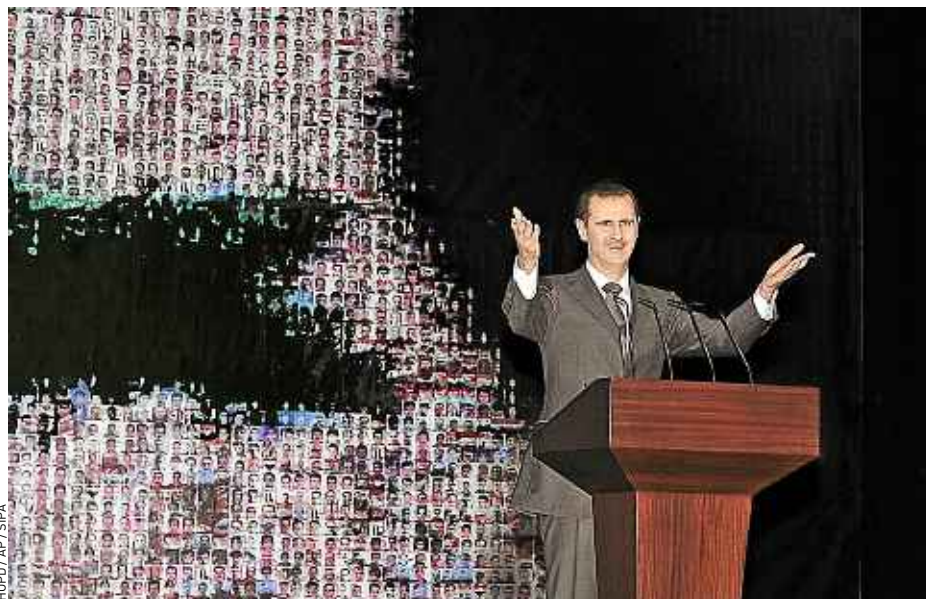
C'est dans la Maison de la culture et des arts, à Damas, qu'Al-Assad a dévoilé son « plan de paix ».

Bachar al-Assad a aussi esquissé ce qu'il a présenté comme un « plan de paix » – aussitôt rejeté par l'opposition – pour mettre fin au soulèvement contre son régime. Cette nouvelle initiative, comprenant une conférence de réconciliation excluant « ceux qui ont trahi la Syrie », ne contient aucune concession et ne fait que recycler des propositions déjà rejetées par ses adversaires