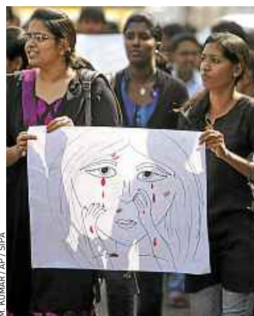
Des Indiennes ont rendu hommage à la victime, vendredi, à Hyderabad.

vie privée, dans une société où la stigmatisation liée au viol peut être dévastatrice. Mais des voix s'élèvent pour demander la révélation du nom des victimes. Six hommes, dont un mineur, ont été arrêtés dans le cadre de l'enquête. Les cinq agresseurs majeurs ont été inculpés jeudi de viol et de meurtre. Le sixième sera jugé par un tribunal pour enfants. Ils seront tous présentés ce lundi devant un juge de New Delhi. ■