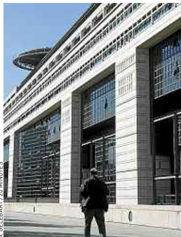
A. GELEBART / 20 MINUTES

Si, en 1993, les Français détenaient 68 % de la dette publique, ils en possèdent désormais 34 %. Le reste – 66 % – appartient donc à des investisseurs étrangers. A titre de comparaison, les Américains possèdent 46 % de leur dette, les Anglais, 69 %, et les Japonais, 94 %. Mais pourquoi renationaliser ? Tout simplement pour prévenir un éventuel désintérêt des ressortissants étrangers pour notre dette, voire un retrait massif de leurs capitaux en cas de crise – c'est ce que vit l'Espagne actuellement. La