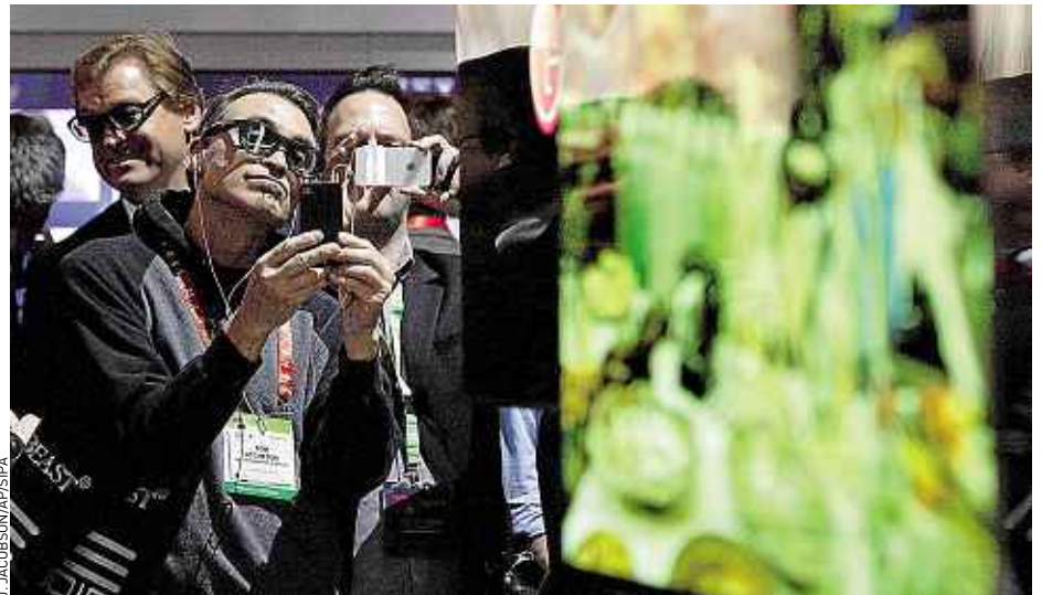
Les téléviseurs Oled, présentés l'an dernier, restent encore au stade de prototypes en 2013.

► Les appareils photo hybrides. Ces appareils « sans miroir », avec le corps d'un compact mais des objectifs interchangeables, arrivent à maturité et les nouveautés devraient pleuvoir, surtout dans la gamme de 500 à 1 500 €. Sony a frappé fort à la fin 2012 avec le RX1 avec un capteur photo « full frame » (plein for-