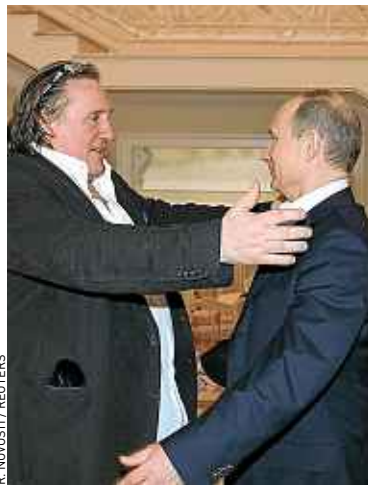
Gérard Depardieu a été reçu par Vladimir Poutine, samedi à Sotchi.

Valérie Pécresse, qui l'a précédé à Bercy, a regretté dans Le JDD de « voir la France devenir la risée du monde ». Gérard Depardieu, qui a choisi l'exil fiscal en Belgique pour protester contre la politique à l'égard des hauts revenus, avait annoncé en décembre qu'il rendait son passeport français après les critiques du Premier ministre, qui avait utilisé le terme de « minable ». ■