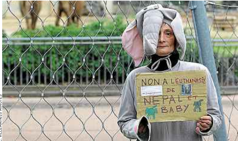
Dimanche, 120 personnes se sont réunies devant le parc de la Tête d'Or à Lyon.