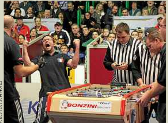
La France a vaincu les Etats-Unis, favoris, en finale.