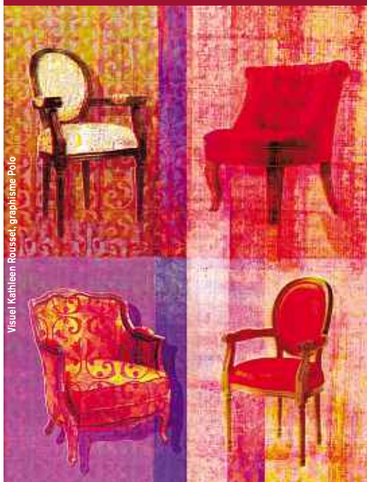
Visuel : Kathieen Rousset, graphisme Polo