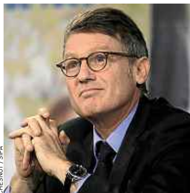
Vincent Peillon, lundi à Paris.

Véritable scoop ou propos tenus dans la précipitation? Le ministre de l'Éducation, Vincent Peillon, a indiqué lundi sur BFMTV qu'il était prêt à ouvrir en janvier une « grande négociation » sur le métier d'enseignant, incluant leurs missions, leurs horaires et leur rémunération. « La conséquence d'une discussion sur le métier est évidemment une question salariale, mais c'est d'abord une discussion sur le métier », a-t-il précisé.