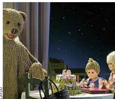
Ce mois-ci, Nounours fête ses 50 ans.