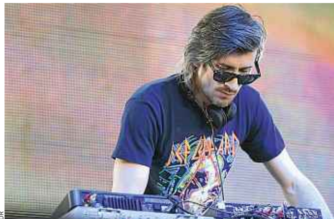
Le DJ français Kavinsky à l'affiche vendredi soir à la Coop.

C'est en plein cœur du quartier dépouillé du Port du Rhin, à quelques mètres de la frontière allemande et du port autonome, que se dresse l'ancienne cave à vins de la Coop. 14 000 m 2 d'espace privé vide répartis sur quatre niveaux. Outre les installations habillant les étages, ce sont les dancefloors du rez-de-chaussée qui feront sensation avec une affiche de haut vol. Vendredi, l'un des géants de la première génération de la French Touch , Etienne