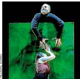
Au Bois Lacté est donné au TNS.

Dylan Thomas voulait réaffirmer la beauté du monde après Hiroshima. Ce Gallois écrit donc un texte destiné à devenir une pièce radiophonique. Au Bois Lacté est diffusée en 1954. On partage vingt-quatre heures du quotidien des habitants du village de Laugharne, où Thomas vécut les dernières années de sa vie. S'y côtoient une cinquantaine de personnages joués par neuf comédiens sur un plateau en bois rappelant un pub où la bière coule à flots. ■