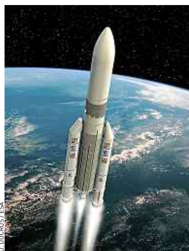
L'Ariane 5 « middle evolution ».

La région Midi-Pyrénées concentre plus de 50 % des effectifs salariés français du spatial, dont les 1700 employés du site toulousain du Cnes. Quelque 3600 personnes travaillent sur les deux sites d'Astrium, où, au cours des trente dernières années, 100 satellites ont été réalisés. Thales Alenia Space emploie de son côté 2500 salariés. Au total, 360 établissements de Midi-Pyrénées travaillent pour le domaine du spatial.