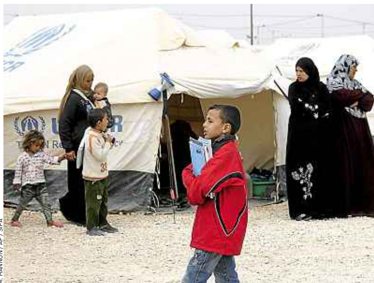
Dans le camp de réfugiés de Za'atari, en Jordanie, le 27 novembre.

Une école a été ouverte le 1 er octobre dans le camp, où 4 500 enfants sont inscrits. « Tous les réfugiés ont envie de repartir en Syrie », assure Dominique Hyde. Reste à savoir quand. Quelque 8 000 réfugiés du camp ont déjà tenté de revenir, en vain. Ils n'ont pas pu repasser la frontière. ■