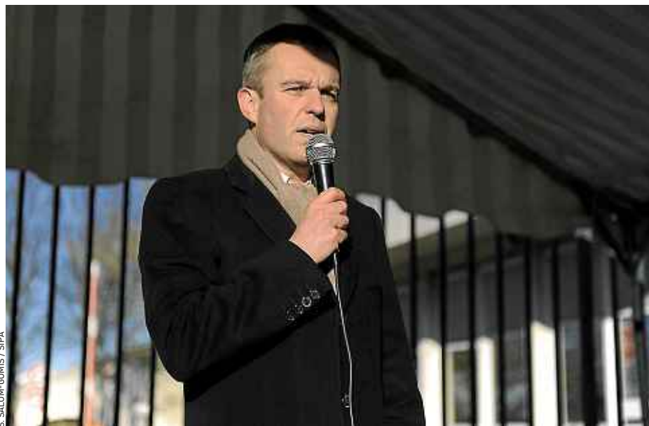
François de Rugy, vice-président du groupe EELV à l'Assemblée nationale, le 29 novembre.

tains dans la majorité évoquent déjà les autres technologies possibles d'extraction et entretiennent l'ambiguïté », explique François de Rugy. Le vice-président du groupe écolo à l'Assemblée cite le nom d'Arnaud Montebourg, qui a évoqué dans les colonnes de L'Expansion « ces technologies propres qui permettraient d'extraire sans abîmer ». L'ancien Premier ministre Michel Rocard a lui décrit « une France bénie des dieux » grâce à ses réserves. Défiance logique ou paranoïa des Verts ? Si l'ensemble des députés PS est contre l'extraction du gaz de schiste par fracturation, une technologie lourde de conséquences pour l'environnement, nombreux