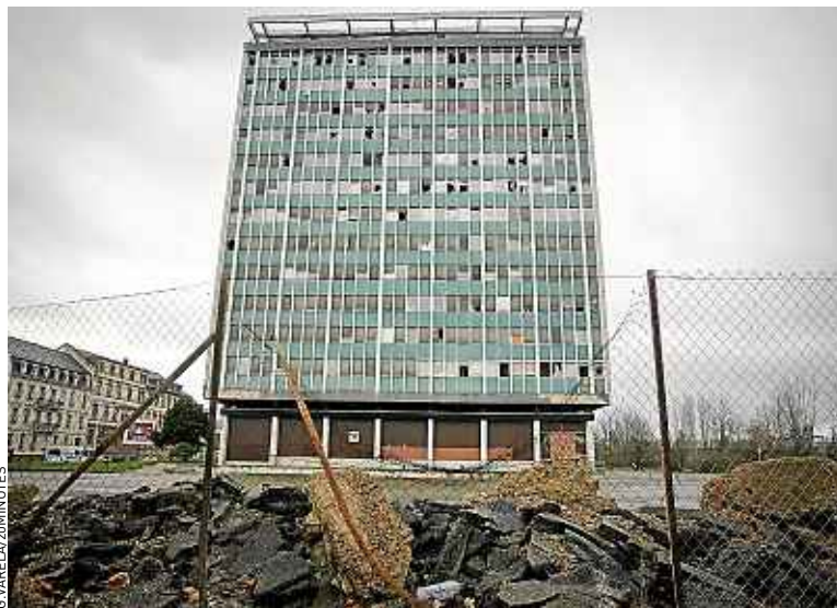
Aucune date n'est avancée pour le début du chantier.

cette verrue », poursuit-il. Comme les choses traînent en longueur, la ville a revu ses plans. Le parking, situé au pied de la Maison du bâtiment (et qui lui appartient) devait initialement être utilisé pour par le programme immobilier.