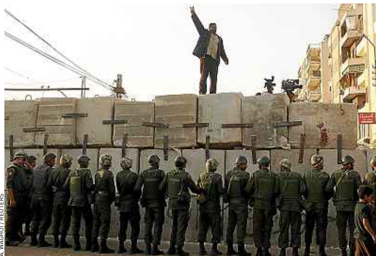
Un manifestant sur une barrière autour du palais présidentiel, dimanche.

Les opposants, qui accusent les Frères musulmans, dont est issu Mohamed Morsi, de vouloir imposer un carcan religieux à la société égyptienne, ont mis en garde contre le risque d'une « violente confrontation ». Parmi les