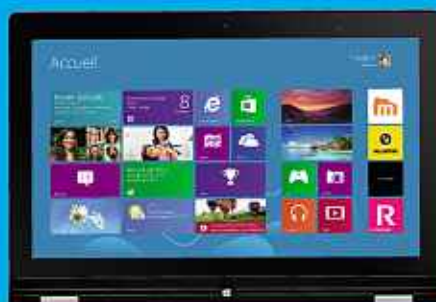
Lenovo IdeaPad Yoga 13