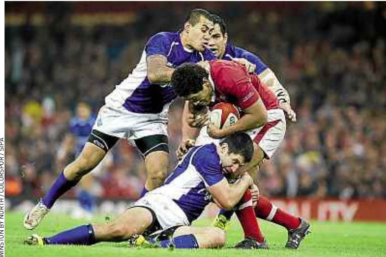
Les Samoans ont découpé les Gallois (26-19) le week-end dernier.

« C'est leur marque de fabrique, un peu comme le French flair chez nous. Il va falloir penser à bien se baisser », reconnaît Yoann Maestri, qui les affrontera samedi avec les Bleus. Le Toulousain a été titularisé par le staff pour ses qualités « de combat au ras ». Ça tombe bien