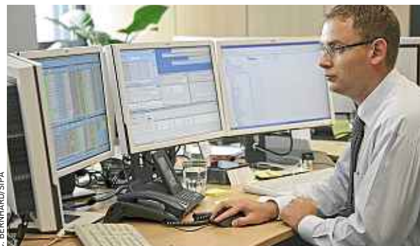
Regroupez vos fichiers personnels dans un dossier identifié.