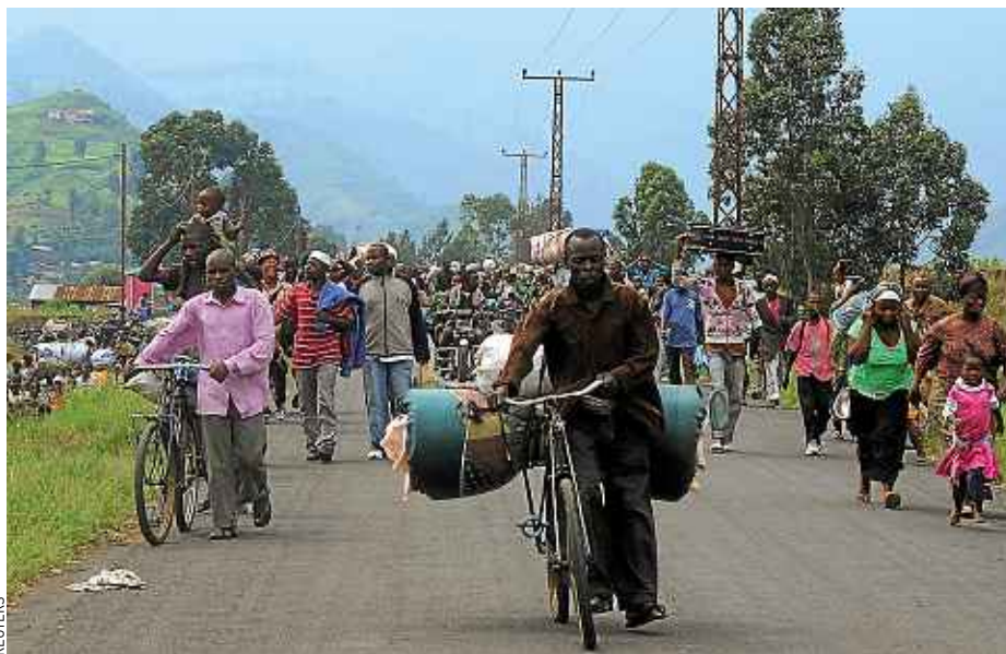
Selon l'ONG Oxfam, 120 000 personnes ont quitté préventivement Goma et ses alentours.

Sur le terrain, les rebelles du M23 – que le Rwanda arme et