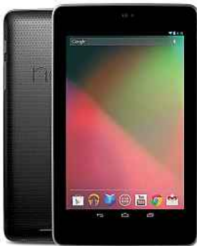
La tablette Nexus 7 se déverrouille par reconnaissance faciale.

► Le prix. Vendu à partir de 339 € (16 Go), le Mini vaut carrément 100 € de plus que la Galaxy Tab2, prix d'entrée de la tablette de Samsung. Le ticket de passage, sans doute, dans le monde d'Apple et ses 275 000 applications déjà compatibles. ■