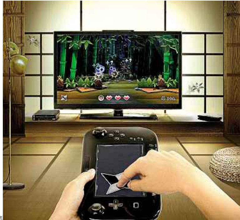
Le GamePad est gyroscopique et doté d'un écran tactile de 6,2 pouces.