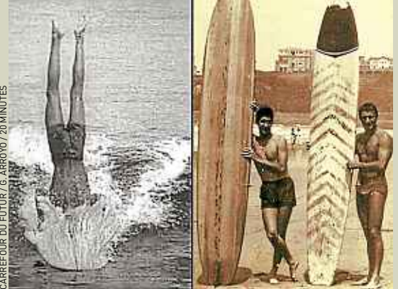
Quelque 1 500 vidéos ont été récoltées par l'INA.