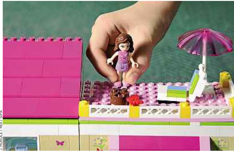
Lego tente d'ouvrir aux filles l'univers de la construction associé aux garçons.

« Il n'y a là rien de militant ou de provocant. On voulait simplement répondre aux attentes de nos clients. Mais on peut