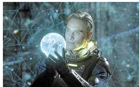
Le robot Nao, créature d'Aldebaran Robotics, la chanteuse Nicki Minaj en femme androïde chez David Guetta, le héros animé Pat Labor et Michael Fassbender dans Prometheus (de gauche à droite et de haut en bas).