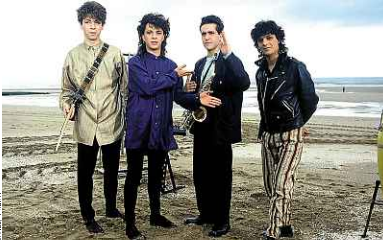
Depuis ses débuts, Indochine livre ses albums à un train de sénateur et Madness sort un nouvel album en forme de référendum, Oui Oui Si Si Ja Ja Da Da .