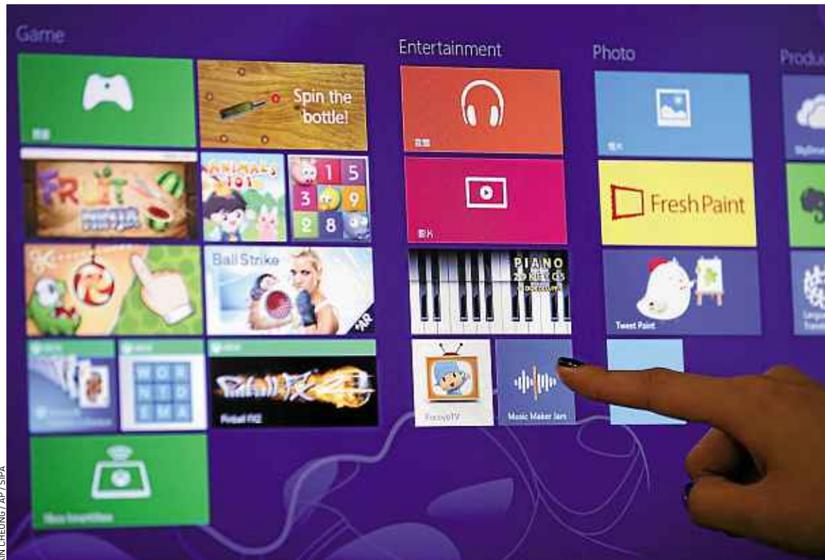
Windows 8 sur PC (photo) ou sur smartphone est un univers uniformisé, avec ces « tuiles » dynamiques.

phones équipés sont ébouriffants. La Rolls en la matière reste le Nokia Lumia 920 qui en fait beaucoup plus avec le NFC intégré, « Here », sa nouvelle plateforme de géolocalisation ou encore « Transports », son appli archiprometteuse pour se déplacer dans les grandes villes.