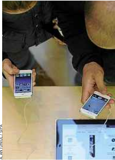
Les smartphones arrivent en tête.