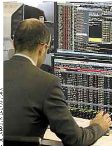
8,5 % des Français détiennent encore des actions, contre 13,8 % en 2008.

En mars, seuls 8,5 % des Français détenaient encore des actions, contre 13,8 % en 2008. « Lorsque la Bourse a connu des envolées, les particuliers se sont laissé tenter, mais quand les bulles ont éclaté, ils ont eu le sentiment de se faire avoir... Les Français veulent des placements sûrs », avance Philippe Crevel, du Cercle des épargnants. Pour Jean-Fran-