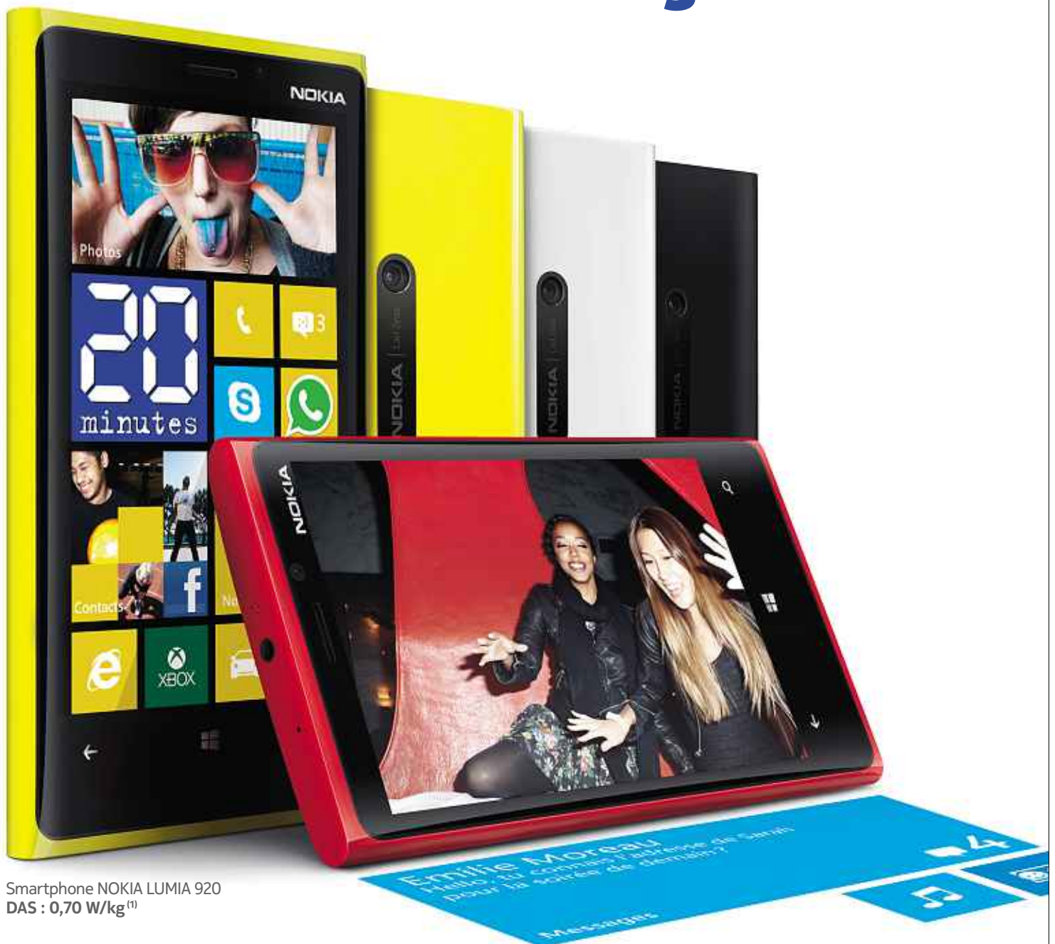
Smartphone NOKIA LUMIA 920 DAS : 0,70 W/kg (1)