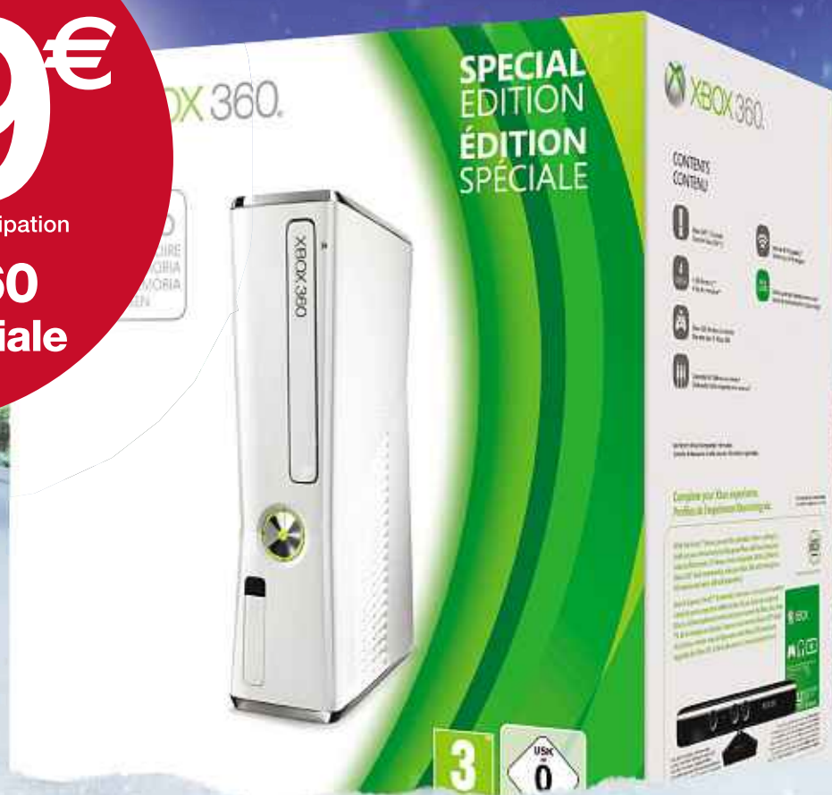
Console XBOX 360 Blanche 4 Go Édition spéciale.

Voir magasins participants sur Carrefour.fr