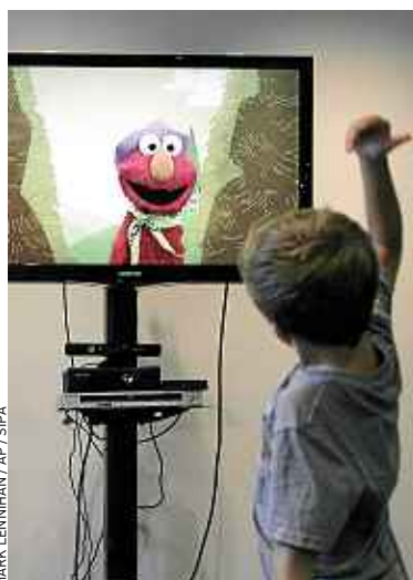
Le contrôle gestuel se développe.

Oui. Il y aura vingt-trois nouveaux jeux qui seront disponibles au moment de sa sortie ( lire ci-dessus ), dont trois seront exclusifs [« Nintendo Land », « New Super Mario Bros U » et « ZombiU »]. Une autre exclusivité, « Rayman Legends », viendra début 2013. ■