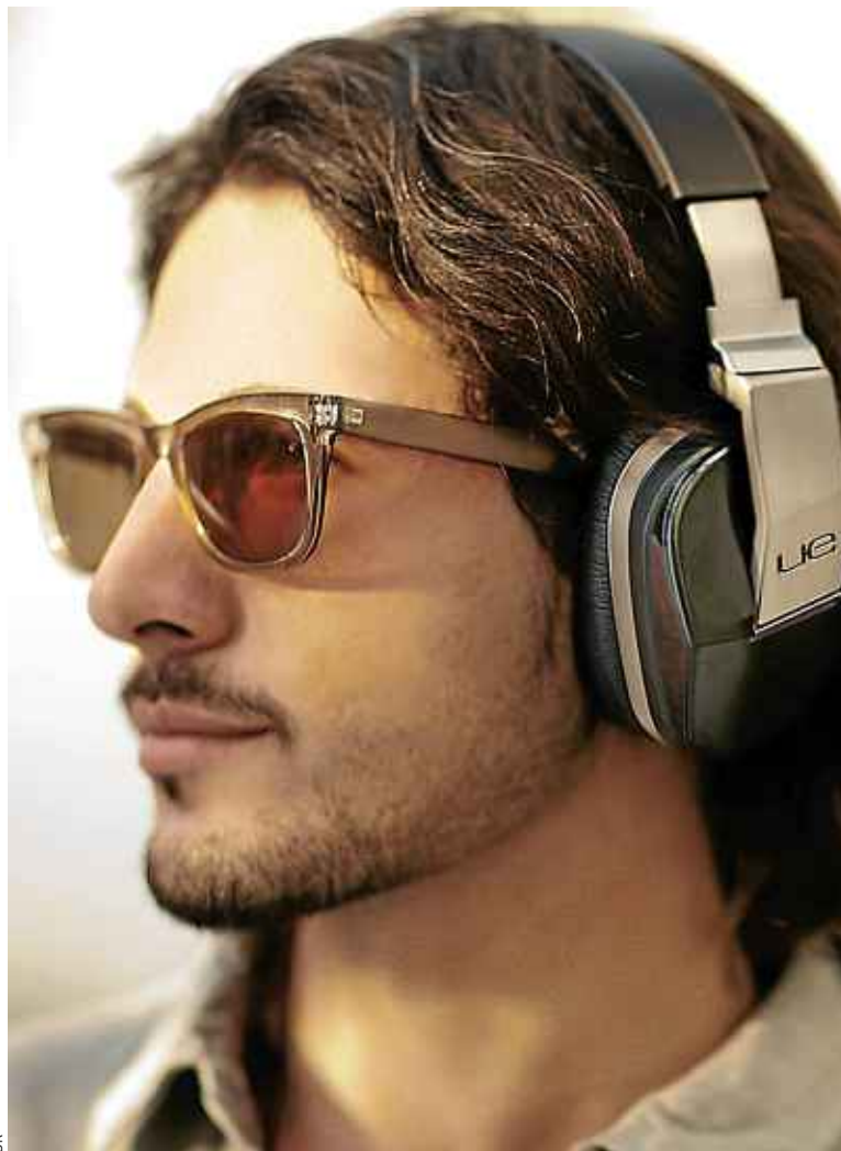
Plus de 500 000 casques sans fil ont été vendus en France depuis janvier.

Certes, à la base, pas de problème de compatibilité: les prises mini-jack sont les mêmes pour tous les lecteurs, mais s'équiper d'un casque sans fil autorise une grande liberté de mouvement... à condition de ne pas se faire arracher son précieux système d'écoute dans les transports en commun, certains modèles, notamment les casques Beats, attirant les convoitises... ■