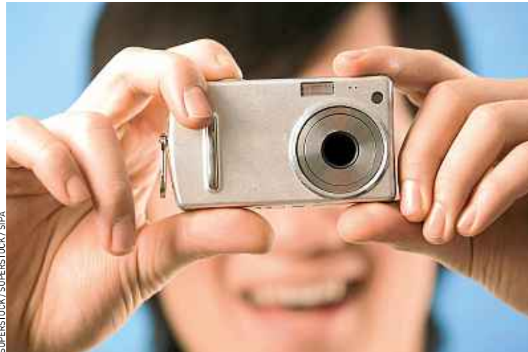
Les compacts les plus récents se dotent de capteurs de plus en plus grands.

Que vous soyez néophyte, souhaitant ne plus limiter votre connaissance de la photographie au mode automatique clic-clac merci et au revoir, ou bien amateur voulant vous délester de votre