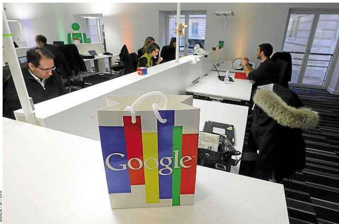
Les ingénieurs français, dont la réputation est excellente, ont décidé Google à renforcer en 2010 son bureau parisien.