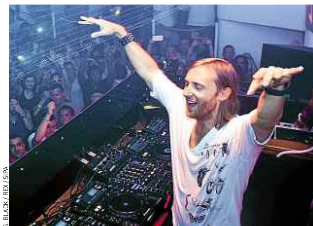
David Guetta, cet été à Ibiza. Et bientôt vous ?

► Le casque DJ branché. A utiliser autant au quotidien avec son micro et sa com-