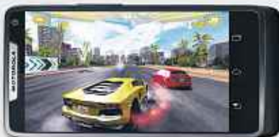
Jeux en plein écran.