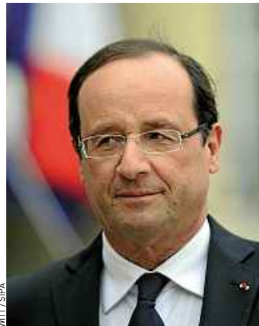
Le chef de l'Etat va devoir trancher.

Sauf qu'entre les patrons qui souhaitent un « choc » pour alléger leurs charges et la gauche du PS rétive à toute augmentation de la TVA ou de la CSG, l'Elysée est pris en tenaille. « Le principe de réalité doit prévaloir maintenant, pas dans trois mois quand le chômage aura encore augmenté de 40 000 personnes. Il y a urgence, les carnets de commandes sont vides », confie un membre de l'Association française des entreprises privées (Afepe). Quatre-vingt-dix-huit de ses membres ont signé une tribune dans le