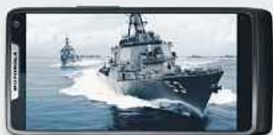
Films en plein écran.