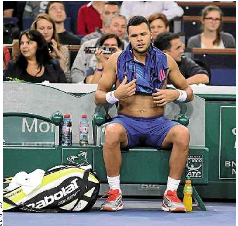
Peu performant à Bercy, Tsonga va devoir remettre le bleu de chauffe.

L'an passé, Tsonga, qui avait pris le parti de beaucoup attaquer sur un revêtement un peu plus rapide qu'à Paris-Bercy, ne s'était incliné que face à Fe-