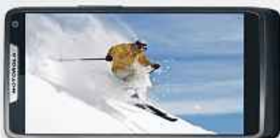
DAS : 0,85 KWg La vie en plein écran.