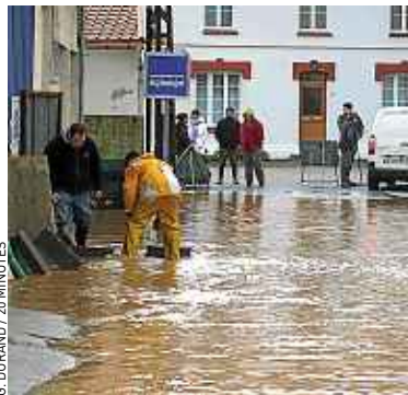
A Cormont (Pas-de-Calais), dimanche.

Devant cette situation, le ministre des Transports et ancien maire de Boulogne-sur-Mer, Frédéric Cuvillier, a rendu visite dimanche aux foyers sinistrés. Il a pu constater que la décrue, entamée samedi, s'est poursuivie, sans aucune intervention des pompiers pour des habitations inondées. Néanmoins, la situation restait préoccupante dans la soirée. « On attend encore 20 mm de pluie dans les prochaines 24 heures », soulignait la préfecture du Pas-de-Ca-