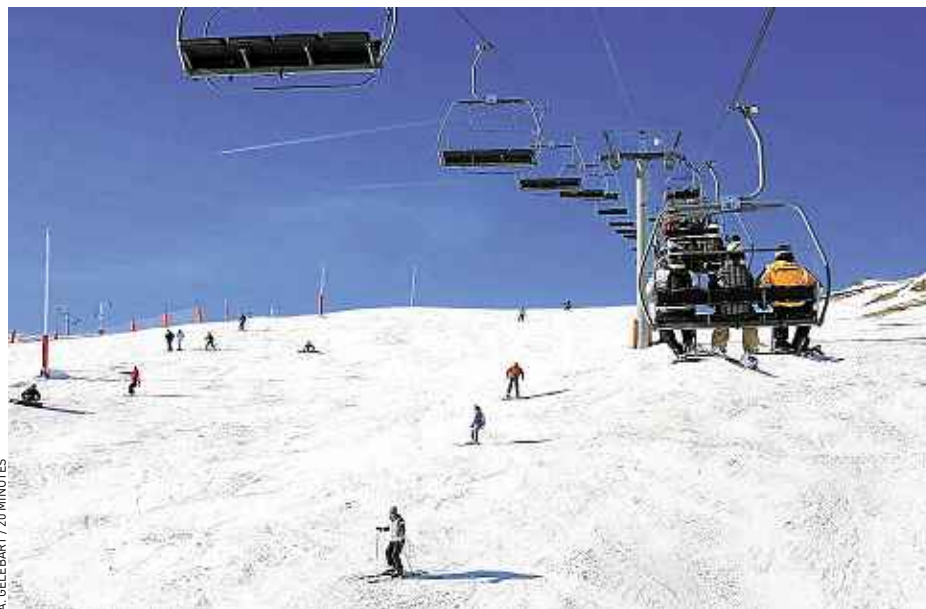
Lors de la saison 2011-2012, environ 55 millions de skieurs ont dévalé les pistes françaises.

« Les promoteurs ont décidé de jouer le jeu du bas prix et ce ne sont pas les seuls. Les magasins de location d'équipement et de matériel de ski