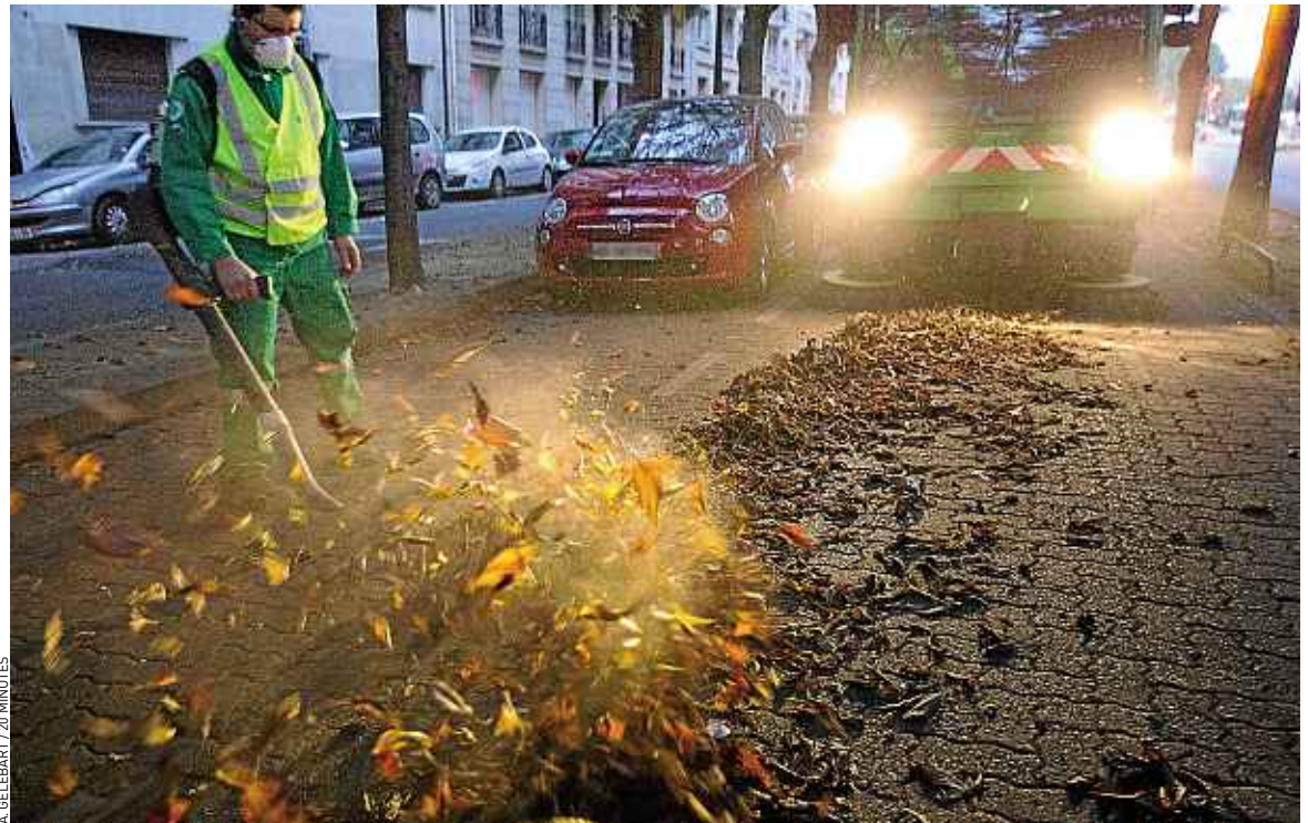
Le service de ramassage des feuilles mortes de Paris œuvre principalement dans les 16 e , 13 e , 7 e et 8 e arrondissements.

Le premier Mondial de la pizza a commencé dimanche au parc Disneyland Paris (Seine-et-Marne) et se poursuit ce lundi. Plus de 500 pizzaiolos venus du monde entier y rivalisent d'adresse, sous le regard d'un jury de professionnels. Outre des démonstrations et des jeux, des ateliers pour enfants sont organisés.