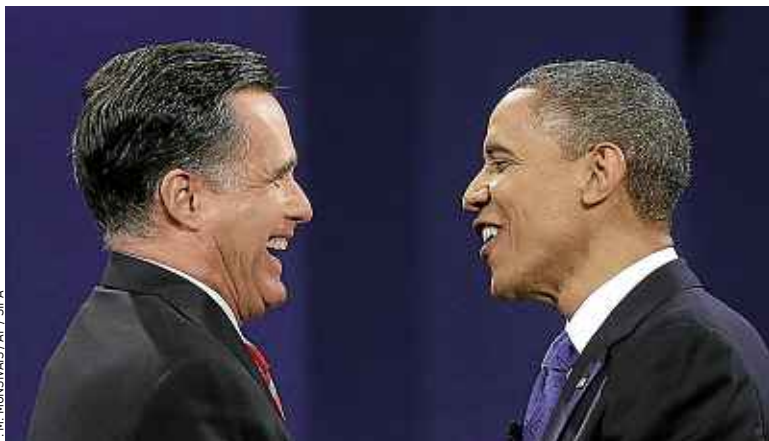
Mitt Romney et Barack Obama sont au coude à coude dans les sondages.