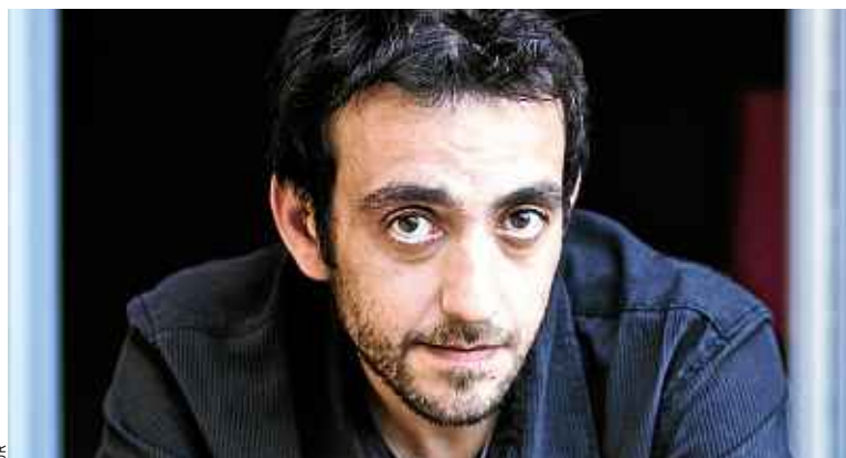
Jérôme Ferrari, auteur de Le Sermon sur la chute de Rome .

En vidéo à la demande sur pluzzvad.francetv.fr