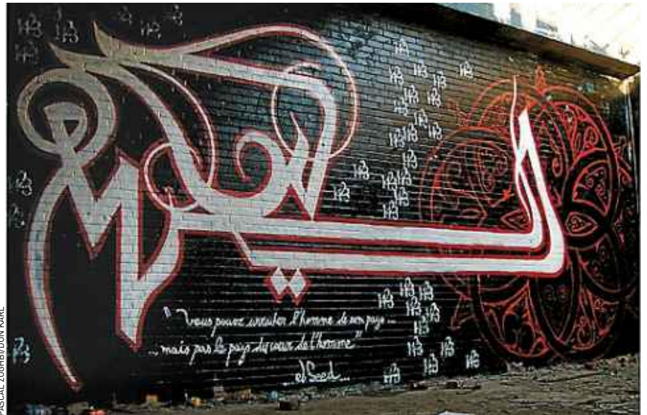
Bled Art, une œuvre réalisée par le Tunisien eL Seed, à Montréal en 2008.

« Jusque récemment, la calligraphie arabe était considérée comme un art mort », note Don Karl. Mais de plus en plus de jeunes se sont emparés de cet art né au VII e siècle, d'abord réservé aux écritures sacrées du Coran, où l'écriture est source de beauté, où l'on apprécie les lettres sans avoir besoin de comprendre le sens des mots. L'artiste eL Seed, 31 ans, refuse