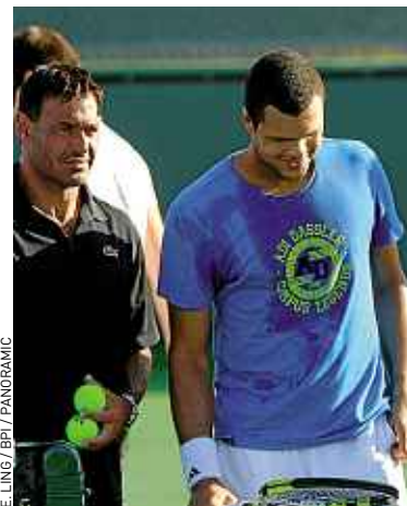
Roger Rasheed et Jo-Wilfried Tsonga.