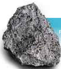
VÉRITABLE PIERRE DE LUNE

L'UNIVERS N'A PAS FINI DE VOUS FAIRE RÊVER !