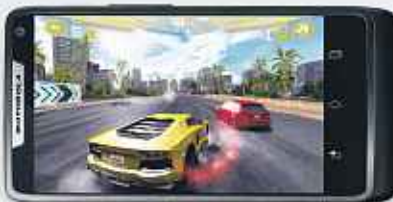
Jeux en plein écran.