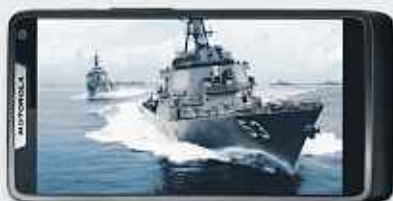
Films en plein écran.