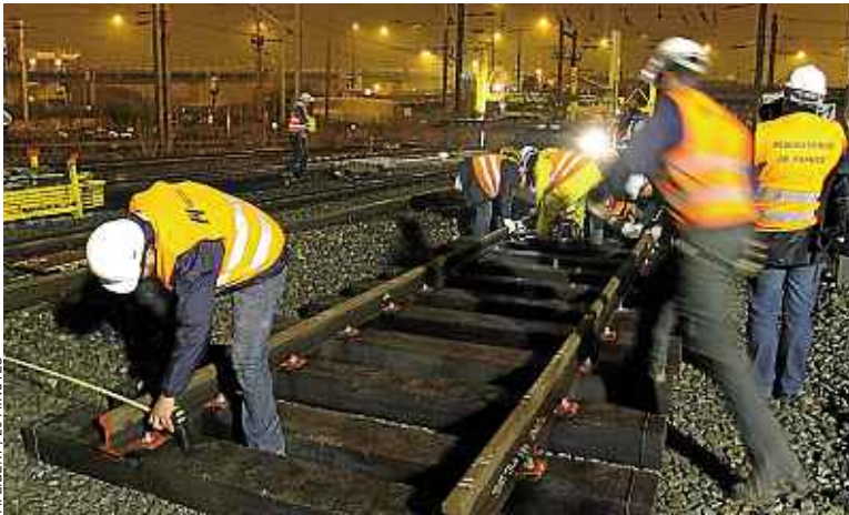
La dette de Réseau ferré de France s'élève à trente milliards d'euros.

RAIL La réforme ferroviaire est présentée ce mardi