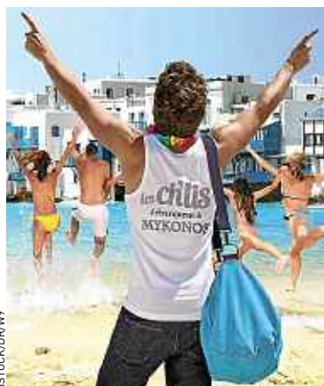
« Les Ch'tis à Mykonos » sur W9.

Un format à la mode, mais obscur. « Ce genre hybride repose sur une structure de fiction et emprunte les codes narratifs du magazine ou de la télé-réalité », note Estelle Boutière, consultante chez NPA Conseil. En général, « l'histoire est écrite par des scénaristes, les scènes sont jouées ». Mais il y a des éléments de réalité : voix off, confessions face caméra, des personnages jouant leur propre rôle. C'est là que la tâche se complique pour le Conseil supérieur de l'Audiovisuel (CSA) : les programmes de