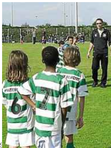
Les éducateurs sportifs veulent en finir avec les incivilités sur le terrain.

Du côté des clubs, le projet a porté ses fruits. « Avant ce regroupement, les