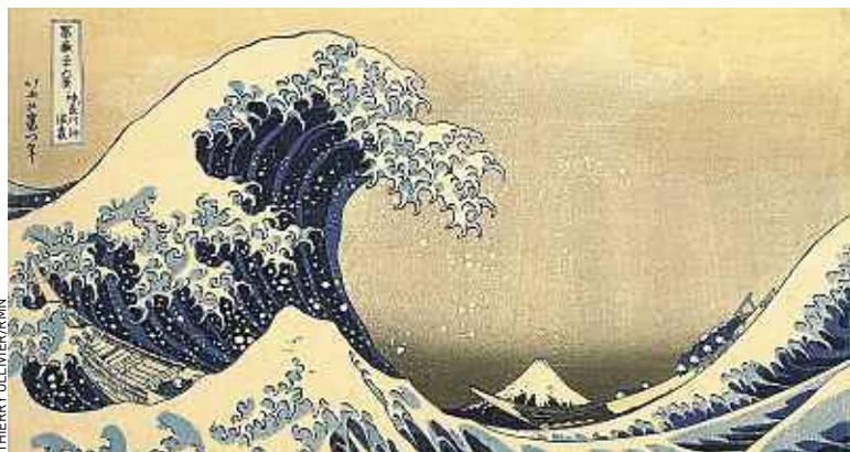
Sous la grande vague au large de la côte à Kanagawa.