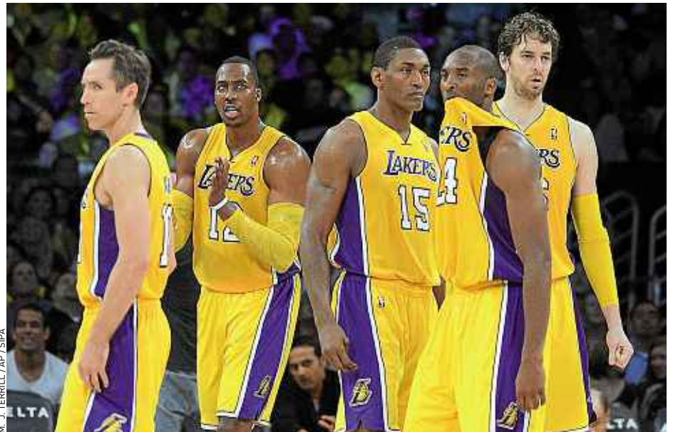
Le cinq majeur des Lakers : Nash, Howard, Metta World Peace, Bryant et Gasol (de g. à dr.).

Tony Parker, Boris Diaw et Nando De Colo, coéquipiers à San Antonio, sont les mieux placés pour succéder à Ronny Turiaf, titré avec Miami. Battus en finale de conférence par Oklahoma City l'année dernière, les Texans font encore une fois partie des favoris pour soulever le trophée. Surtout que TP a récemment déclaré : « Je me sens super bien. Je pense que les trois ou quatre prochaines années vont être le