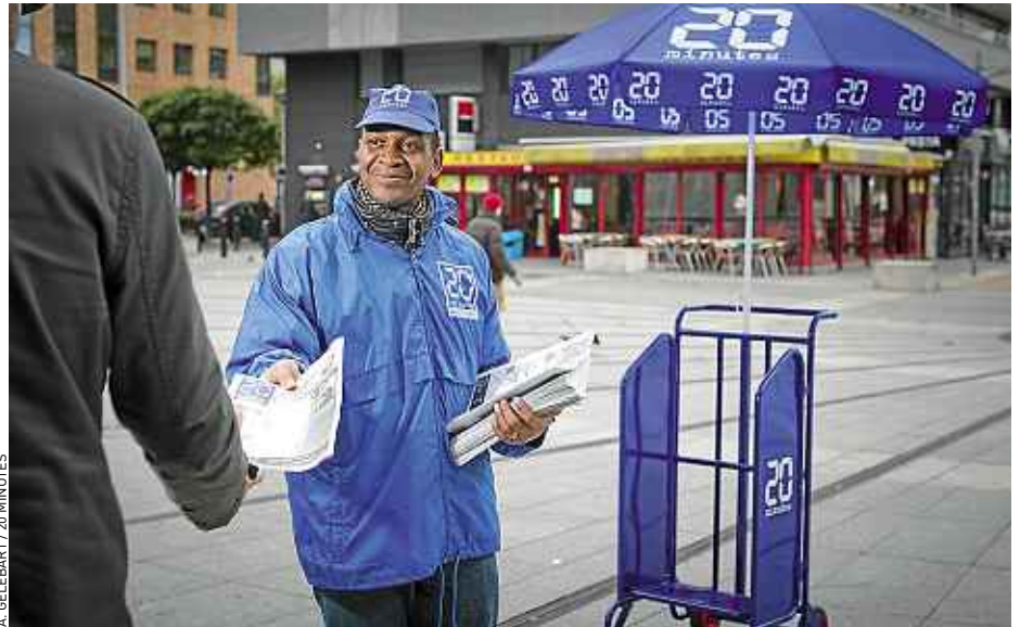
Un colporteur, lundi matin, à la gare RER de Nanterre-Préfecture (Hauts-de-Seine).