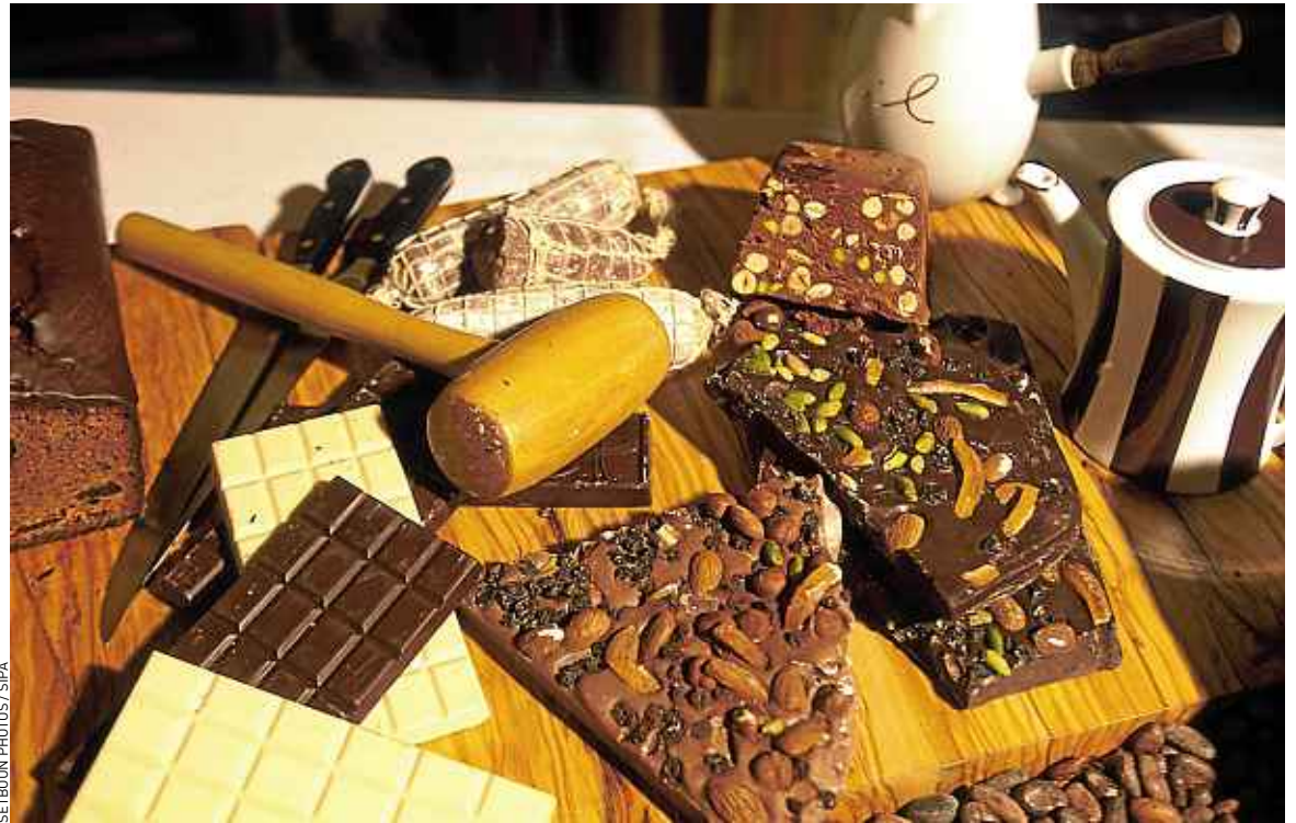
Sérotonine, anandamide... Le chocolat contient « des molécules psychostimulantes qui favorisent le bien-être ».

Selon une étude dévoilée par l'université Westminster à Londres, regarder des films d'horreur ferait maigrir. Les participants à ce test auraient perdu 133 calories après 1 h 30 de visionnage de scènes d'horreur à cause de l'augmentation de leur rythme cardiaque. Précision : l'étude a été commandée par Lovefilm, une entreprise de location de... films.