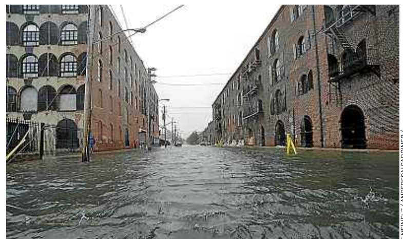
Lundi, alors que Sandy n'était pas encore arrivé, Brooklyn était déjà inondé.

de 75 « bévues » informatiques ont été répertoriées, a précisé Jean-Yves Le Drian, aboutissant à des aberrations dans le règlement des soldes. Trente millions d'euros d'avance de trésorerie vont être mis à disposition par le centre interarmées d'administration de la solde pour faire face à l'ensemble des créances. Une somme « susceptible de recouvrir » le préjudice financier global que le ministère n'est pas en mesure d'estimer précisément. L'extension de Louvois à d'autres corps d'armée est suspendu pendant au moins deux mois. ■ A.S.