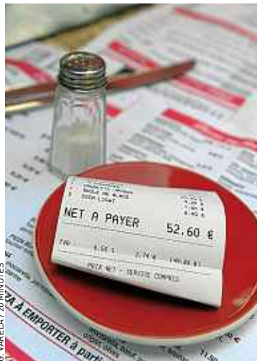
Les prix pourraient augmenter.

Des hypothèses qui ont provoqué l'ire de Didier Chenet, le président du Synhorcat (Syndicat national des hôteliers, restaurateurs, cafetiers et traiteurs). « Le relèvement de la TVA conduirait à un plan social majeur : 100 000 emplois sont en jeu et 12 000 établissements situés en zone rurale pourraient mettre la clé sous la porte », a-t-il indiqué à 20 Minutes . Des