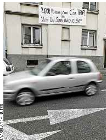
A.I. 2 600 véhicules par jour y passent.

Pendant deux heures, les habitants ont ainsi bloqué la rue. La ville leur a alors accordé le sens unique, qui devrait être mis en place le 22 octobre. Ou la semaine suivante, si la météo venait à perturber le marquage au sol. Mais désormais, les riverains ne sont plus à une semaine près. ■