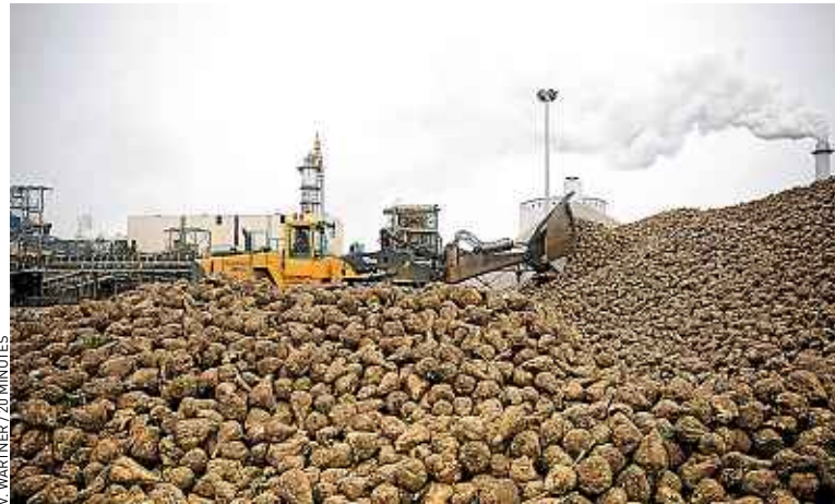
La France compte vingt-cinq sucreries, dont celle de Chevrières (Picardie)

Ici, l'air a une odeur de barbe à papa. Seul cet effluve trahit l'activité du site. Car de l'extérieur, la sucrerie de Chevrières (Picardie) ressemble à une usine lambda. Ses cheminées crachent dans le ciel des colonnes de fumée blanche et les camions se pressent pour venir décharger l'or local : la betterave. Pas la petite rouge que l'on consomme en salade. Celle-ci, plus grosse et blanche, sert à produire du sucre.