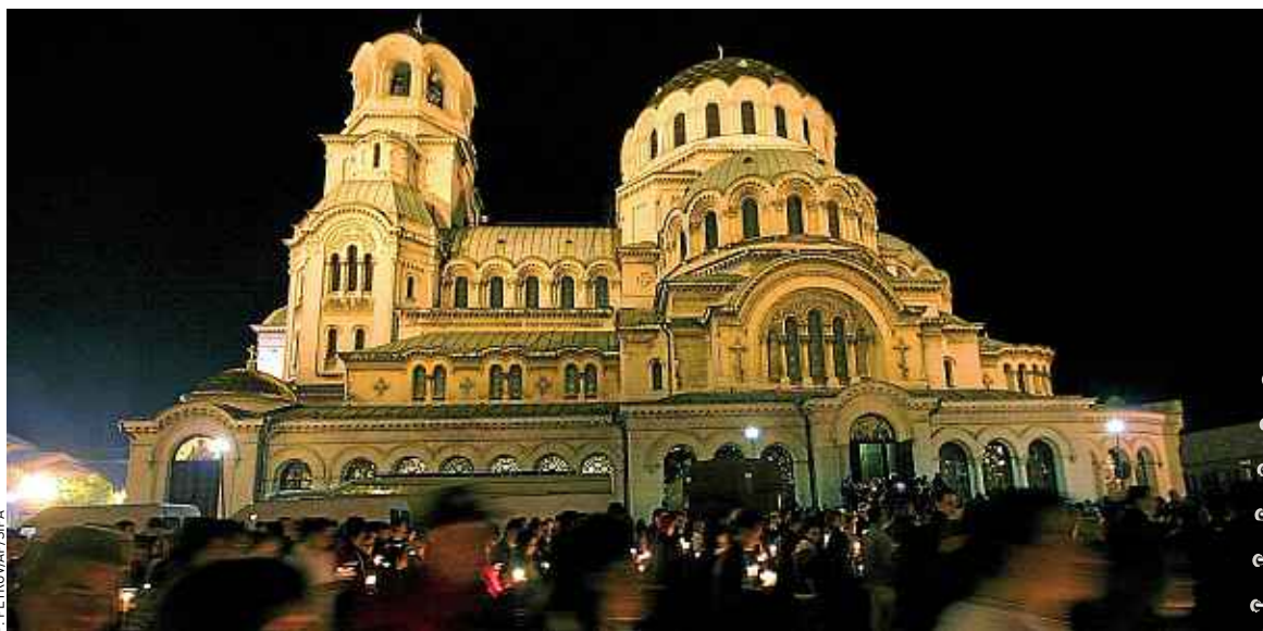
La cathédrale orthodoxe Alexandre-Nevski et son dôme doré de 50 m de haut dominent la ville.