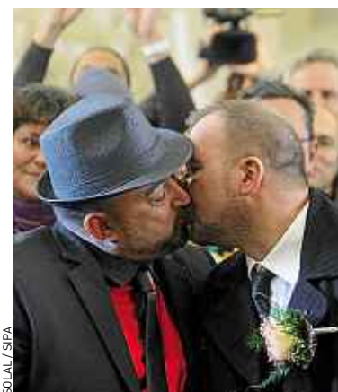
Le projet de loi sera bien présenté le 31 octobre en Conseil des ministres.