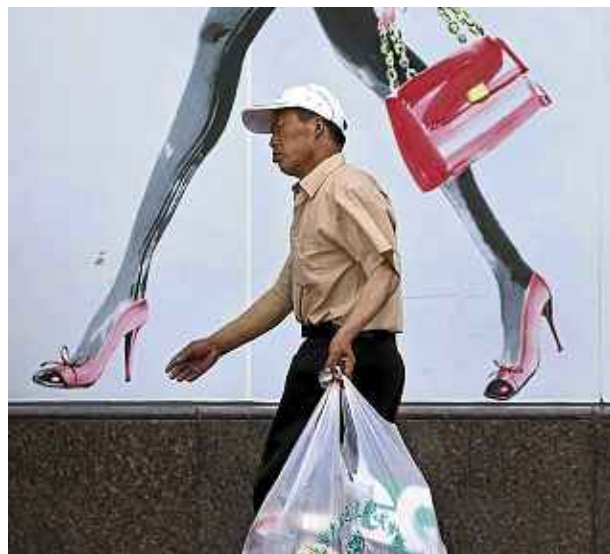
En 2030, il pourrait y avoir 40 millions d'hommes célibataires.