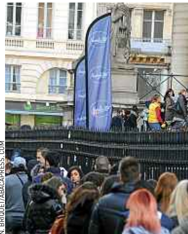
Au tour de Paris d'accueillir les auditions de « Nouvelle Star ».