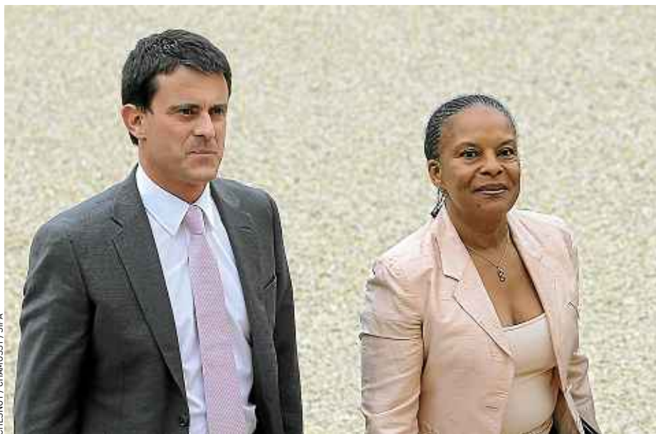
Valls et Taubira étaient arrivés ensemble au premier Conseil des ministres en mai dernier.

Mais derrière la photo des mariés, les crispations au sein de leur ministère sont toujours présentes. Les policiers attendent une contrepartie à la discrétion de leur ministre sur les décisions de justice. L'absence de Christiane Taubira, alors qu'elle était invitée aux congrès