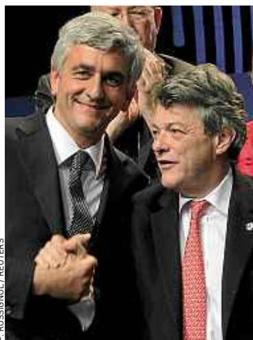
Jean-Louis Borloo (à dr.) et Hervé Morin en mai 2011 à Paris.

Au contraire du MoDem de François Bayrou, l'UDI ambitionne de devenir une machine à gagner des élus. Et d'abord, aux municipales. Dans le viseur de la formation, des villes moyennes de province comme Caen, Laval, Angers, Amiens... Des communes pour lesquelles les centristes espèrent bénéfi-