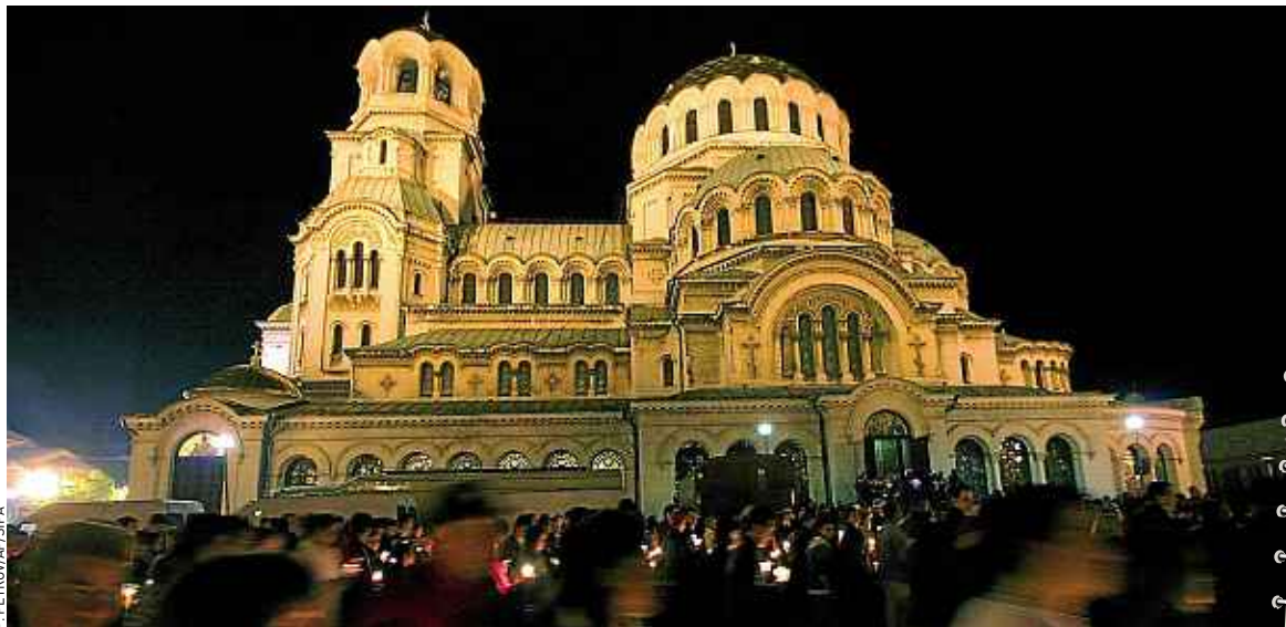
La cathédrale orthodoxe Alexandre-Nevski et son dôme doré de 50 m de haut dominant la ville.