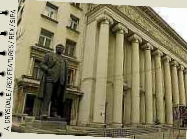
A lire : Guide du Routard, « Roumanie, Bulgarie 2012 »

Fondé en 1959, c'est le doyen des clubs bulgares et le premier à s'être consacré à la musique électro. Il accueille toujours de grands DJ internationaux et bulgares. Intérieur plutôt sympa avec, d'un côté, la salle des concerts (ouverte seulement le week-end) et, de l'autre, le bar style « 2001 : l'odyssée de l'espace ». L'été, grande terrasse sur le boulevard. 20, bd Tsar Obsvoboditel, Sofia. www.yaltaclub.com .