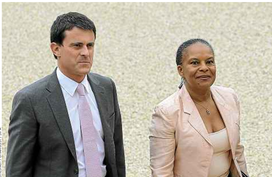
Valls et Taubira étaient arrivés ensemble au premier Conseil des ministres en mai dernier.

Mais derrière la photo des mariés, les crispations au sein de leur ministère sont toujours présentes. Les policiers attendent une contrepartie à la discrétion de leur ministre sur les décisions de justice. L'absence de Christiane Taubira, alors qu'elle était invitée aux congrès