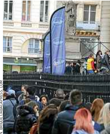
Au tour de Paris d'accueillir les auditions de « Nouvelle Star ».