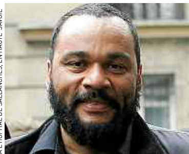
À L'HÔPITAL DE SALLANCHES, EN HAUTE-SAVOIE

Poursuivi par le fisc pour ne pas avoir payé l'intégralité de ses impôts depuis quinze ans, l'humoriste Dieudonné a dû céder jeudi pour quelque 501 000 € un ensemble immobilier en Eure-et-Loir aux enchères publiques au tribunal de grande instance de Chartres.