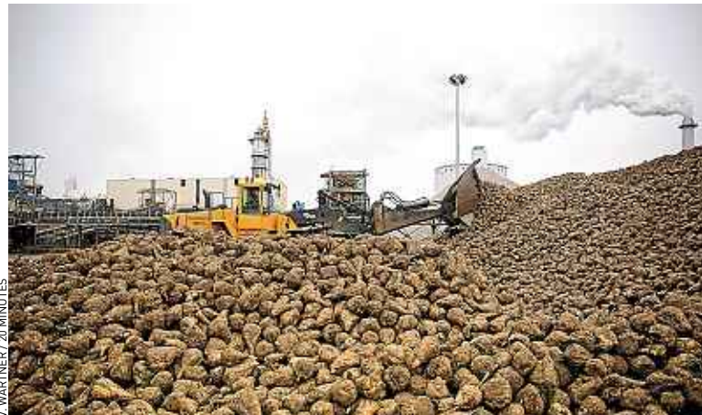
La France compte vingt-cinq sucreries, dont celle de Chevrières (Picardie)

Une spécialité française : le pays est le premier producteur mondial de sucre de betteraves. Un Français en consomme chaque année une vingtaine de kilos. Sous forme de poudre ou en morceaux, mais aussi dans les produits transformés. Du coup, si Chevrières est l'une des sucreries de la marque Béghin-Say, cette usine fournit aussi l'agroalimentaire. Dans son fichier clients se côtoient