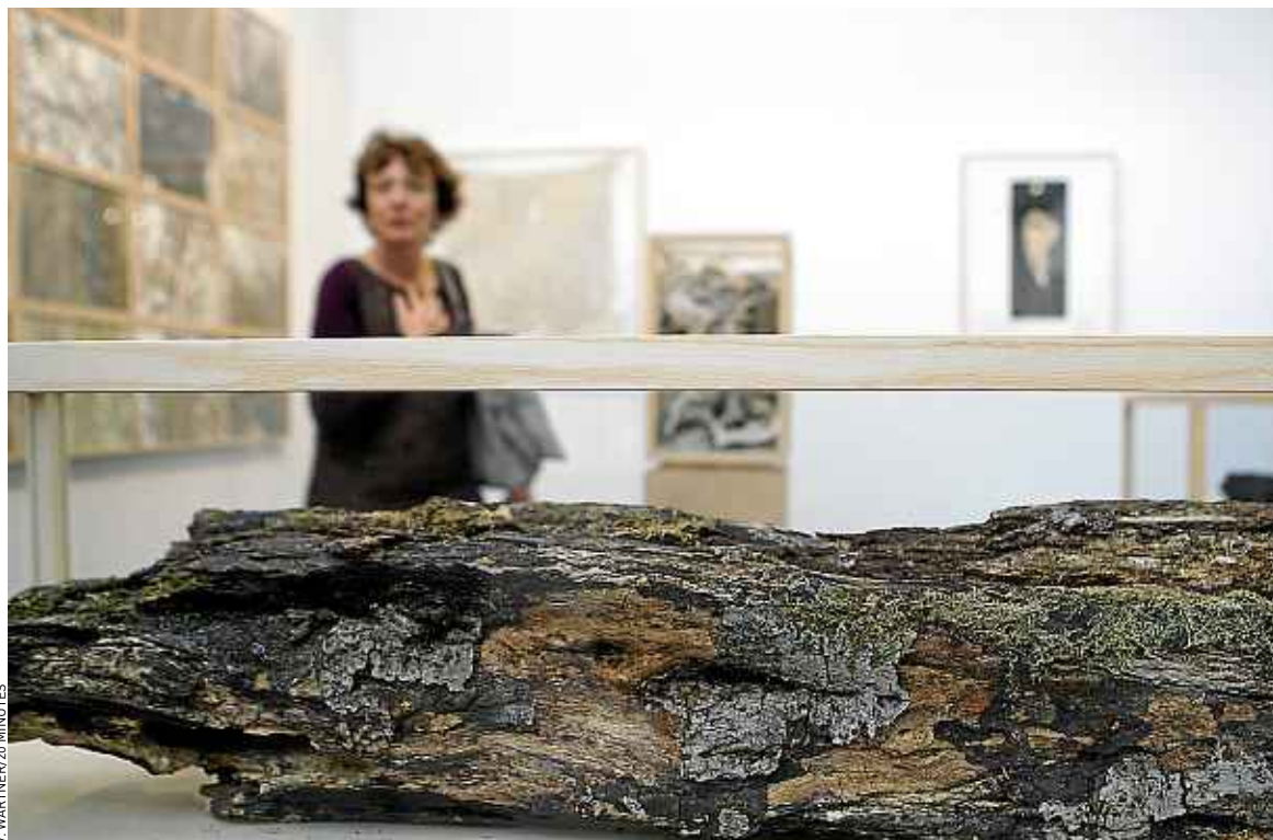
Cette œuvre de Herman de Vries, présentée à la Fiac ce week-end, va irrémédiablement s'altérer. A moins que...