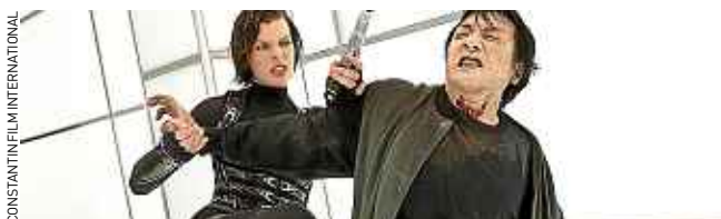
Milla Jovovitch et Jackie Chan dans l'opus « Retribution ».