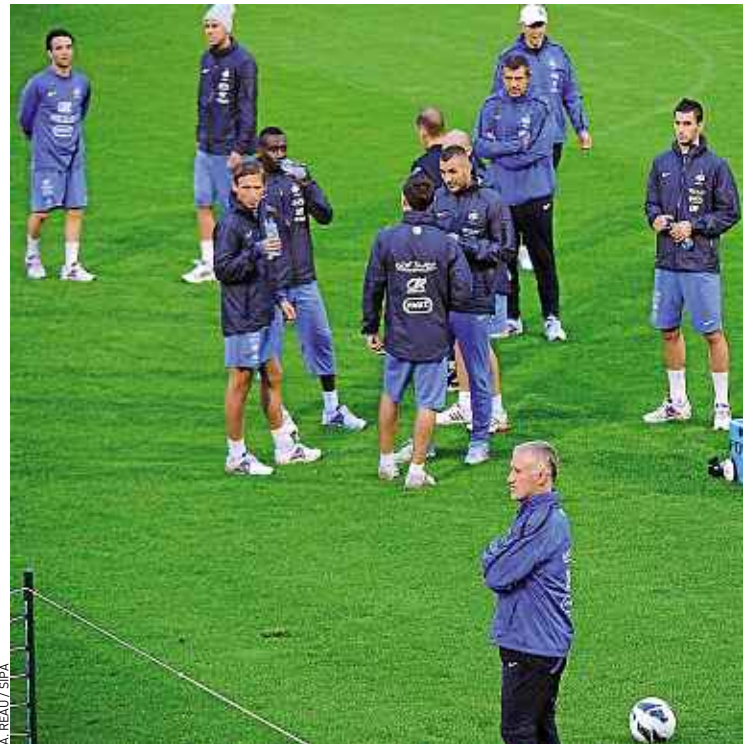
Deschamps a dû essayer de motiver ses joueurs toute la semaine.

Forcément, vous ne trouverez aucun joueur pour déclarer publiquement qu'il préfère voir ce match des tribunes plutôt que de le disputer. Mais le sélectionneur de l'équipe de France a tout de même dû faire un peu de média training pour maintenir un semblant d'illusion autour du « choc » contre le Japon. Les joueurs trouvent-ils ce match impor-