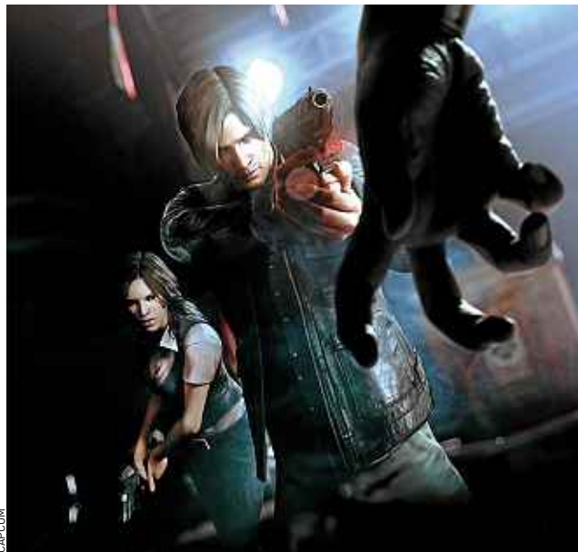
Au premier plan, Leon Scott Kennedy, personnage phare de la série.