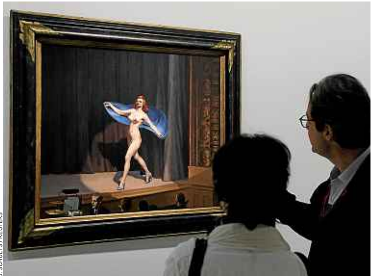
L'expo rassemble la quasi-intégralité des toiles de Hopper, dont Girlie Show .

PKJ • www.pocketjeunesse.fr POCKET JEUNESSE