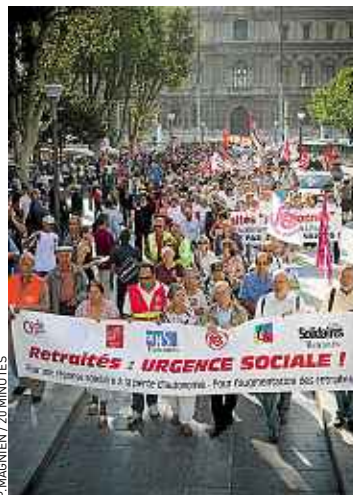
A Marseille, le 6 octobre 2011.