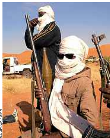
La France milite pour une intervention militaire au Nord-Mali.

« Cela risque d'être une journée tendue », glisse-t-on à l'Élysée. Après son discours de Dakar, François Hollande se rendra au 14 e sommet de la francophonie à Kinshasa, capitale de la République démocratique du Congo. Le chef de l'Etat souhaite y évoquer la « démocratie », « la lutte contre toutes les corruptions » et rencontrer les opposants au président Joseph Kabila. Une initiative peu appréciée par le pouvoir congolais.