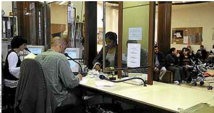
66 % des Français ne connaissent pas l'investissement solidaire responsable.