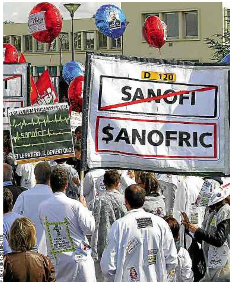
Les salariés de Sanofi manifestent tous les jeudis contre la réorganisation.