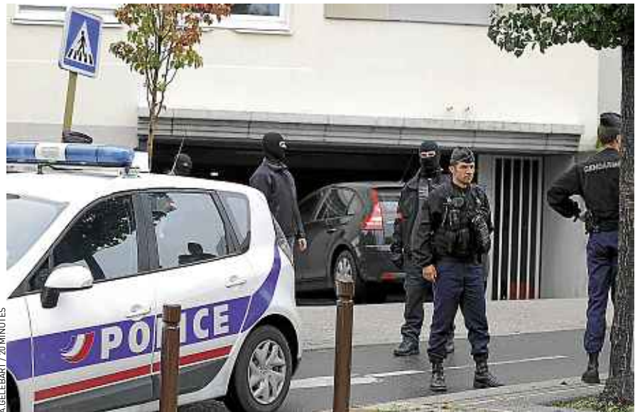
A. BELEBART / 20 MINUTES

Les riverains du quartier décrivent un jeune homme « sans histoire ». « Il était un peu turbulent, c'est vrai. Mais comme tous les jeunes de son âge », explique un quinquagénaire. Un de ses amis, qui l'a fréquenté « de temps en temps », parle d'un « mec bien ». « Je ne comprends pas », assène-t-il. L'imam de la mosquée de Torcy n'a pas non plus vu de signe extérieur de radicalisation ces dernières années. « S'il y a eu une dérive, c'est qu'il était cer-