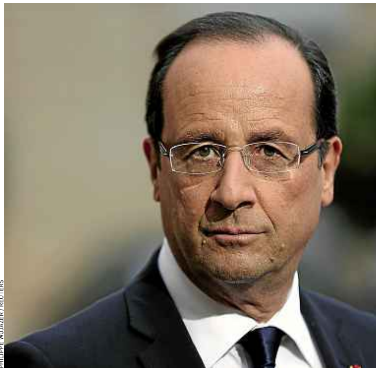
L'allocution de Hollande devant l'Assemblée sénégalaise a été très préparée.

Point d'orgue de ce déplacement, un discours prononcé devant l'Assemblée nationale sénégalaise, dans la ville où Nicolas Sarkozy avait déclaré « l'homme africain n'est pas assez entré dans l'histoire ». Une allocution jugée moralisatrice par les populations du continent. « Je ne vais pas en Afrique pour me différencier », a prévenu Hollande, dès mardi. L'Élysée conteste avoir concocté un contre-discours, mais le principe d'une grande allocution à Dakar pousse au parallélisme. « Nous tenions à commencer le déplacement par un pays où l'alternance démocratique s'est bien passé », se justifie un proche du chef de l'Etat. Officieusement, la référence à Sarkozy a pourtant guidé l'écriture de ce discours, l'un des plus préparés depuis