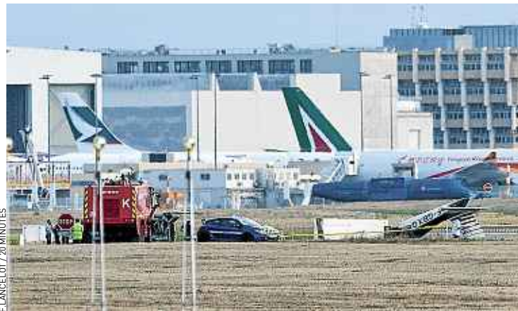
Le drame s'est produit en bout de piste, juste après le décollage.

pas dévoiler son plan de vol avant d'être sûre que les familles avaient été prévenues. L'appareil est tombé sur une bande herbeuse, il n'a ni pris feu, ni explosé au moment du crash. Son épave a été mise à l'abri dans un hangar pour les besoins de l'enquête qui a été confiée aux gendarmes des transports aériens. Le trafic de l'aéroport a été interrompu pendant une heure. En tout, quatre vol ont été annulés, neuf déroutés, et plusieurs autres retardés. ■