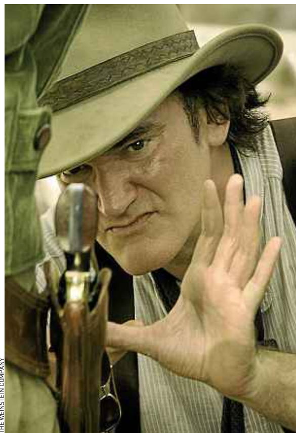
Django Unchained , de Tarantino, sur les écrans le 16 janvier.