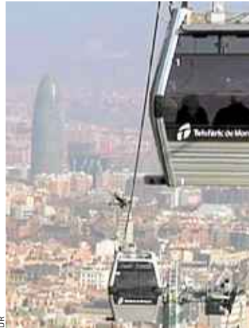
La ville de Barcelone a déjà sa ligne aérienne câblée.

Et mercredi, des élus et techniciens de toute la France se sont réunis à Toulouse pour une journée d'étude sur ce nouveau mode de transport. Il en ressort notamment qu'il faut que les cabines marquent un arrêt complet en station, sous peine d'être boudées par les personnes âgées ou à mobilité réduite. Globalement, ces lignes câblées