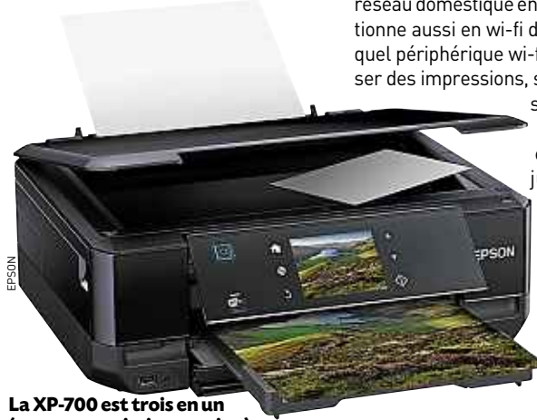
La XP-700 est trois en un (scanner, copie, impression).

R éinventer la roue – ou tout du moins l'impression –, c'est le pari gagné d'Epson, avec sa XP700. Compacte, cette nouvelle imprimante jet d'encre se destine à 60 %