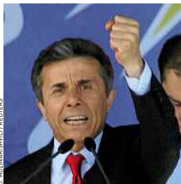
Le richissime Bidzina Ivanichvili.

Devenu chef de file de la coalition Le Rêve géorgien – qui compte des libéraux et des nationalistes xénophobes – Ivanichvili a annoncé qu'il arrêterait la politique dans « deux ou trois ans ». Persuadé de gagner les élections, il espère tirer profit des manifestations qui ont suivi le scandale provoqué par une vidéo montrant des sévices infligés à des détenus dans une prison du pays. Ce document, qui accredit l'idée d'une dérive du pouvoir, a été diffusé par deux chaînes hostiles au président, dont l'une lui appartient. L'homme a fait l'essentiel de sa fortune