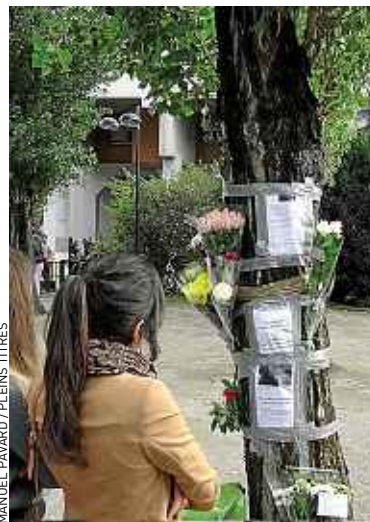
MANUEL PAVARD / PLEINS TITRES