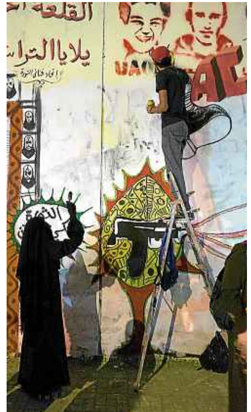
Les caricatures de l'actuel président Mohamed Morsi font leur apparition sur le mur de la rue Mahmoud (à gauche). Ce qui ne plaît pas au nouveau pouvoir.