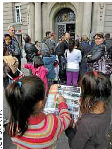
Les familles veulent un hébergement.

*Collectif pour l'accueil des solliciteurs d'asile