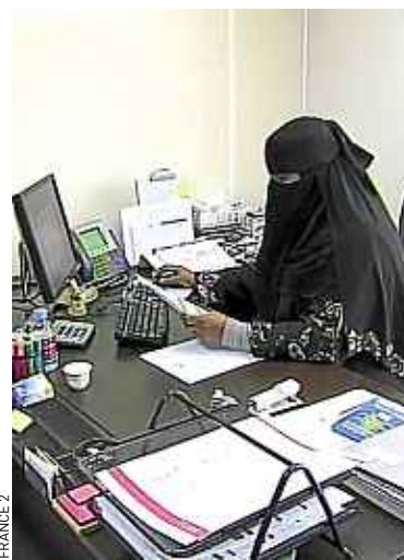
Une émission spécial Qatar.