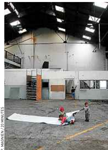
Les Roms ont investi un hangar.