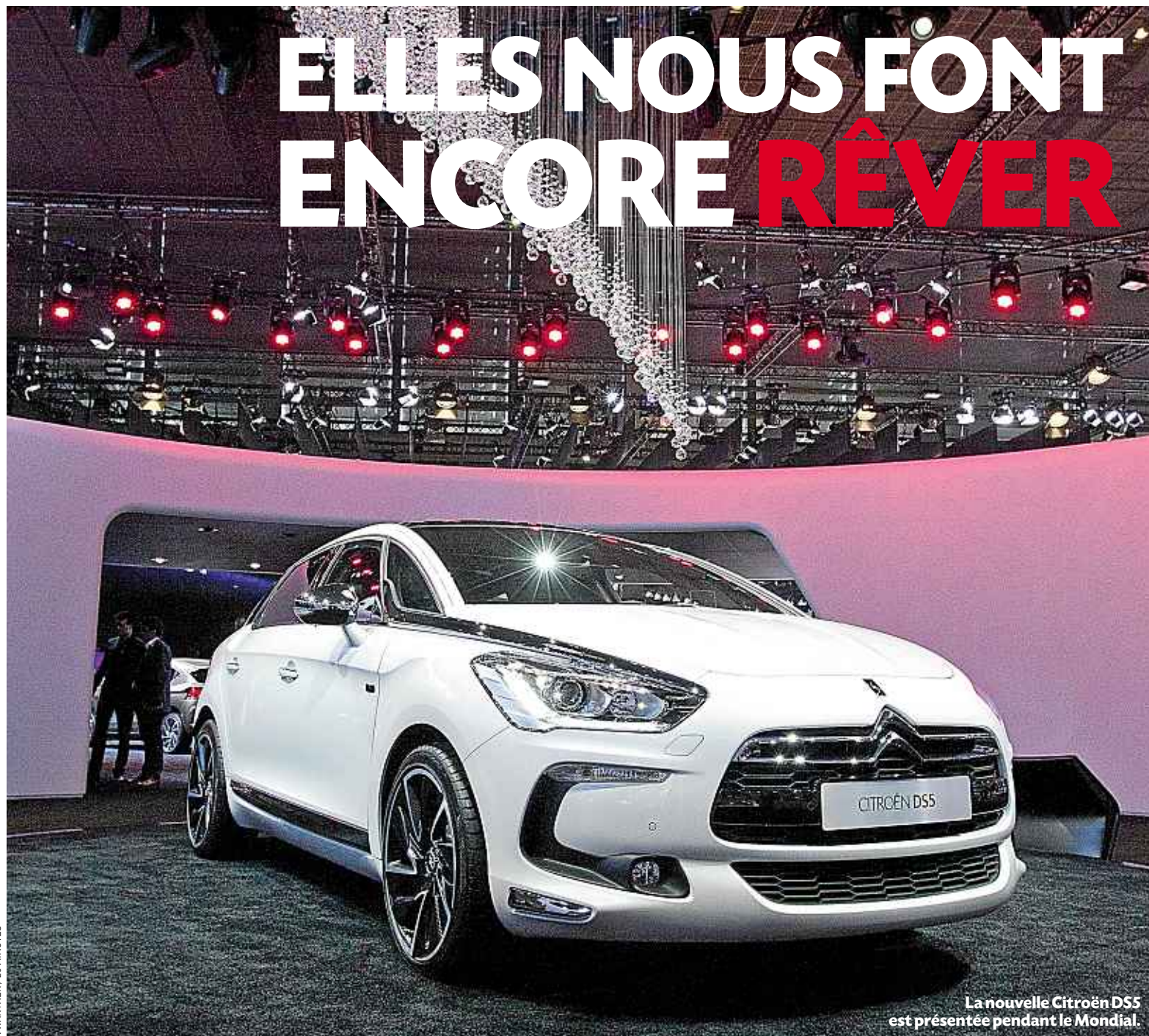
La nouvelle Citroën DS5 est présentée pendant le Mondial.