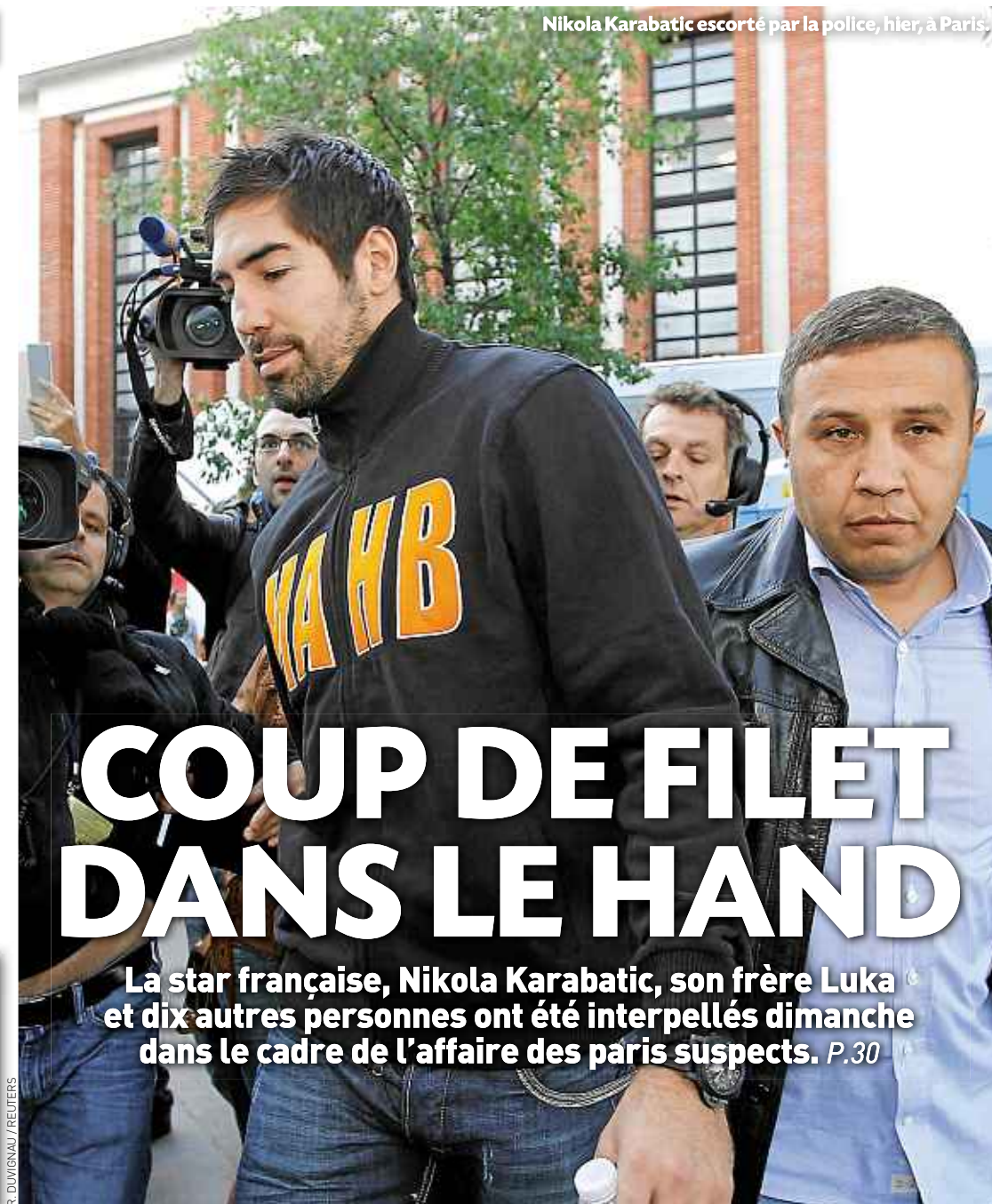
Nikola Karabatic escorté par la police, hier, à Paris.

« L'amour est dans le pré », une saison agitée P.26