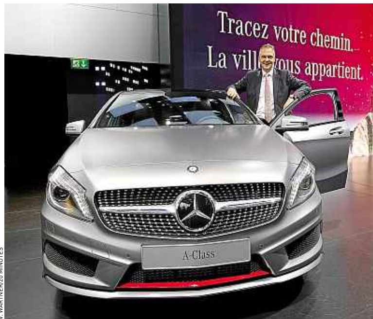
Avec sa Classe A, Mercedes concurrence la Série 1 de BMW et l'A3 d'Audi.

des compacts de luxe avec ses 4,29 m de long pour 1,43 m de haut. Nous allons donc concurrencer la Série 1 de BMW ainsi que la nouvelle A3 de chez Audi, nos rivaux historiques. Mais nous rivaliserons aussi avec la Ford Focus, la Renault Mégane, la Citroën C4 et la récente Volvo V40.