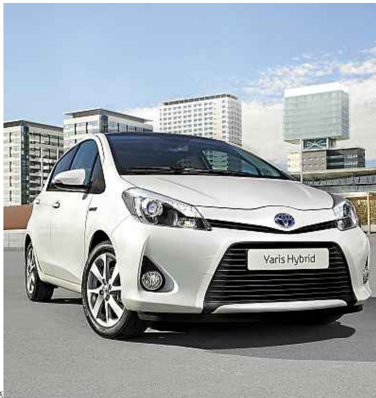
La Yaris Hybrid ne consomme que de 3,5 l/100 km et émet 79 g de CO 2 par km.

De fait, la Yaris Hybrid indique une consommation de 3,5 l/100 km et une émission de CO 2 de 79 g/km. Et lorsque l'on sait que son tarif débute à 18500 €, que le bonus gouvernemental est de 2000 € et que le constructeur vous propose de doubler cette offre sous conditions de reprise, on comprend mieux