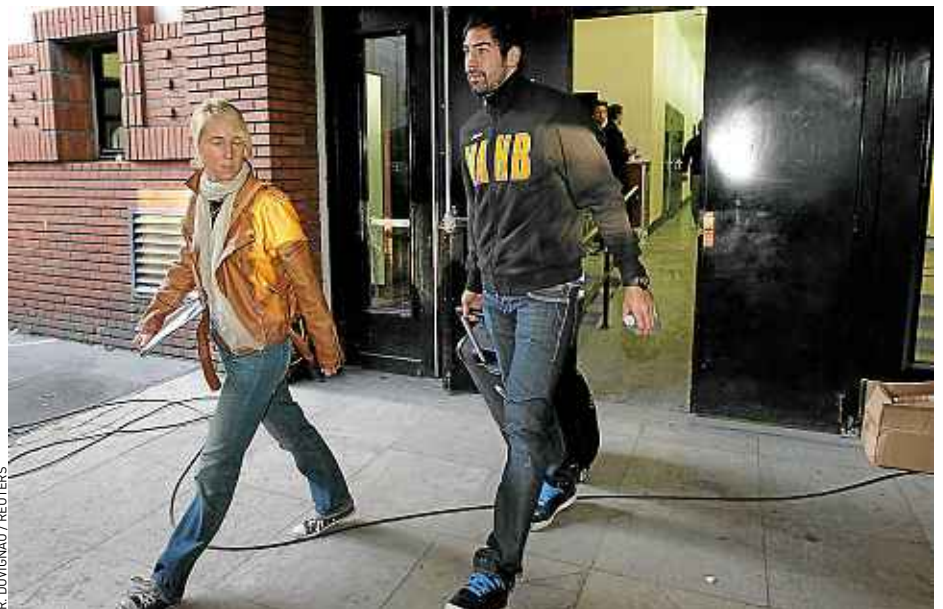
Nikola Karabatic a été escorté par la police après la rencontre contre Paris.