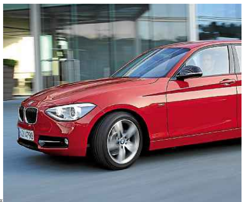
BMW (en photo, la Série 1) est la marque la plus populaire sur Facebook

Enfin, Peugeot, Citroën et Renault restent de loin les pages internationales françaises à être les plus populaires. Et nul doute qu'avec ce Mondial de Paris, leur rayonnement international va encore croître. ■