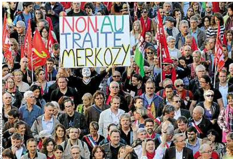
Les manifestants sont partis dimanche de la place de la Nation à Paris.