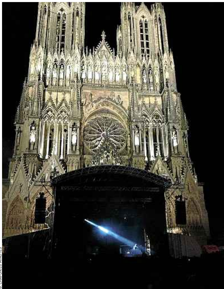
Le prince pop Sébastien Tellier au pied de la cathédrale des rois, vendredi.

Si on y ajoute La Cartonnerie, salle rock à la programmation maline (Woodkid y a rôdé le show qui a fait causer le tout-Paris la semaine dernière), et une municipalité accueillante, les artistes rémois devraient faire parler d'eux pour un bon bout de temps. Avec Elektriccity pour rendez-vous annuel. « Montrer de