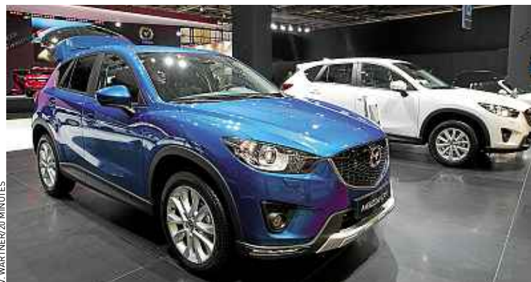
La Mazda C-X 5 respecte déjà les normes Euro 6 d'antipollution.

Sur la route, en revanche, elle offre une précision de conduite digne d'une compacte. Il est vrai que c'est le premier modèle de la marque à adopter l'ensemble des technologies Skyactiv, visant à réduire le poids d'au moins 100 kg,