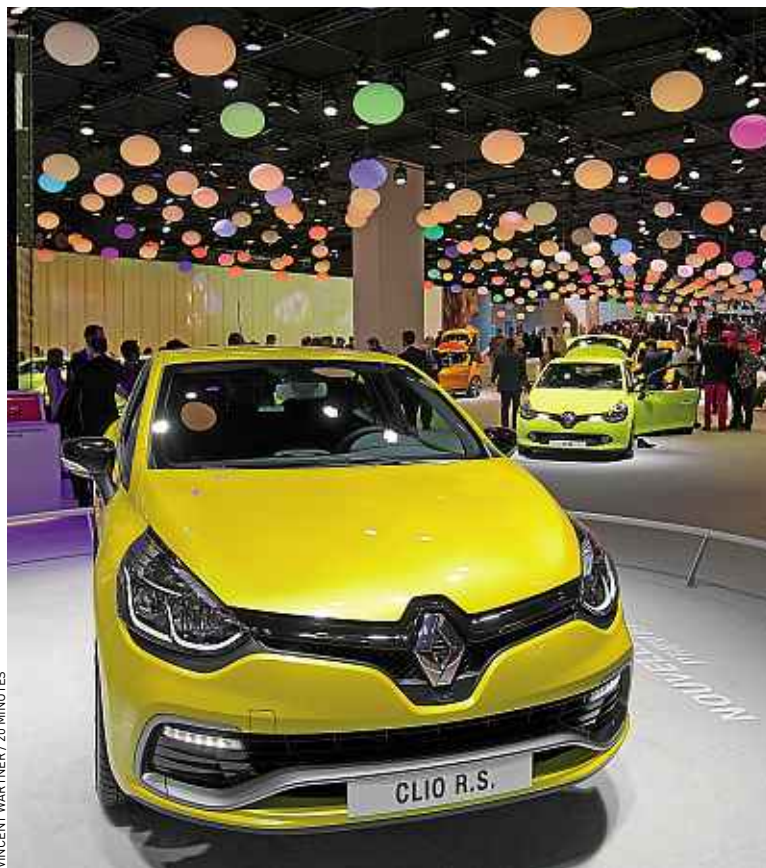
Renault et sa Clio IV RS sont parmi les acteurs remarquables de ce Mondial.

Chez nos voisins germaniques, la 7 e génération de la Golf fera comme toujours tourner les têtes. Si le design évolue peu, tout le reste change sur le modèle phare de VW. Chez Audi, la Sportback, version 5 portes de l'A3, rivalisera avec la future étoile de Mercedes, la nouvelle Classe A. BMW ne sera pas en reste, en