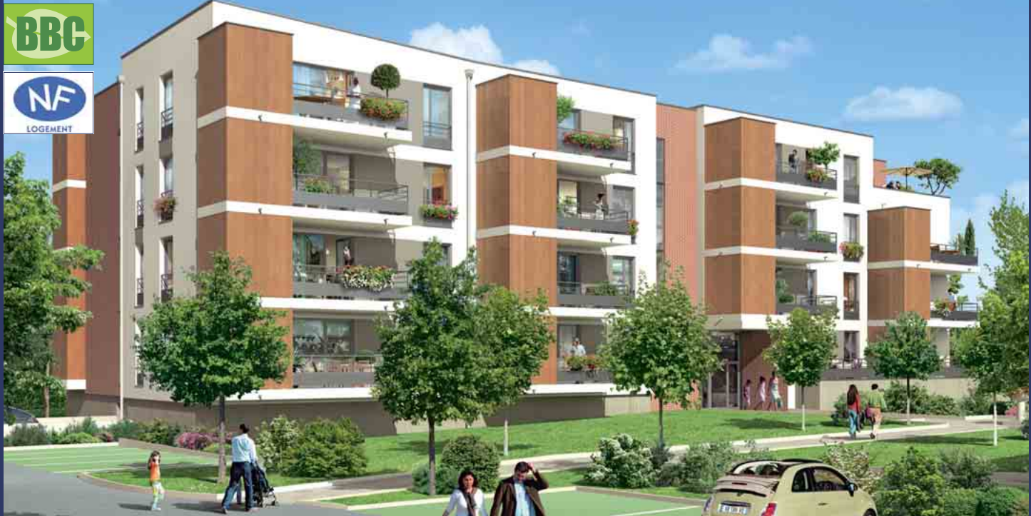
Illustration à caractère d'ambiance - Promogim Groupe S.A. RCS Nanterre 339 715 336.

À 120 M DU TRAM, DES APPARTEMENTS BIEN EXPOSÉS, AU CALME D'ESPACES VERTS