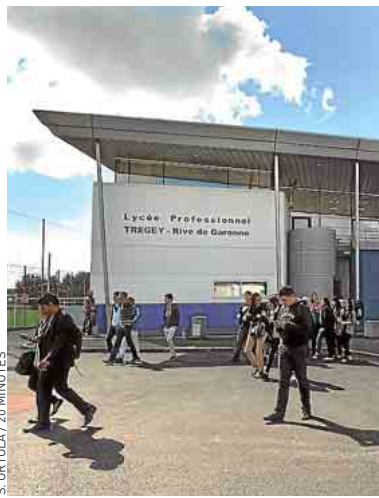
Devant le lycée Trégey, à Bordeaux.

A partir de ce jeudi, les associations Prévention routière et Assureurs prévention vont offrir aux écoles plus de 60 000 CD-Rom « Rue Tom et Lila », un programme court de 16 saynettes d'animation pour apprendre aux enfants à se déplacer en sécurité. Les films sont aussi disponibles sur les sites preventionroutiere.asso.fr et assureurs-prevention.fr .