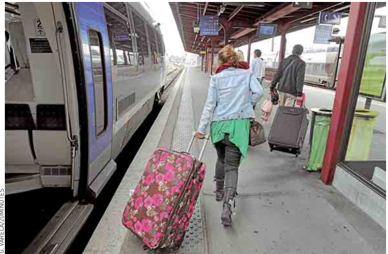
Le TER Alsace transporte en moyenne 75 000 voyageurs par jour.