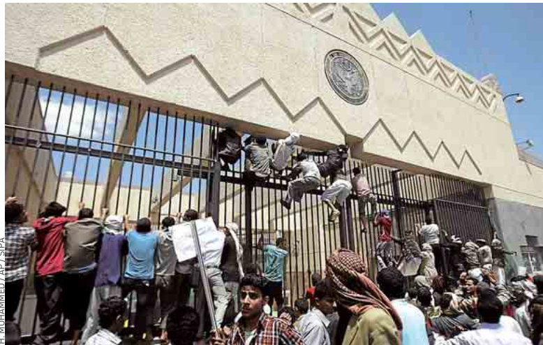
Des manifestants attaquent l'ambassade américaine à Sanaa au Yémen, jeudi.

A Sanaa (Yémen), des centaines de manifestants ont attaqué l'ambassade américaine, faisant un mort et 15 blessés. En Egypte, où des incidents avaient déjà éclaté mardi, des manifestations devant l'ambassade américaine, restée fermée, ont fait 70 blessés. Des rassemblements de protestation ont aussi eu lieu à Tunis mercredi soir, ainsi qu'en Iran et au Bangladesh jeudi. Une milice chiite irakienne a menacé de s'en prendre aux intérêts américains et les autorités afghanes ont fermé le site Internet YouTube, où le film est visible, afin de minimiser les risques de violences. De nouvelles manifestations sont attendues à travers le monde arabo-musulman à l'occasion des