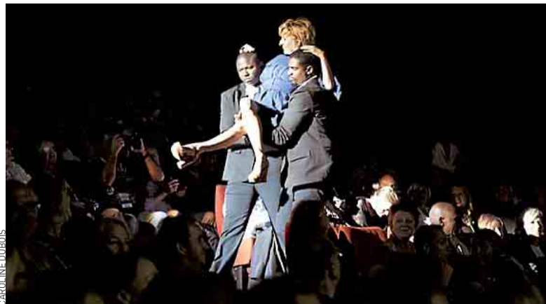
La comédienne Sophie Mounicot lors de la cérémonie d'ouverture.