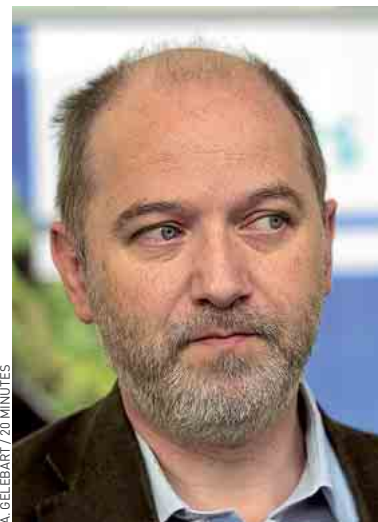
Denis Baupin, député EELV.

logie est pourvoyeuse d'emplois et de croissance », lâche Denis Baupin, député EELV, inscrit à la table ronde sur l'énergie. Alors que la conférence ouvrira un long cycle de négociations (près de huit mois sur le thème de l'énergie), les écologistes espèrent des décisions rapides sur plusieurs thèmes, par exemple sur l'isolation des logements ou la relance de la filière du renouvelable. ■ M. GO.