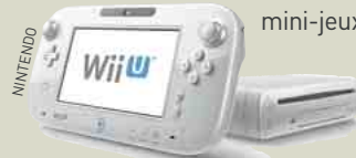
La GamePad et la console Wii U.