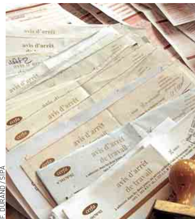
Leur nombre a explosé en dix ans.

Parmi les départements enregistrant plus de 11 jours indemnisés par salarié, il y a notamment l'Ardèche, l'Isère, le Gard, l'Eure, le Jura, la Moselle, le Nord, l'Oise ou encore le Tarn. De même, la durée diffère selon les territoires. Si les arrêts de plus de trois mois représentaient 11 % du total des arrêts en 2010, leur part est supérieure