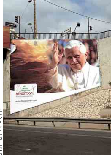
Le pape arrive ce vendredi au Liban.