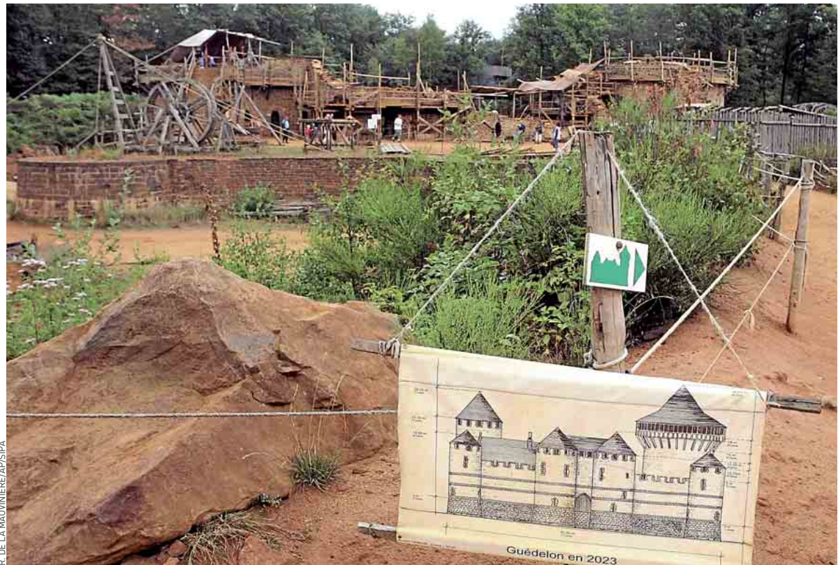
A Guédelon, on en rajoute au schmilblick en construisant un château fort médiéval avec les techniques de l'époque.

Tout devient « patrimoine ». Cette année, pour les Journées européennes, on pourra ainsi visiter des start-ups numériques françaises qui, d'ici un siècle, seront peut-être classées Monuments historiques, comme le sont actuellement à tour de bras des usines du patrimoine industriel de la fin du XIX e siècle. D'abord jugée populiste, la crainte de voir le pays s'ankyloser sous le poids de son patrimoine se propage jusque chez ceux censés le préserver. Plusieurs architectes du patrimoine préparent ainsi une lettre ouverte en faveur de la création de sous-catégories de monuments classés permettant d'assouplir certaines règles de conservation. Mais même ainsi, le coût, non négligeable en temps de rigueur budgétaire, de la préservation de notre patrimoine est consi-