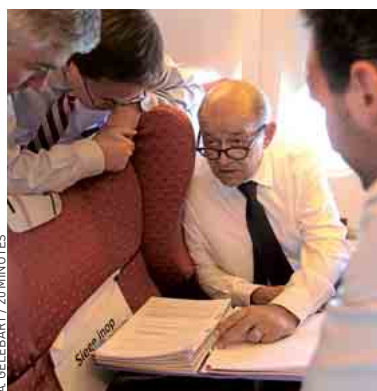
Jean-Yves Le Drian, jeudi.

la possibilité d'instaurer une zone d'exclusion aérienne en Syrie ?