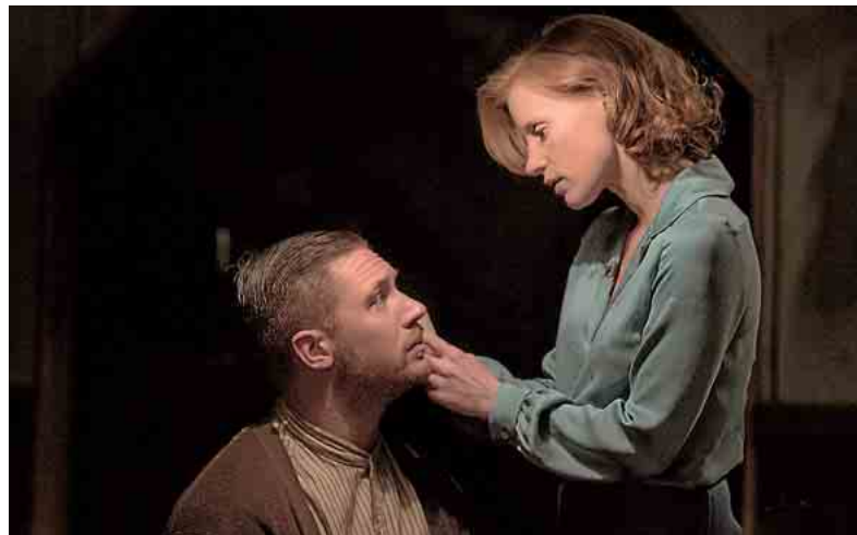
Shia LaBeouf (à gauche) et Tom Hardy (à droite avec Jessica Chastain) incarnent deux des trois frères Bondurant, trafiquants d'alcool dans les années 30.

WESTERN « Des hommes sans loi » transporte le spectateur au cœur de la prohibition