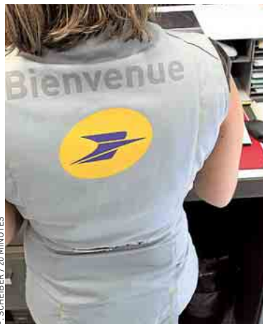
Dans un bureau de poste à Toulouse.

Pour l'auteur du rapport, Jean Kaspar, personnalité extérieure à l'entreprise et ancien leader de la CFDT, « La Poste a mené une transformation nécessaire avec l'exigence très forte de maintenir son modèle social ». Et pourtant, les indicateurs sont préoccupants : chaque année, l'absentéisme représente l'équivalent de 16 500 agents et le groupe dénombre plus de 10 000 accidents du travail. Et ce, malgré la forte réduction des effectifs. Si le mal-être des postiers est réel, ses causes sont multiples.