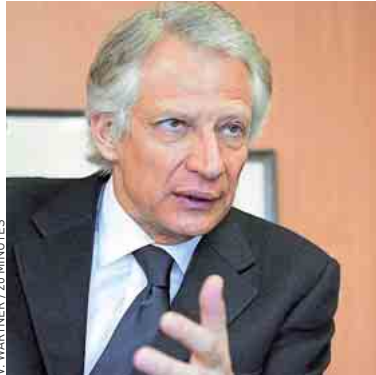
Dominique de Villepin.

« E ssayer de m'impliquer dans une affaire dans laquelle je n'ai rien à voir est insupportable ! », assénait-il en décembre. Dominique de Villepin a dû avoir du mal à supporter la journée de mardi. Il a été placé en garde à vue sept heures dans une caserne de gendarmerie parisienne pour s'expliquer sur l'affaire Relais & Châteaux. Et surtout sur les liens qu'il entretenait avec Régis Bulot. L'ancien président de cette association d'hôtellerie de luxe est incarcéré depuis novembre 2011 pour « abus de confiance ». Il est soupçonné d'avoir mis en place un système de commissions occultes pour l'impression d'un guide, dont le préjudice est évalué à 1,6 million d'euros. Or, avant la révélation de cette affaire, Villepin aurait fait pression sur les actuels patrons de Relais & Châteaux pour qu'ils taisent les agissements de leur prédécesseur. L'ex-Premier mi-