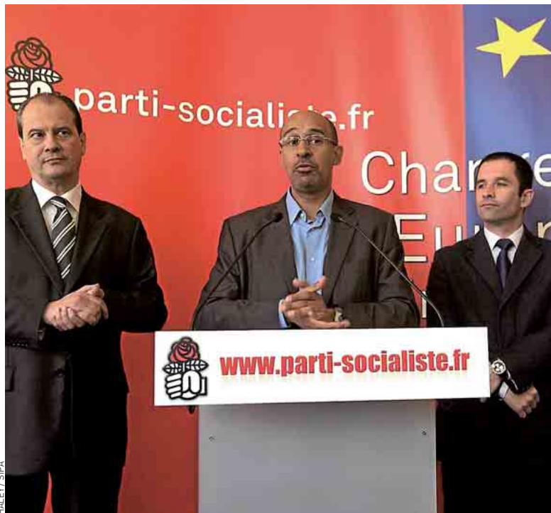
Jean-Christophe Cambadélis, Harlem Désir et Benoît Hamon (de g. à dr.).

Les succès de 2012 n'auraient-ils vacciné personne ? Surtout pas les ministres et autres cadres de Solférino, en tout cas. « Chaque chef à plumes veut sa part du gâteau, notamment Peillon, Moscovici et bien sûr Le Foll [pour les hollandais]. Martine n'est pas la moins gourmande. C'est assez moche ce qu'il se passe », grince un hiérarque du parti. En cette année de victoires électorales, la tambouille interne est particulièrement épicée. Puisque Ayrault et Aubry