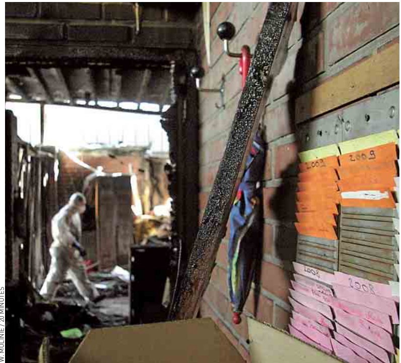
Les travaux ont débuté à la maternelle Voltaire, incendiée par les émeutiers.

Le plastique fondu des poubelles incendiées jonche encore le bitume des quartiers nord. Stigmates des violences urbaines d'Amiens, survenues il y a un mois, le 13 août dernier, à la suite d'un contrôle routier qui a mal tourné, en marge de l'enterrement d'un jeune homme de 20 ans. Le moindre incident est prétexte à l'embrasement : mercredi dernier, le simple contrôle d'identité d'un usager de deux-roues a nécessité l'appui de plusieurs camions de CRS. « Fallait qu'on se fasse respecter. Leur montrer aux flics qu'ils avaient abusé de sortir les bombes lacrymos pendant un enterrement. Mais les émeutes n'ont rien changé. On a encore plus la haine, raconte un jeune homme, au pied des bâtiments de brique rouge de la rue Fafet. Pour la majorité des gens, mon quartier, c'est juste pour acheter du shit. Ils ne voient pas comment on galère ici. » Plus loin, Ali, 50 ans, connaît bien certains jeunes qui ont embrasé la ville, classée en zone de sécurité prioritaire par Manuel Valls ( lire ci-dessous ). « La seule chose que les gamins voient de l'Etat, ce sont les descentes de cars de CRS. On ferait mieux de leur trouver du boulot. » Selon lui, si les jeunes ont brûlé la salle