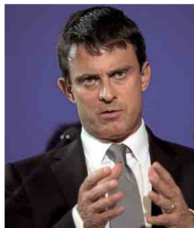
Manuel Valls, mardi à Saint-Ouen.

Un individu est jugé en comparution immédiate ce mercredi à Amiens pour « provocation à attroupement armé ». « Il lui est reproché d'avoir incité les gens, qui étaient près de lui lors des émeutes, à jeter des pierres sur des fonctionnaires », selon le procureur d'Amiens. Il risque un an de prison.