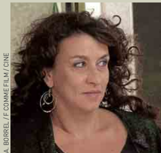
A. BORREL / F. COMME FILM / CINE