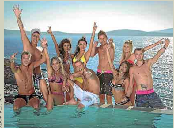
ABACAPRESS.COM A LILLE, GILLES DURAND Pour la rentrée, les « Ch'tis » ont débarqué à Mykonos.

lien. « On a déjà une réputation infondée de débiles vulgaires », s'énerve Amandine « Grâce à eux, ça va être une réputation mondiale ! » Cynthia, en revanche, adore l'émission : « On s'en fout des préjugés ». Ouf ! Archibald est du même avis : « Ça me détend... C'est assez drôle de les croiser maintenant en bas de chez moi, en plein centre de Lille... Il en faut pour tous les goûts ! » ■