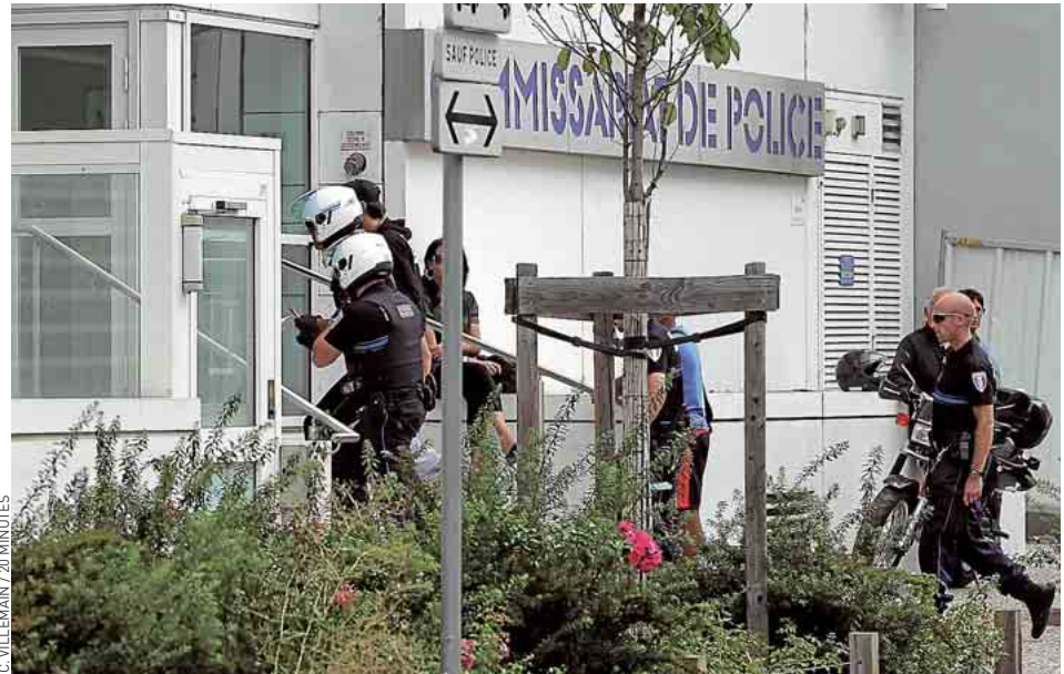
Les policiers ont été placés en garde à vue au commissariat de Villeurbanne, mardi.

Tous sont soupçonnés d'avoir entretenu des relations douteuses avec deux frères de Vénissieux, trafiquants présumés. La suite des investigations, menées depuis un an par la sûreté départementale du Rhône et la police des polices, devra établir si ces fonctionnaires ont entravé des procédures touchant cette famille et perçu, en contrepartie, des avantages matériels. Ces fonctionnaires « ont des choses à dire et ils les formulent