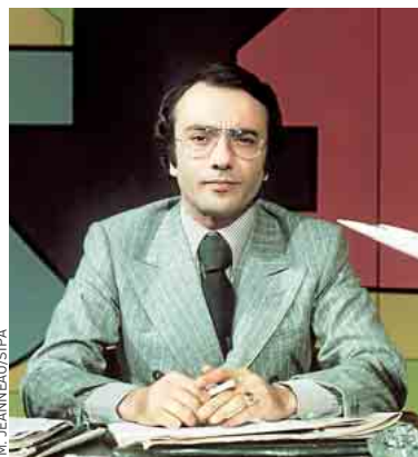
Mourousi, ex du 13 heures de TF1.