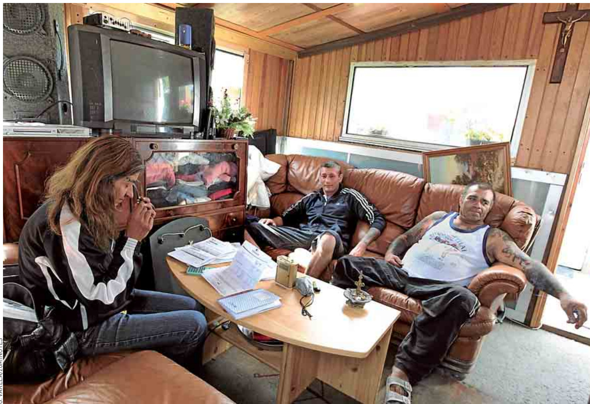
Résidant sur quatre campements strasbourgeois différents, 110 personnes sont sous la menace d'une expulsion.