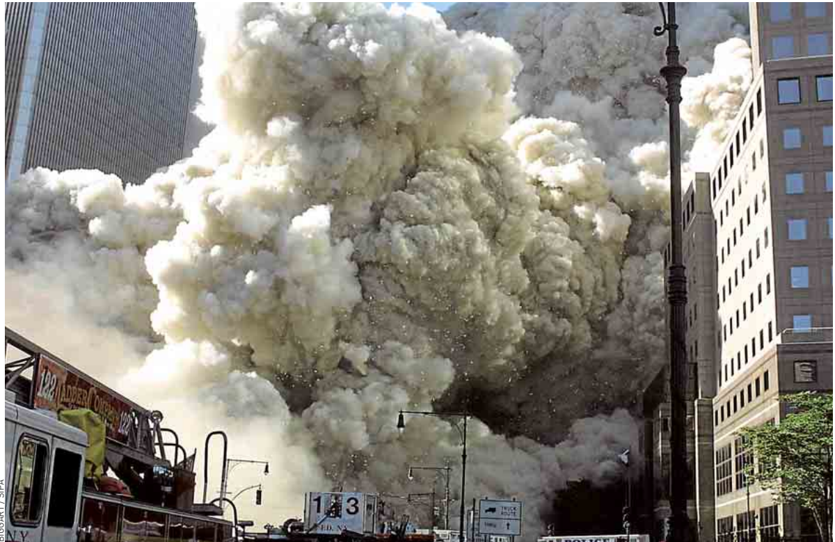
Le 11 septembre 2001, lors des attentats du World Trade Center, à New York.

Les talibans ont menacé lundi d'enlever et de tuer le prince Harry. Le petit-fils de la reine Elisabeth, troisième dans l'ordre de succession au trône britannique, a été envoyé la semaine dernière en Afghanistan comme pilote d'hélicoptère. Il a été affecté pour quatre mois à Camp Bastion, dans l'Helmand, une province du Sud où les rebelles islamistes sont très actifs. « Nous faisons tout notre possible pour se débarrasser de lui, en le tuant ou en l'enlevant », a déclaré à Reuters par téléphone le porte-parole des talibans, Zabihullah Mujahid. « Nous avons demandé à nos commandants opérant dans l'Helmand de faire le maximum pour l'éliminer. » Il n'a pas donné d'autres précisions. A Londres, le ministère de la Défense n'a pas commenté. Le prince Harry, 27 ans, avait déjà été affecté en Afghanistan en 2008 en tant que contrôleur aérien. Il y a deux semaines, il faisait la une du tabloïd The Sun avec des photos compromettantes d'une soirée arrosée en galante compagnie dans un hôtel de Las Vegas. ■