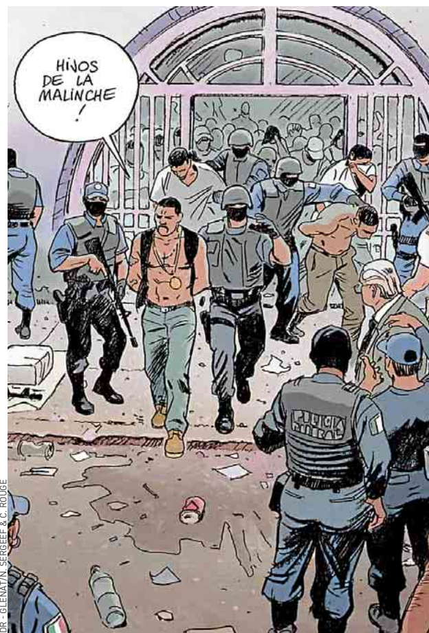
Narco-trafiquants et flics jouent au chat et à la souris.