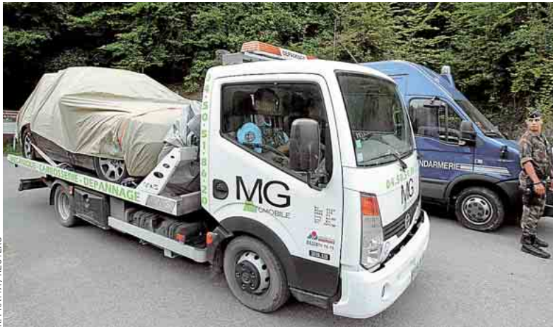
Un camion transporte la BMW dans laquelle ont été découverts les cadavres.

CHEVALINE L'enquête sur la tuerie se poursuit