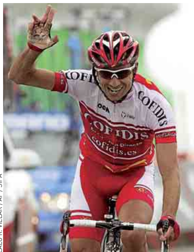
Le Français David Moncoutié.