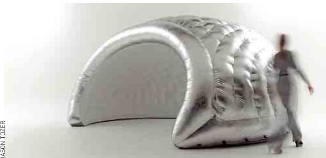
Espace intérieur gonflable « Luna », création Inflate.