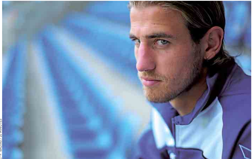
J.-F. BADIAS / 20 MINUTES

Perrin, grand pote de Ludovic Golliard depuis leurs trois an-