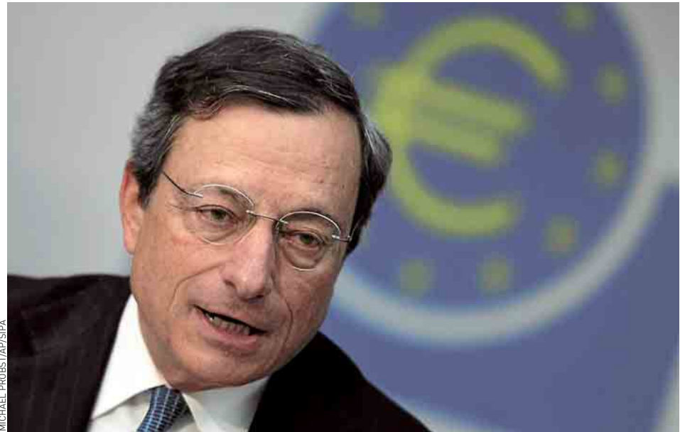
Les propos de Mario Draghi, président de la BCE, ont une nouvelle fois rassuré les marchés.

Berlin veut éviter que cette aide n'amène les pays bénéficiaires à différer l'assainissement de leurs finances publiques. C'est pourquoi la BCE s'est résignée à une concession. Les pays en difficulté de-