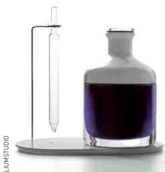
Vinaigrier pour Epicurien. Porcelaine et verre soufflé, EliumStudio.

► Yes future. Vincent Grégoire ne regarde pas demain, mais après-demain. « Nouvelles matières, nouveau mode de vie virtualisé, problèmes liés au manque de matière première et d'énergie. Voici des données qu'intègrent désormais les designers », affirme-t-il. Dans le futur, le design (est) et sera de plus en plus immatériel : « On structurera l'espace avec de la lumière et du son. » Les nouvelles technologies dessinent les contours d'un monde inédit où « le bien-être et le confort seront le véritable luxe ». Terminé l'avoir, la tendance, c'est être. ■