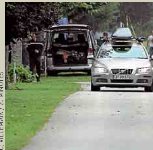
C. VILLEMAIN / 20 MINUTES