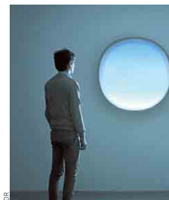
Station météo « Demain est un autre jour », Mathieu Lehanneur.