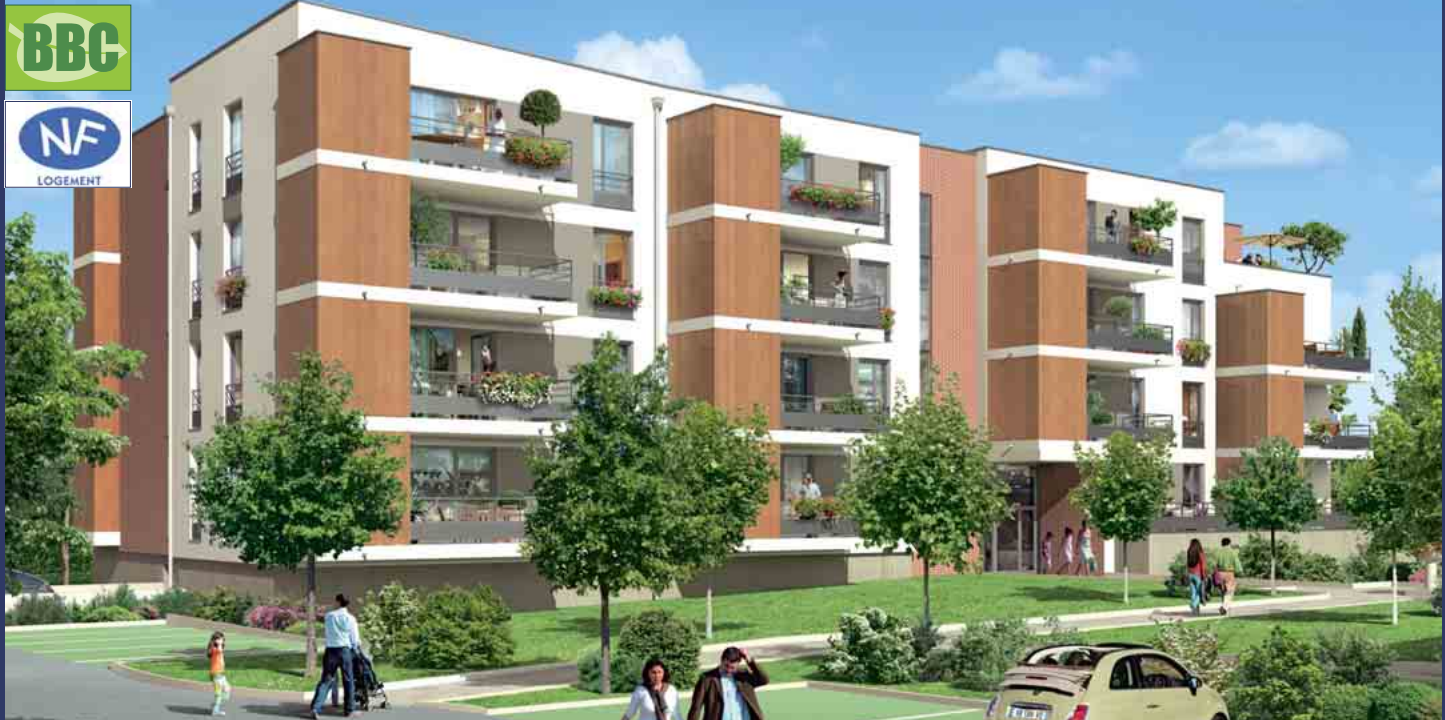
Illustration à caractère d'ambiance - Promogim Groupe S.A. RCS Nanterre 339 715 336.

À 120 M DU TRAM, DES APPARTEMENTS BIEN EXPOSÉS, AU CALME D'ESPACES VERTS