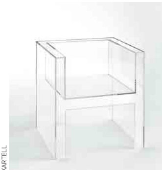
Fauteuil invisible Tokujin Yoshioka pour Kartell.