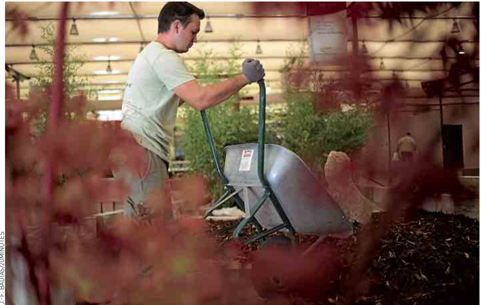
La mise en place du jardin, sur les 100 m 2 de la place des artisans, s'est achevée jeudi soir.