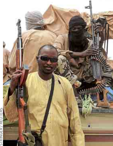
Un milicien du groupe Ansar Dine.

La confusion subsistait jeudi sur le type d'intervention. Simple aide logistique et matérielle? Déploiement de combattants? Les interprétations divergent, faute de consensus au sein même du pouvoir à Bamako – notamment entre le président par intérim, le Premier ministre, et une partie de l'armée, hostile à toute intervention militaire étrangère. Seule certitude : « Aucune intervention de la Cédéao ne sera possible sans l'aval de l'armée », souligne Gilles Yabi, chercheur à l'International Crisis Group (ICG)