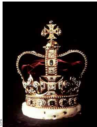
Les bijoux de la discorde.

par la BBC. « Les Britanniques avaient eux aussi demandé au XIX e siècle la restitution des corps des Plantagenêt. Comme d'habitude, ce sont les Anglais qui ont tiré les premiers ! » La pétition sera envoyée le 9 septembre à la reine et au 10 Downing Street. Le très sérieux service de presse de Sa Majesté a d'ores et déjà fait savoir que Buckingham Palace ne réagirait pas avant de la recevoir. To be continued. ■ ALEXANDRESULZER