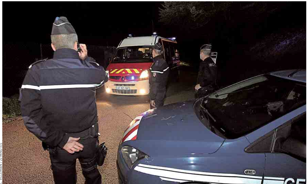
La section de recherches de la gendarmerie d'Annecy, ici à Chevaline mercredi soir, est en charge de l'enquête.