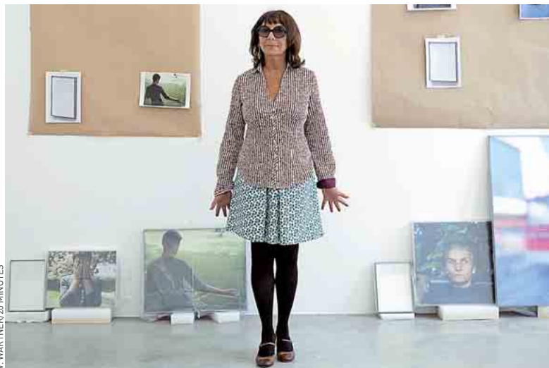
Sophie Calle photographie des aveugles et ce qu'ils ont vu avant de l'être.

Photographier les yeux de quelqu'un qui ne voit pas, parler à quelqu'un qui ne vous voit pas, de quelque chose qui n'est plus « là », présente déjà un po-