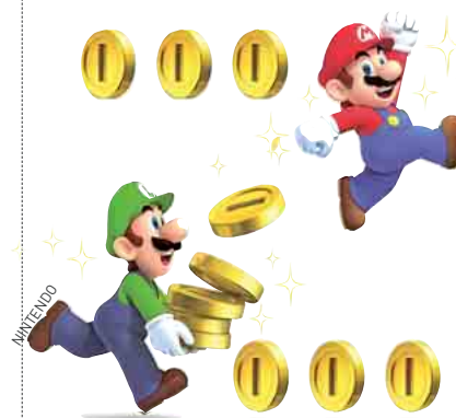
Des plombiers payés à la pièce.

gnant depuis une pichenette de l'index sur l'écran de son smartphone les appareils restés allumés. Energisant! Toshiba envisage la commercialisation de sa solution domotique au plus tard début 2013. Il faudra tout de même compter plusieurs centaines d'euros pour un pack de démarrage et sans doute 40 € par Smart Plug. Faire des économies a un prix... ■