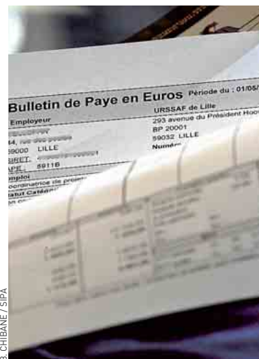
Les revenus ont baissé depuis 2009.