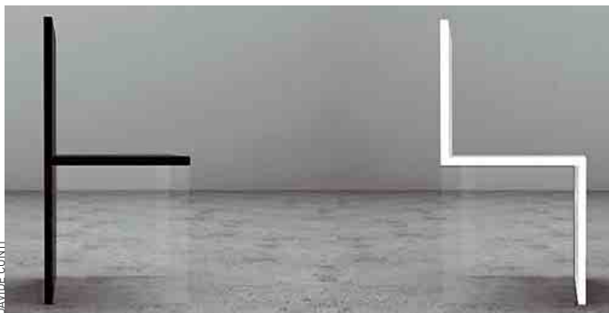
Magica Chair, créées par Davide Conti pour Bizzarline.