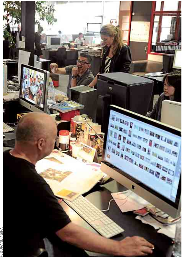
Se ménager des pauses dans la journée permet de relativiser.

Enfin, pour recalculer ses horaires de sommeil, le mieux reste de se coucher tôt régulièrement. Mais rien n'interdit de s'offrir une petite sieste le week-end et pour les plus chanceux en semaine. « Ça reste encore tabou, mais dormir quinze-vingt minutes après l'heure du déjeuner est un besoin physiologique », explique-t-on chez Sixta, spécialiste de la sieste en entreprise. Un petit break au bon goût de farniente estival. ■