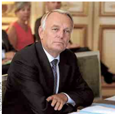
Jean-Marc Ayrault, jeudi à Matignon.

M arseille est « une question d'intérêt national » pour le gouvernement. Réunis à Matignon autour de Jean-Marc Ayrault, les ministres ont planché jeudi sur l'avenir de la cité phocéenne. Le Premier ministre, qui ne veut pas entendre parler de « mise sous tutelle », a voulu « redonner espoir » à ses habitants. « Marseille doit repartir de l'avant et réussir », a insisté le Premier ministre, qui s'y rendra lundi et mardi.